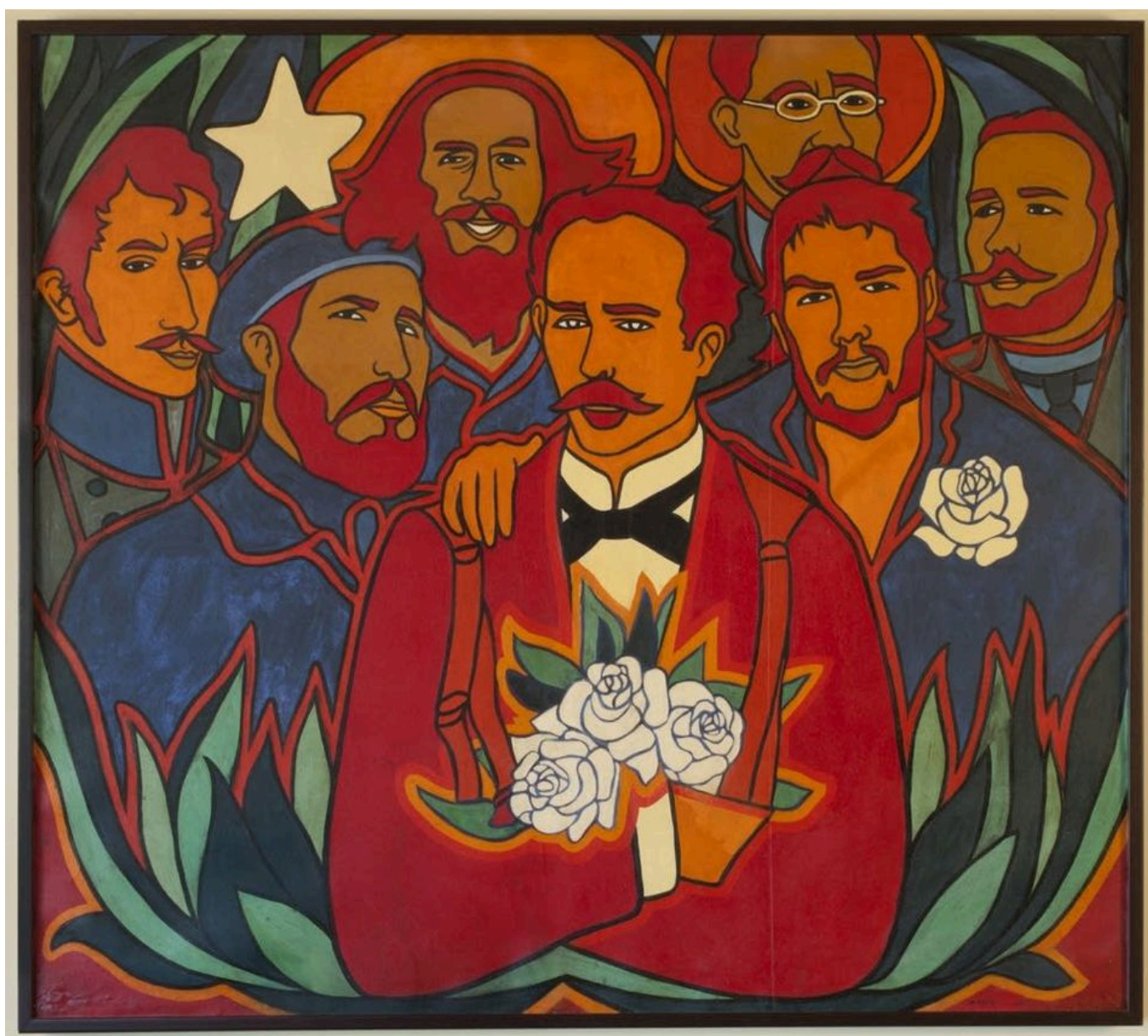
Raúl Martínez (Cuba), Rosas y Estrellas (« Roses et étoiles »), 1972.

Bien que le blocus ait coûté à la Révolution cubaine des centaines de milliards de dollars depuis 1960, il n'a pas pu empêcher la révolution de renforcer la dignité du peuple. Par exemple, la Banque mondiale a rapporté qu'en 2020, malgré le blocus sévère et la pandémie de COVID-19, le gouvernement cubain a consacré 11,5 % de son produit intérieur brut à l'éducation, tandis que les États-Unis en ont dépensé 5,4 %. Non seulement toutes les écoles sont gratuites pour les enfants cubains, mais tous les enfants cubains reçoivent des repas à l'école et reçoivent leur uniforme. De même, l'enseignement médical est gratuit à Cuba , ce qui se traduit par un ratio médecin/patient élevé de 8,4 médecins et 7,1 infirmières pour 1 000 Cubains. Lors de l'Assemblée générale des Nations Unies, le ministre cubain des Affaires étrangères, Bruno Rodríguez Parrilla, a déclaré que « l'attention portée à l'être humain a été et continuera d'être la priorité du gouvernement cubain ». Le blocus est peut-être une « guerre économique », a-t-il dit, mais la Révolution cubaine – qui fait face à ce « siège économique » depuis des décennies – ne fléchira pas. Elle tiendra bon.