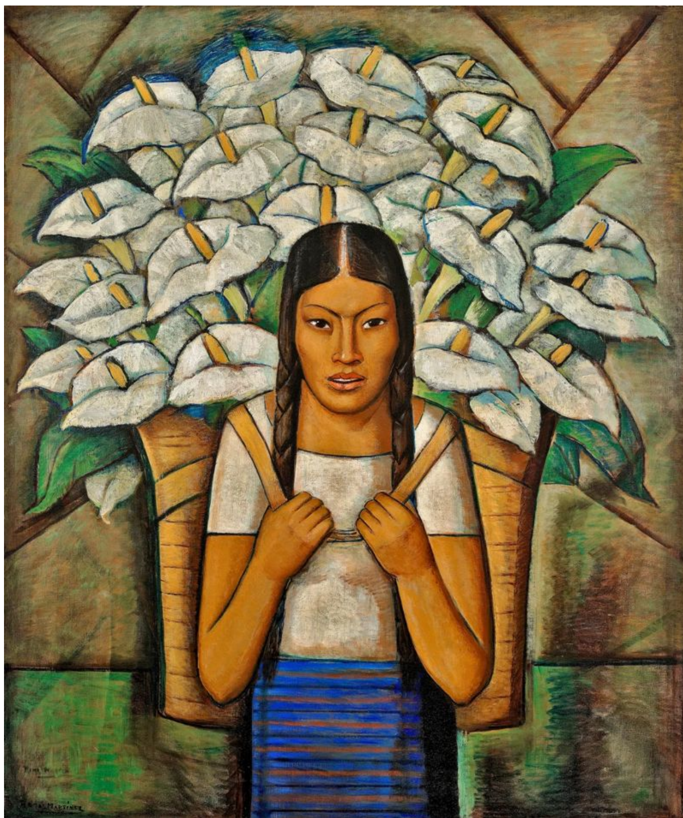
Alfredo Ramos Martínez (Mexique), Vendedora de Alcatraces (Vendeuse de lys), 1929.

Au cours des dernières semaines, trois élections particulièrement importantes ont eu lieu en Inde, au Mexique et en Afrique du Sud. L'Inde et l'Afrique du