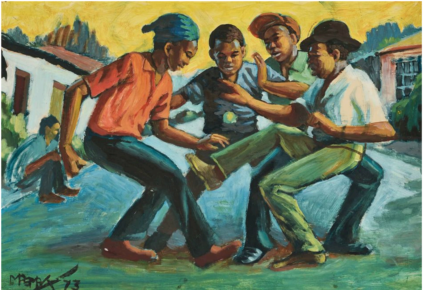
George Pemba (Afrique du Sud), Township Games (Jeux de township), 1973.

Cette année, en mai, trente ans après la fin de l'apartheid, l'Afrique du Sud a tenu ses septièmes élections générales de l'ère post-apartheid, produisant des résultats qui contrastent fortement avec ceux du Mexique. L'alliance tripartite au pouvoir - composée du Congrès national africain (ANC), du Parti communiste sud-africain et du Congrès des syndicats sud-africains - a subi une énorme érosion de ses voix, n'obtenant que 40,18 % des suffrages (42 sièges de moins que la majorité), contre 59,50 % et une majorité confortable à l'Assemblée nationale en 2019. Ce qui est stupéfiant dans cette élection, ce n'est pas seulement le déclin de la part des voix de l'alliance, mais aussi le déclin de la participation électorale. Depuis 1999, de moins en moins d'électeurs se donnent la peine de voter et, cette fois-ci, seuls 58 % des électeurs se sont rendus aux urnes (contre 86 % en 1994). Cela signifie que l'alliance tripartite n'a obtenu que 15,5 % des voix des électeurs inscrits, tandis que ses rivaux recueillent des pourcentages encore plus faibles. Ce n'est pas seulement que la population sud-africaine, comme d'autres ailleurs, en a assez de tel ou tel parti politique, mais c'est qu'elle est de plus en plus déçue du processus électoral et du rôle des hommes politiques dans la société.