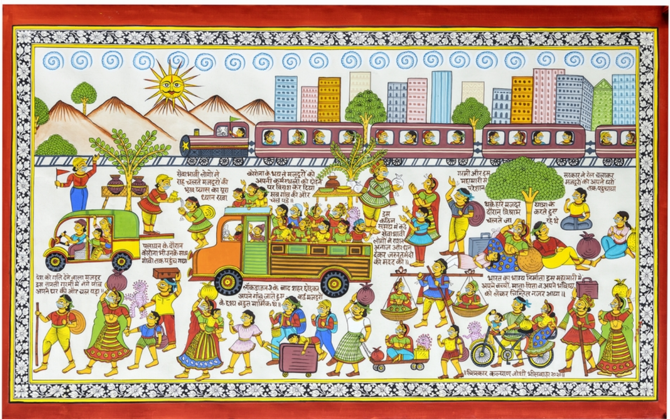
Kalyan Joshi (Inde), Migration in the Time of COVID (Migration en temps de Covid), 2020.

que les deux forces politiques qui ont rompu avec l'ANC - l'uMkhonto we Sizwe (MK) de Jacob Zuma et les Combattants pour la liberté économique de Julius Malema - ont remporté ensemble 64,28 % des voix, dépassant ainsi les suffrages obtenus par l'alliance au pouvoir en 1994. Le programme global promis par ces trois forces reste intact (mettre fin à la pauvreté, exproprier les terres, nationaliser les banques et les mines, et étendre la protection sociale), bien que les stratégies qu'elles souhaiteraient suivre soient extrêmement différentes, un fossé creusé par leurs rivalités personnelles. En définitive, un gouvernement de large coalition sera formé en Afrique du Sud, mais il n'est pas certain qu'il soit en mesure de définir ne serait-ce qu'une politique social-démocrate, comme au Mexique. Le déclin général de la confiance de la population dans le système représente un manque de foi dans tout projet politique. Les promesses, si elles ne sont pas tenues, peuvent devenir caduques.