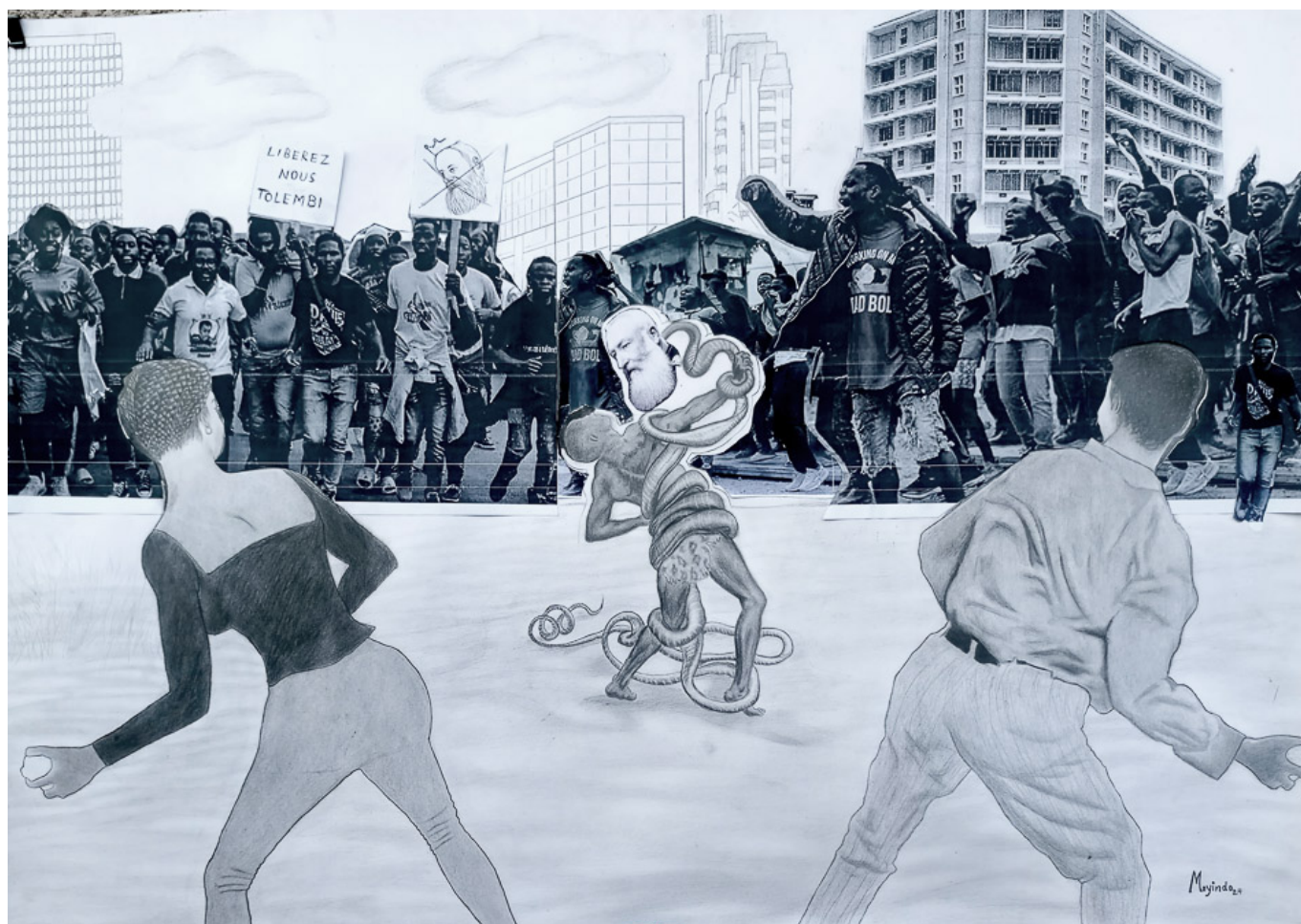
Jardy Ndombasi (RDC), Soulèvement populaire et souveraineté , 2024.