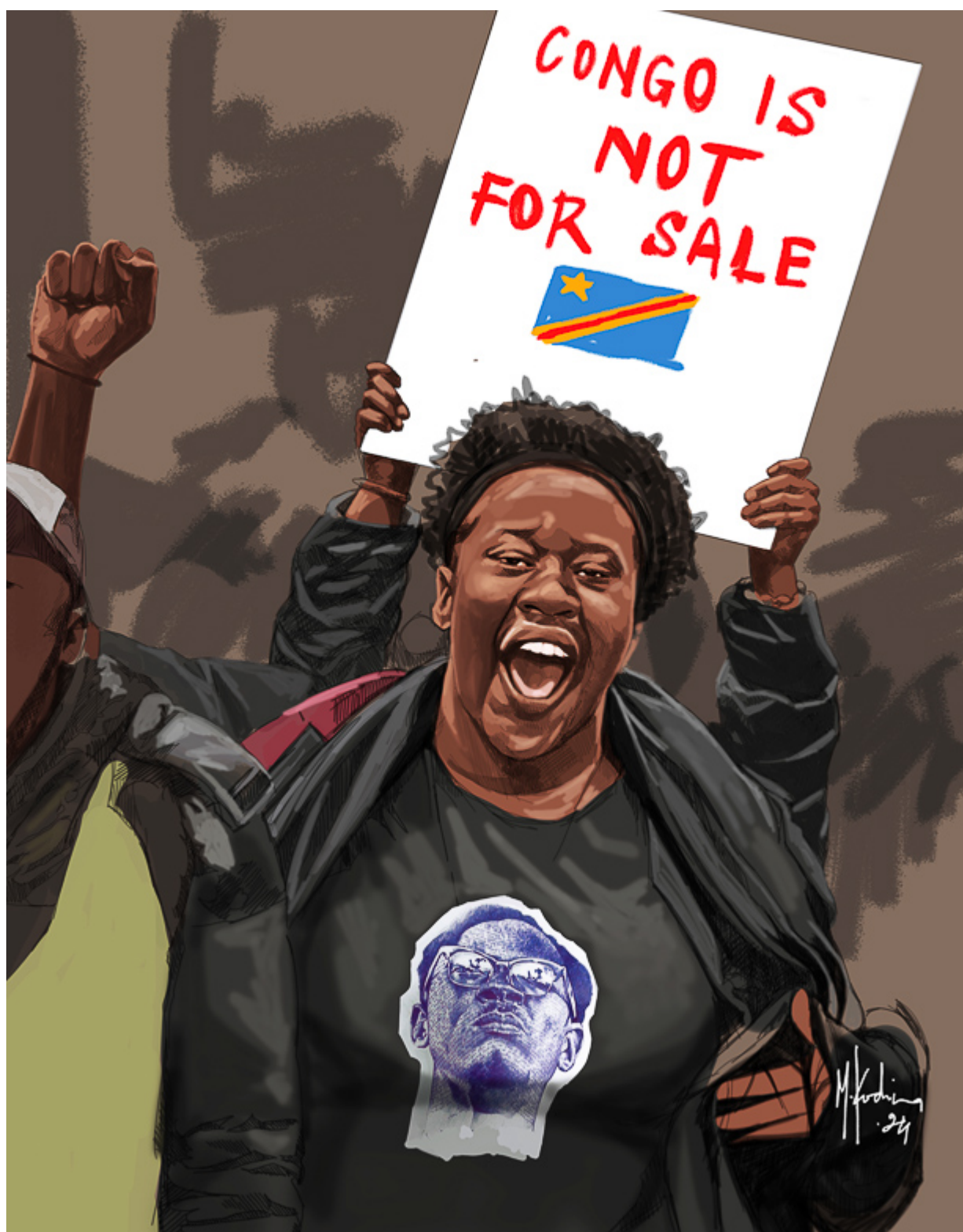
M Kadima (RDC), Le Congo n'est pas à vendre , 2024. Photographie de référence de John Behets.

Sur plusieurs fronts, la région des Grands Lacs d'Afrique a été empêchée de résoudre les problèmes qui l'affligent : les structures néocoloniales bien ancrées ont entravé l'établissement d'infrastructures sociales convenablement financées ; le pouvoir extraordinaire des sociétés minières, qui, jusqu'à récemment, étaient