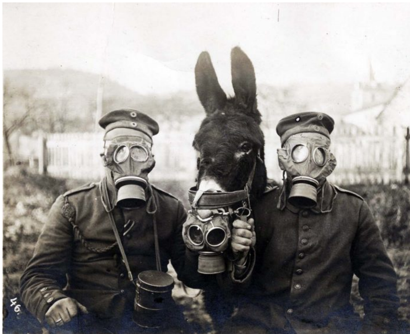
Les soldats allemands, leur mule et les gaz lacrymogènes (1916).

À la fin de l'année dernière, le Réseau européen sur la dette et le développement (Eurodad) a publié une importante étude sur les conditions des prêts du FMI et leur impact sur les soins de santé. L'auteur – Gino Brunswijck – a examiné les prêts du FMI à vingt-six pays entre 2016 et 2017. Dans vingt de ces vingt-six pays, » les gens sont allés en grève ou sont descendus dans la rue pour protester contre les compressions budgétaires, la hausse du coût de la vie, la restructuration fiscale et les réformes de la masse salariale imposées par les conditions du FMI « . Depuis la parution de l'étude, les habitants de l'Argentine, de la République tchèque, de l'Équateur, de l'Égypte, d'Haïti, de la Jordanie, du Maroc, du Pakistan, du Soudan, de la Tunisie et d'autres pays sont descendus dans les rues. Pour eux, il n'y a pas d'alternative : soit ils protestent, soit ils meurent de faim.