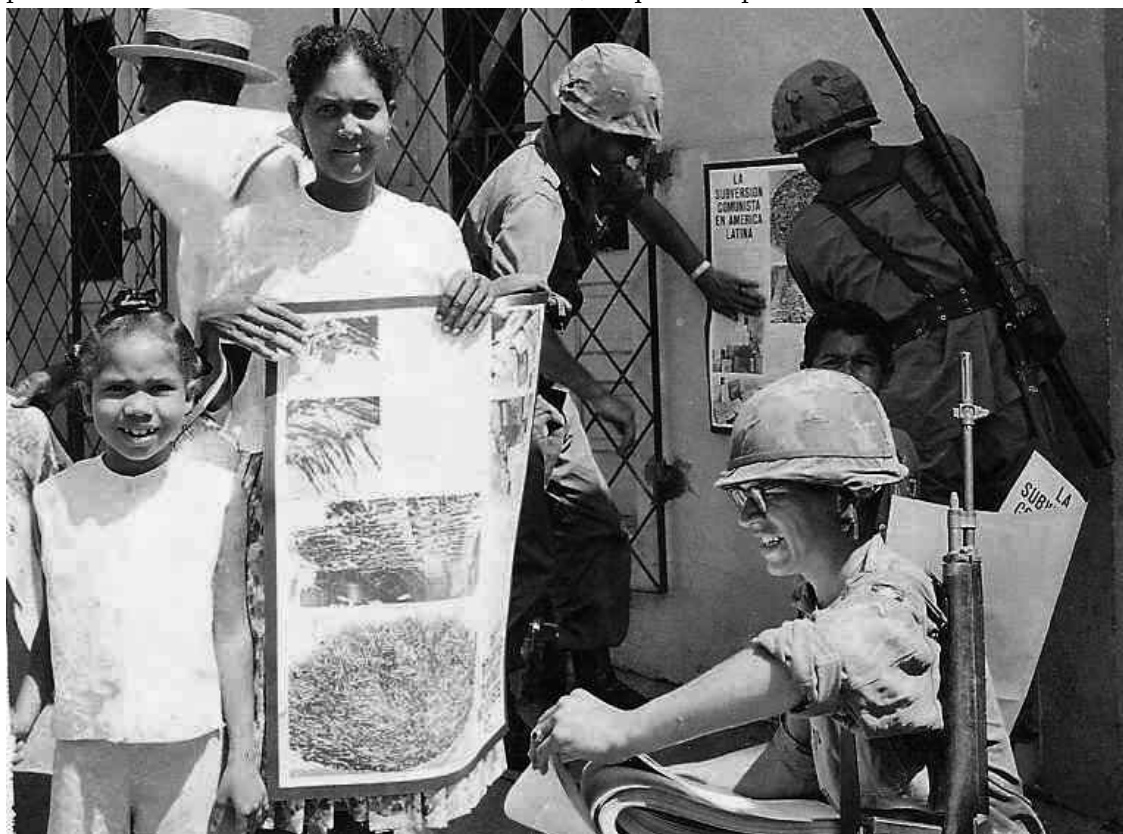
Les premiers bataillons de la guerre psychologique américaine distribuent des posters anti-communistes à Saint-Domingue (République dominicaine), 1965.

Elles sont utiles, mais insuffisantes. Il faut faire davantage. C'est clair, c'est clair. Par l'intermédiaire de CLAP, le gouvernement vénézuélien distribue environ 50 000 tonnes de nourriture par mois. L' »aide humanitaire « promise par les Etats-Unis s'élève à 20 millions de dollars, ce qui correspond à l'achat de 60 tonnes de nourriture.