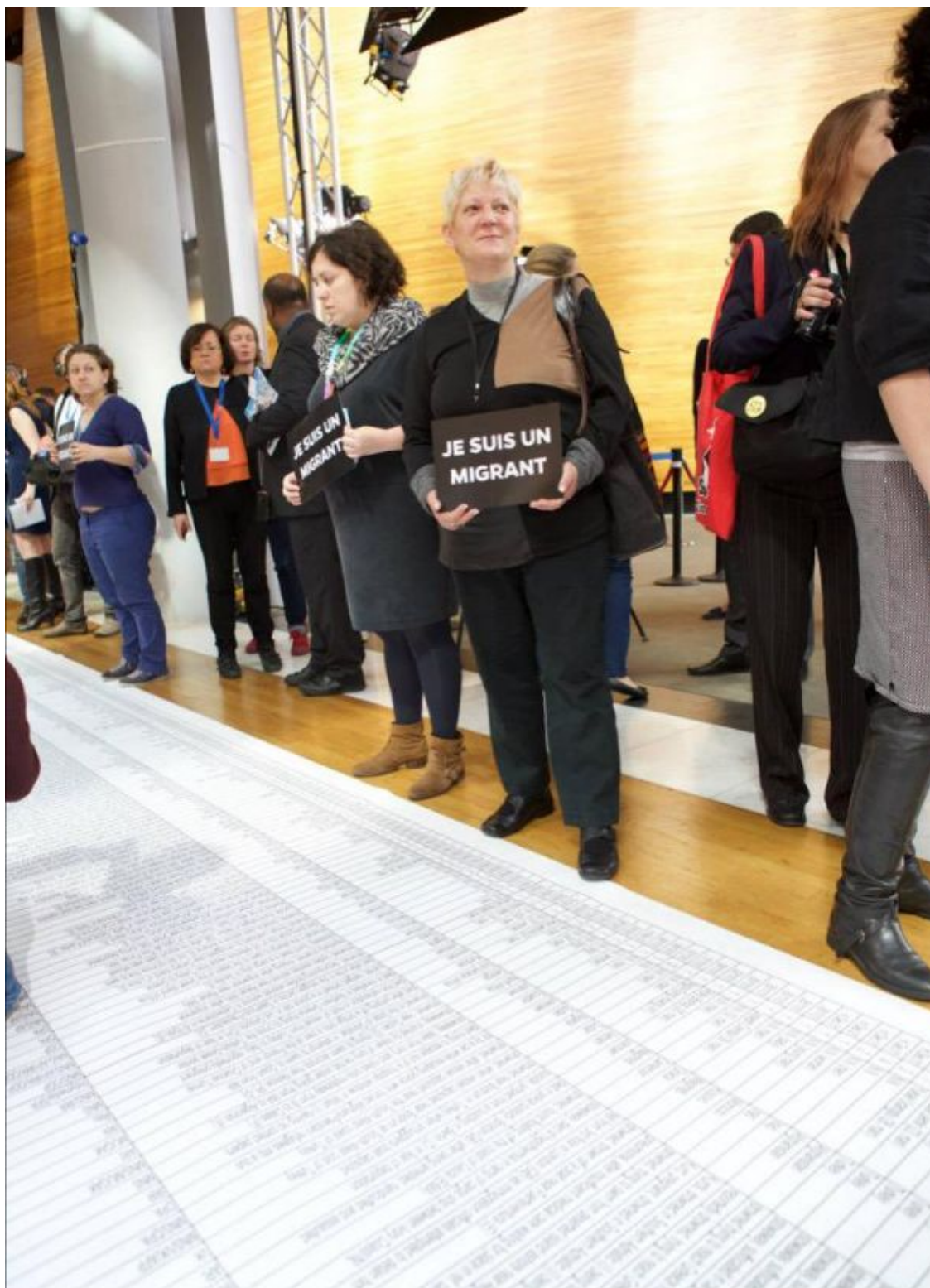
Parlement européen, Strasbourg, 2015.

L'éradication de la faim doit être la politique de base de tout gouvernement. Selon l'Organisation des Nations Unies pour l'alimentation et l'agriculture, 11,7% de la population vénézuélienne a faim. Les taux de faim dans d'autres parties du monde sont beaucoup plus élevés – 31,4% en Afrique de l'Est. Mais l'attention du monde n'a pas été focalisée sur cette grave crise, qui a en partie généré la migration massive à travers la mer Méditerranée. L'image ci-dessus provient du Parlement européen à Strasbourg, où des militants ont présenté les 17 306 noms des personnes qui ont trouvé la mort en tentant de traverser cette frontière. Les membres du Parlement européen ont dû se rendre à leur session en marchant sur ces noms. Ils sont durs dans leur attitude pour déclencher une guerre contre le Venezuela, mais cavaliers au sujet des crises graves en Afrique et en Asie qui maintiennent le flux des migrants.