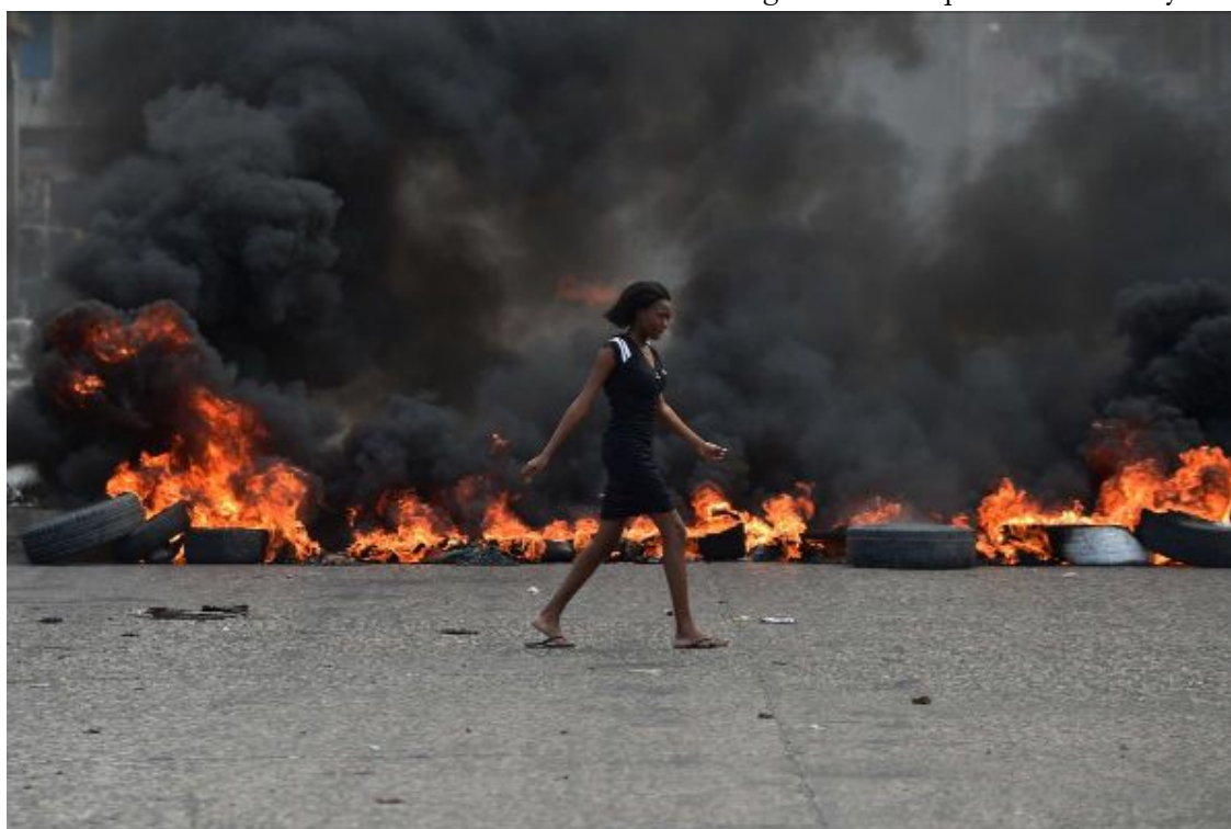
Si vous ne nous laissez pas respirer, nous vous empêcherons de le faire aussi. Port-au-Prince, Haiti, 2019.

Les États-Unis ont utilisé des avions militaires pour apporter cette modeste aide, l'ont conduite à un entrepôt et ont ensuite déclaré que les Vénézuéliens n'étaient pas prêts à ouvrir un pont inutilisé pour elle. Tout le processus est du théâtre politique. Le sénateur américain Marco Rubio s'est rendu sur ce pont – qui n'a jamais été ouvert – pour dire d'une manière menaçante que l'aide « va passer » au Venezuela d'une manière ou d'une autre. Ce sont des mots qui menacent la souveraineté du Venezuela et renforcent l'énergie d'une attaque militaire. Il n'y a rien d'humanitaire ici.