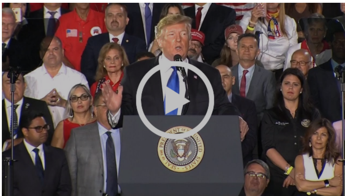
Democracy Now, février 19, 2019

Les États-Unis ont utilisé des avions militaires pour apporter cette modeste aide, l'ont conduite à un entrepôt et ont ensuite déclaré que les Vénézuéliens n'étaient pas prêts à ouvrir un pont inutilisé pour elle. Tout le processus est du théâtre politique. Le sénateur américain Marco Rubio s'est rendu sur ce pont – qui n'a jamais été ouvert – pour dire d'une manière menaçante que l'aide « va passer » au Venezuela d'une manière ou d'une autre. Ce sont des mots qui menacent la souveraineté du Venezuela et renforcent l'énergie d'une attaque militaire. Il n'y a rien d'humanitaire ici.