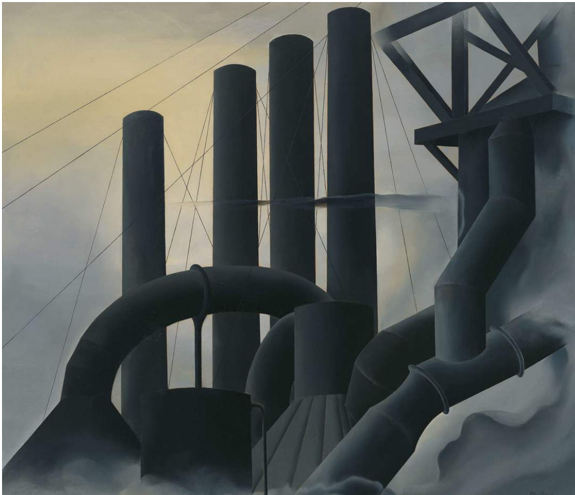
Elise Driggs, Pittsburg , 1927

Cette obscénité s'accroît lorsqu'on considère l'approche actuelle de l'ordre mondial face à la pauvreté. La Banque mondiale définit les termes de la lutte contre la pauvreté. Il propose les trois solutions suivantes : promouvoir la propriété privée, utiliser l'argent du gouvernement pour construire de grandes infrastructures et promouvoir des taux de croissance élevés.