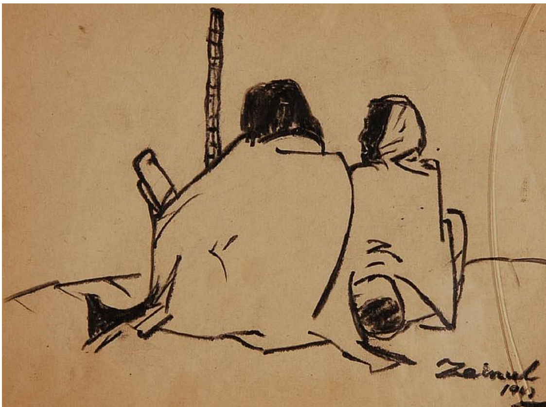
Zainul Abedin, Esquisses de famine , 1943

Les révolutions ne sont pas la course en train, mais la course humaine qui s'empare du frein d'urgence : Vingt-neuvième lettre d'information (2019).