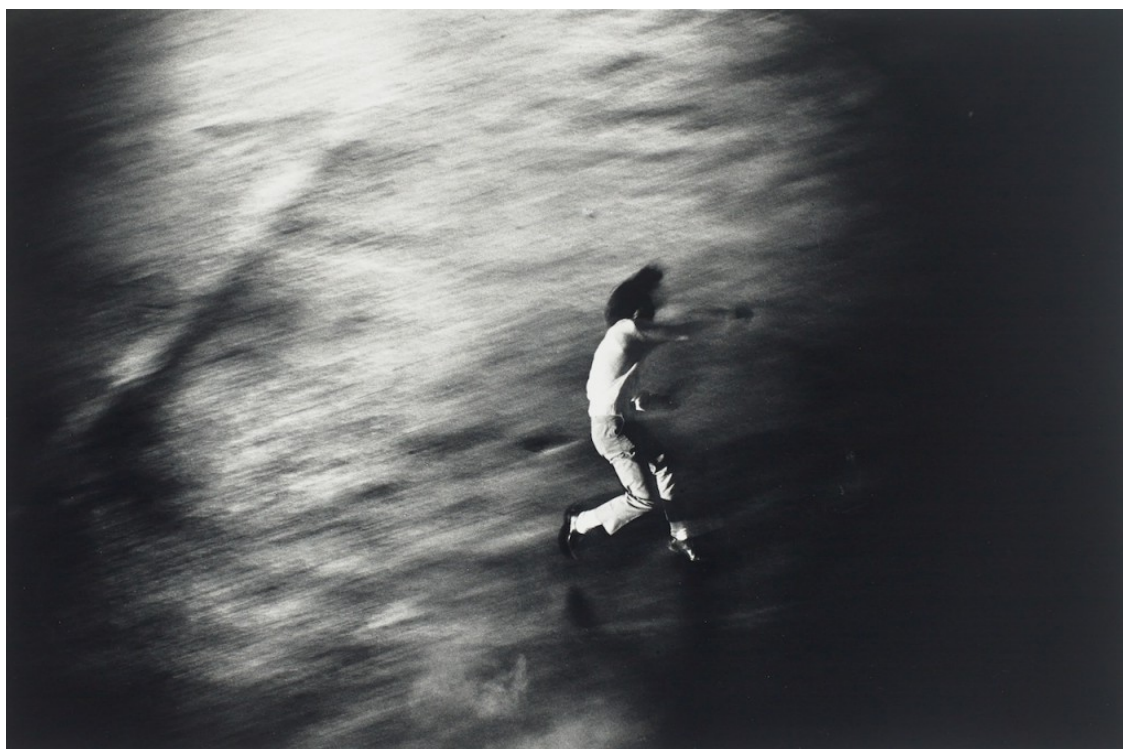
Shomei Tomatsu, Protest 1, Oh! Shinjuku, 1969.

Prenez deux appareils électroménagers : le poêle sans fumée et le congélateur. Le poêle sans fumée est essentiel au développement social – une solution tangible et réalisable aux maladies causées par les poêles à fumée qui ont un impact disproportionné sur les femmes qui en dépendent pour nourrir leur famille. Des milliers de laboratoires universitaires ont créé pour ces poêles. Et pourtant, ils sont absents dans de nombreux foyers, du Népal rural au Mexique urbain. Pourquoi ? Eh bien, les gens qui en ont besoin n'ont pas le pouvoir d'achat pour les acheter.