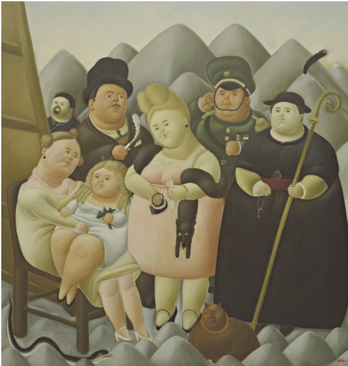
Ferdando Botero, La famille présidentielle , 1967

Mais quelles politiques? Au cours des dernières décennies, les pressions exercées par des institutions telles que le Fonds monétaire international et la Banque mondiale, ainsi que par les banques commerciales, ont réduit les possibilités d'intervention de l'État contre la pauvreté. La théorie générale est d'espérer que la pauvreté puisse être éradiquée par la philanthropie et la charité. Tous les regards se tournent vers les milliardaires, espérant qu'ils feront don de leurs richesses pour éliminer les déséquilibres dans le monde. Mais ces dons sont maigres, leur impact sans conséquence.