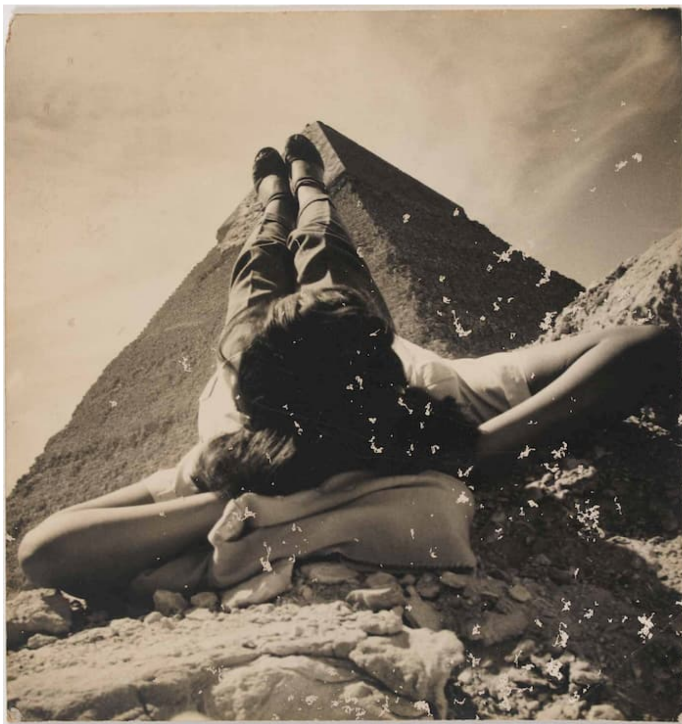
Abduh Khalil (Égypte), Sans-titre , 1949.

Le coronavirus s’est maintenant infiltré en Palestine ; le plus alarmant est qu’il y a au moins un cas à Gaza, qui est l’une des plus grandes prisons à ciel ouvert du monde. Le poète communiste palestinien Samih al-Qasim (1939-2014) appelait sa patrie la « grande prison », de l’isolement de laquelle il offrait sa poésie lumineuse. L’un de ses poèmes, « Confession à midi », propose un bref voyage dans les dégâts émotionnels causés au monde par l’austérité et le néolibéralisme :