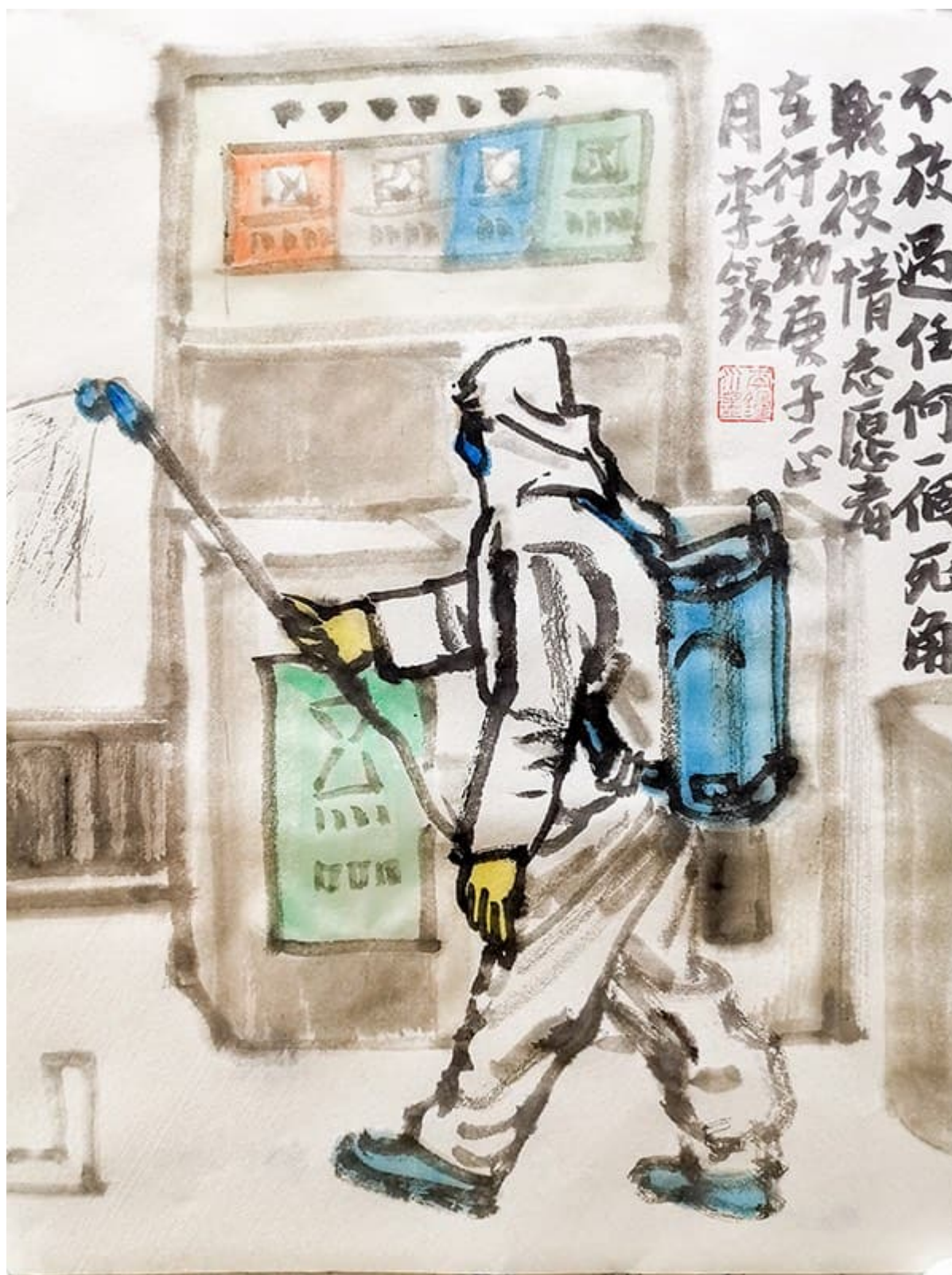
Li Zhong (Chine), Des peintures pour Wuhan , 2020.