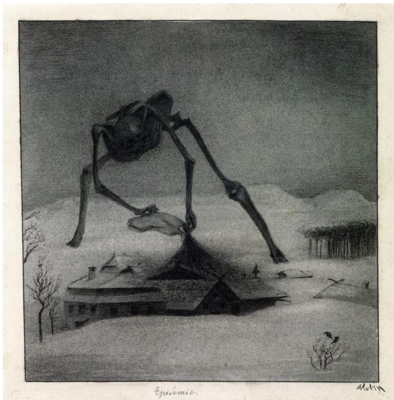
Alfred Kubin (Autriche), Épidémie , 1900-1901 (Stadtische Galerie im Lenbachhaus Munich).