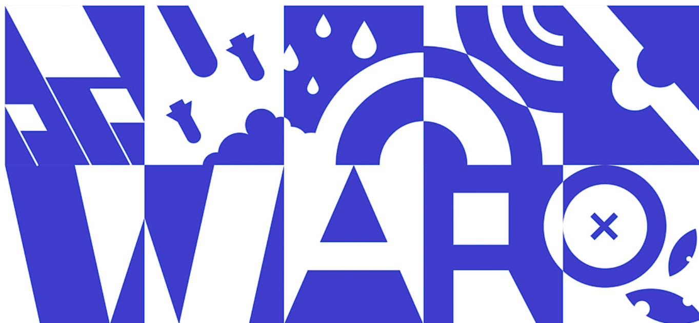
Xiang Wang (Chine), Extinction , 2020

La newsletter de cette nouvelle année a été rédigée en collaboration avec notre ami, grand linguiste et voix prophétique, Noam Chomsky. Elle prend la forme d'une déclaration de Noam et moi-même.