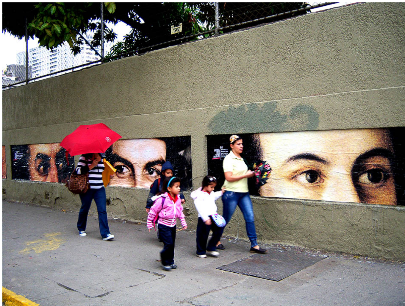
Comando Creativo. History is watching us , Bellas Artes, Caracas, 2011.