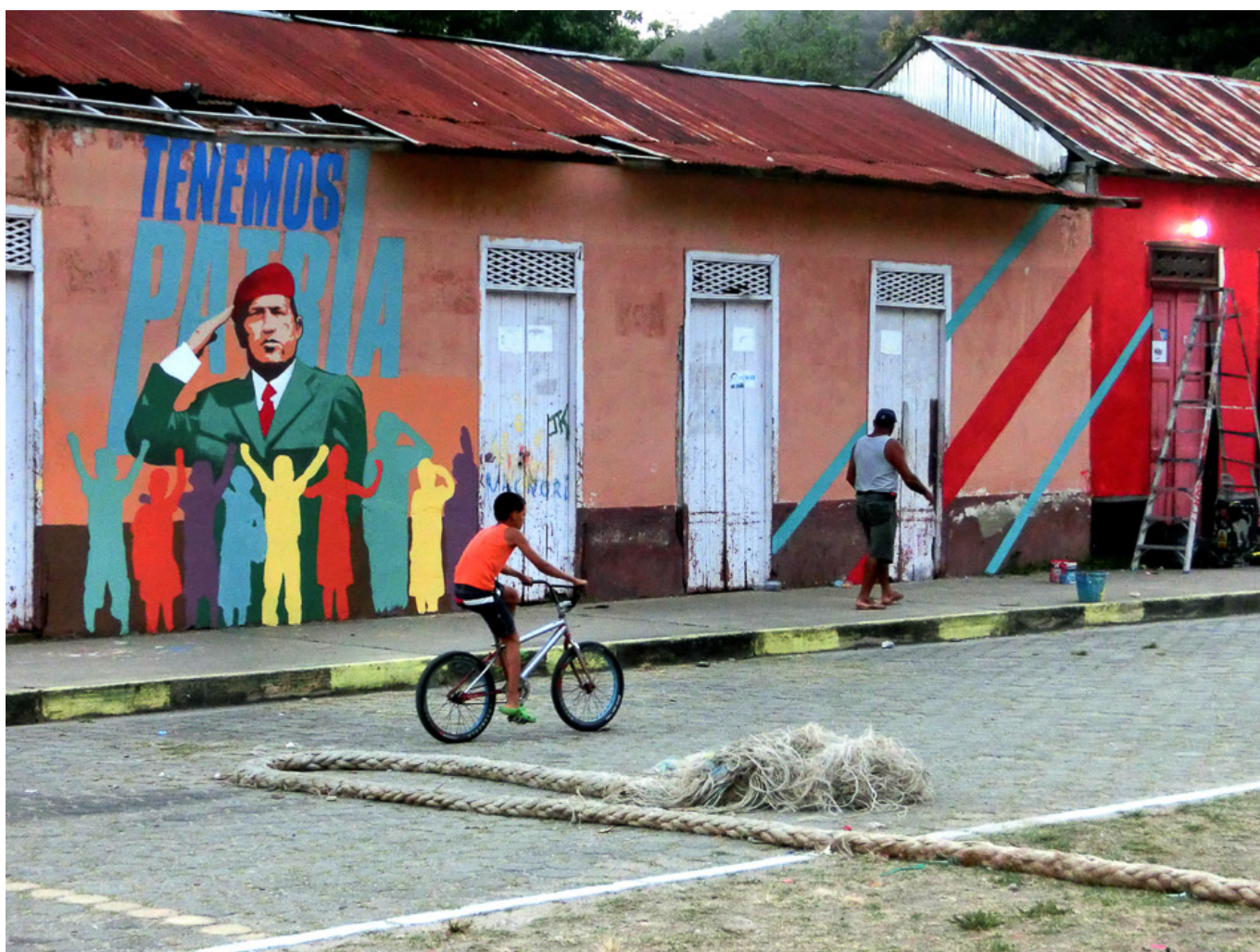
Comando Creativo. Tenemos patria [Temos Pátria] . Macuro, Sucre. 2014

En 2002, les États-Unis – avec des fonds fournis par le National Endowment for Democracy et USAID – ont tenté un coup d’État contre Chávez. Ce coup d’État a définitivement échoué, mais il n’a pas mis fin aux manigances. En 2004, l’ambassadeur américain William Brownfield a publié un plan de l’Ambassade, en cinq points : « la stratégie », écrit-il, « consiste à 1) renforcer les institutions démocratiques [c’est-à-dire oligarchiques] ; 2) pénétrer [c’est-à-dire désorienter et acheter] la base politique de Chávez ; 3) diviser le chavisme ; 4) protéger les entreprises américaines vitales, et 5) isoler Chávez au niveau international ».