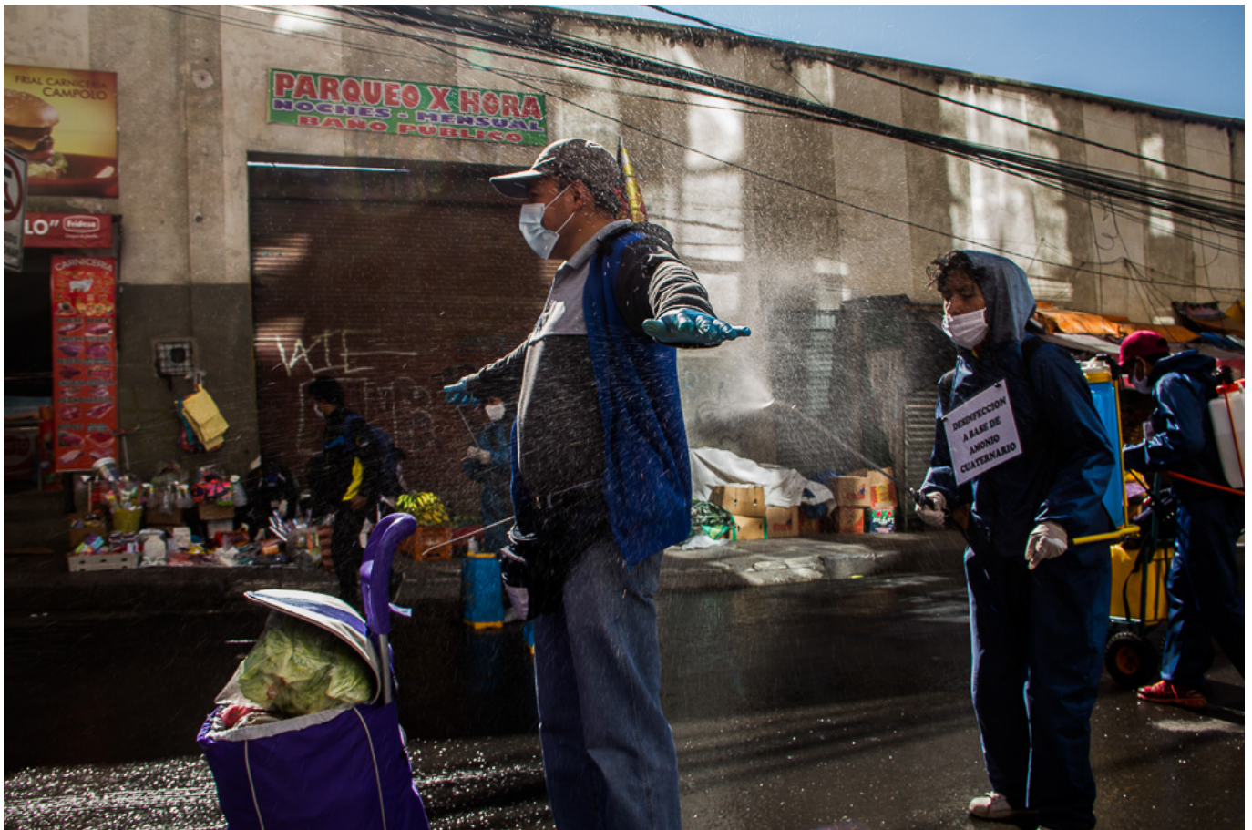
Carlos Fiengo (Bolivie), Shoppers at the market pay to be disinfected / Les acheteurs au marché paient pour être désinfectés. Marché Rodríguez, La Paz (Bolivie), 2020.

Deux milliards de travailleurs sont employés dans l'économie informelle (six travailleurs sur dix) ; parmi eux, le rapport de l'OIT note que 1,6 milliard « sont confrontés à une menace imminente pour leurs moyens de subsistance, car le revenu moyen dans l'économie informelle a diminué de 60 % au cours du premier mois de la pandémie ». Cela a entraîné une augmentation spectaculaire de la pauvreté, et l'avertissement du Programme alimentaire mondial en avril que la prochaine pandémie pourrait être une « pandémie de faim », un sujet que nous avons abordé dans notre vingtième newsletter de cette année.