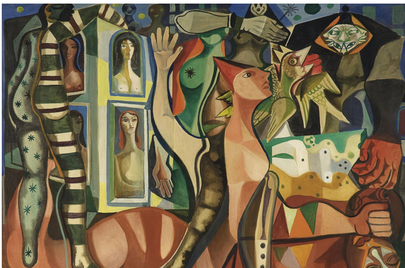
Emiliano di Cavalcanti (Brésil), Sonhos do carnaval / Rêves de Carnaval , 1955.

en utilisant de manière malveillante des lois parfaitement adéquates contre la corruption pour cibler les dirigeants de la gauche. Il s'agit d'une stratégie appelée « lawfare », dans laquelle la loi est utilisée – souvent sans preuves – pour évincer des dirigeants de gauche démocratiquement élus ou pour les empêcher de se présenter aux élections. La lawfare a été mise à profit pour destituer le président hondurien José Manuel Zelaya en 2009, le président paraguayen Fernando Lugo en 2012 et la présidente brésilienne Dilma Rousseff en 2016 ; ces dirigeants ont, en définitive, tous été victimes d'un coup d'État judiciaire. L'ancien président brésilien, Luiz Inácio Lula da Silva, s'est vu refuser le droit de se présenter à la présidence en 2018 après un procès sans aucun fondement, alors que tous les sondages annonçaient sa victoire. L'ancienne présidente de la République argentine, Cristina Fernández de Kirchner, a été poursuivie, depuis 2016, dans une série d'affaires qui l'ont empêchée de se représenter en 2019 (elle est maintenant vice-présidente, ce qui témoigne de sa popularité dans le pays).