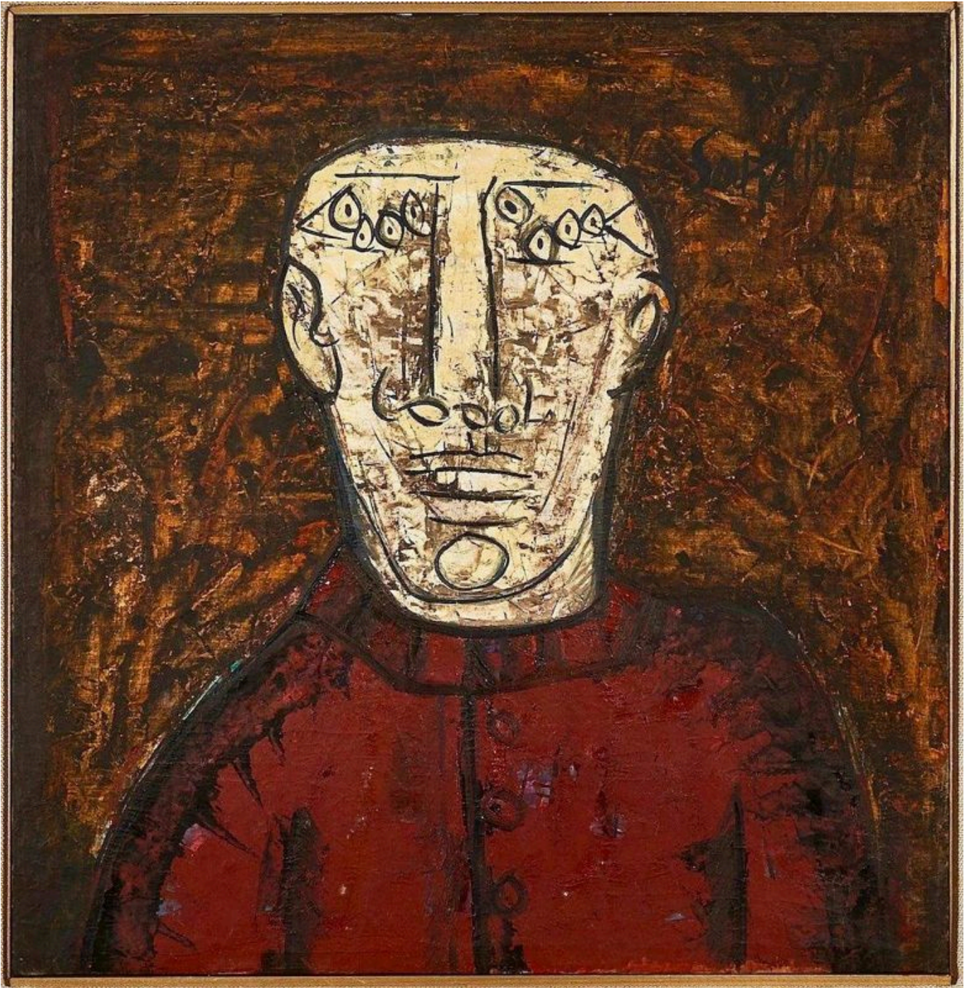
फ्रांसिस न्यूटन सूजा (भारत), द फोरमैन, 1961.

दुनिया भर में जन आंदोलन श्रमिकों और किसानों की शिकायतों और आशाओं से निकलते हैं, ऐसे लोग जो थोड़ी-सी संपत्ति के लिए पूँजी जमा करने के लिए शोषित होते हैं और सामाजिक पदानुक्रम द्वारा उत्पीड़ित होते हैं। यदि पर्याप्त लोग भूख या निरक्षरता की कठोर वास्तविकताओं के सामने समर्पण करने से इनकार करते हैं, तो उनके कार्य विद्रोह में बदल सकते हैं, या क्रांति में भी बदल सकते हैं। समर्पण करने से इंकार करने के लिए आत्मविश्वास और स्पष्टता की आवश्यकता होती है।