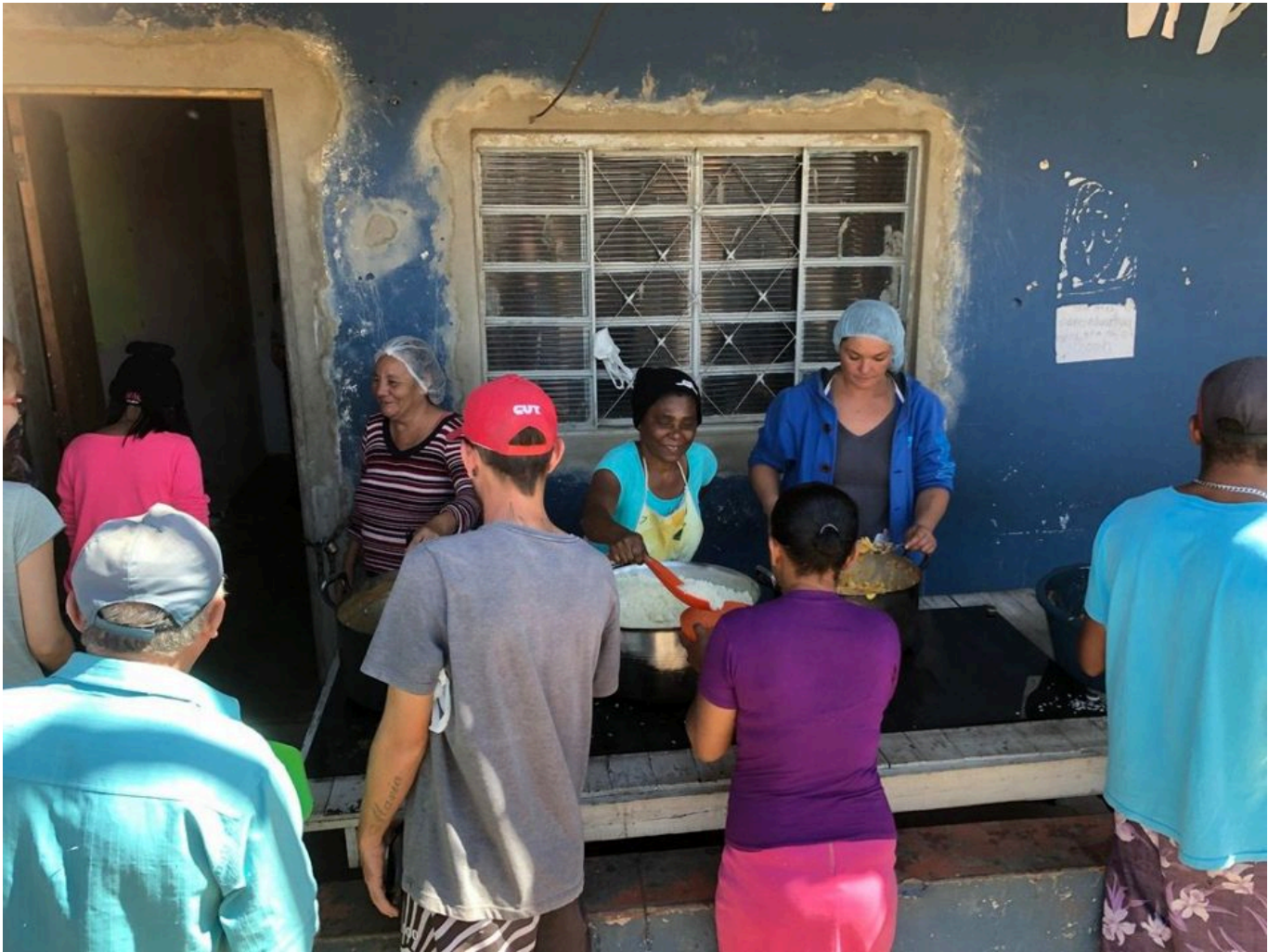
कैम्प मारिएले विवे की सामुदायिक रसोई, 2019

कैम्प मारिएल विवे अन्य 'झुग्गियों' से अलग है। झुग्गी शब्द से कई नकारात्मक अर्थ जुड़े हैं। झुग्गियों में अक्सर निराशा फैली होती है, और आपराधिक गिरोह या धार्मिक संगठन उनके लिए 'उम्मीद' की किरण होते हैं। लेकिन कैम्प मारिएल विवे का माहौल अलग है। भूमिहीन श्रमिक आंदोलन (एमएसटी) के झंडे हर जगह दिखाई देते हैं। कैम्प के निवासी मिलनसार हैं, उनमें से कई लोगों ने अपने संगठन का टी-शर्ट या कैप पहन रखा था। पूरा माहौल तैयारी का लगता है : स्थानीय अधिकारियों द्वारा झुग्गियाँ हटाने की कार्रवाइयों में अपने कैम्प को बचाने की तैयारी और अपने लिए एक ढंग का समुदाय बनाने की तैयारी।