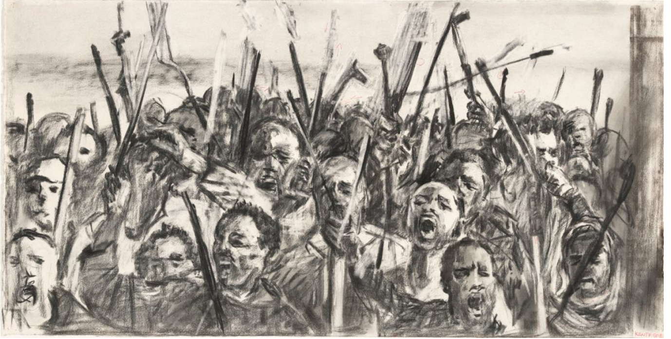
फिल्म अदर फेसेज पर आधारित चित्र, विलियम केंटरिज (दक्षिण अफ्रीका), 2011.

1982 में दक्षिण अफ्रीकी स्वतंत्रता सेनानी और कवि मोंगने वॉली सेरोते (जन्म 1944) ने अपनी शानदार किताब द नाइट कीपर्स विंकिंग में 'टाइम हैज़ रन आउट' [समय खत्म हो चला] शीर्षक कविता संकलित की। वह बोत्सवाना में रहते थे और मेदु कला समूह से जुड़े थे। (जिसके बारे में हमने पिछले साल एक डोसियर लिखा था) उन्होंने लिखा 'हममें से कई लोग पागल हो चुके हैं' क्योंकि 'हम इंसान हैं और ये हमारी ज़मीन है'। सेरोते दक्षिण अफ्रीका के बारे में लिख रहे थे लेकिन हम उनके विचार का विस्तार अब फिलिस्तीन तक कर रहे हैं और शायद पूरी दुनिया तक ही। सेरोते ने लिखा :