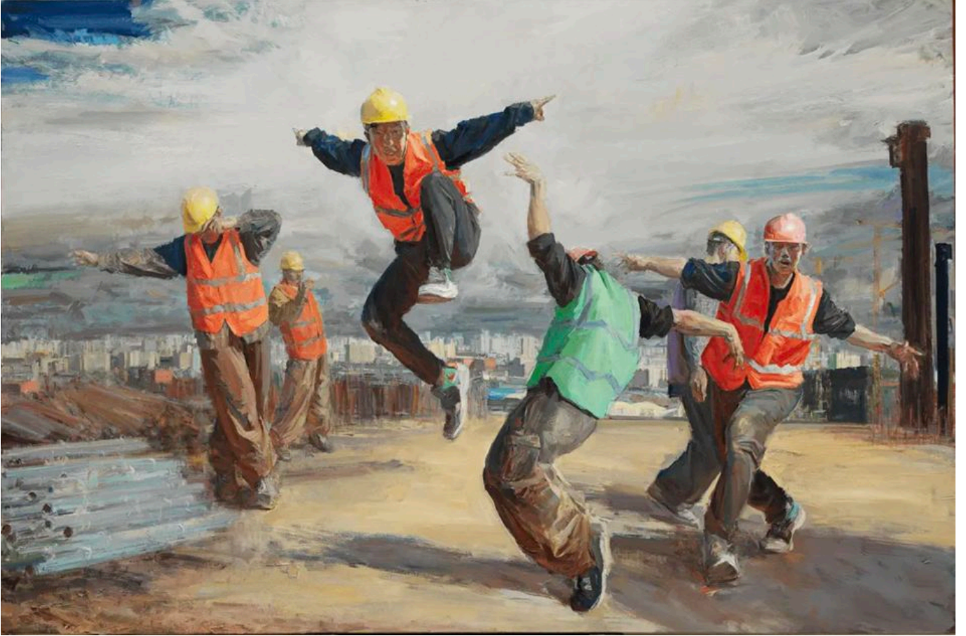
लियू होंगजी (चीन), क्षितिज, 2021