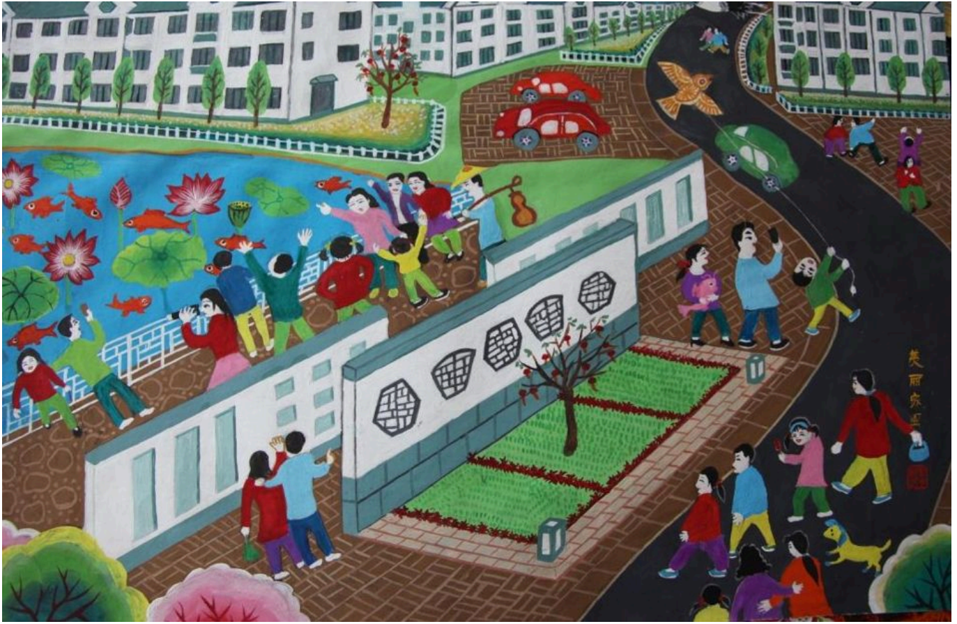
शेयांग फार्मर्स पेंटिंग इंस्टीट्यूट (जियांगसू, चीन), 'किसान पेंटिंग' परियोजना, 2017 से एक पेंटिंग

1990 के दशक के अंत तक चीन की कम्युनिस्ट पार्टी (सीपीसी) की पत्रिकाओं सहित कई मंचों पर जन-कार्रवाइयों के ज़रिए बढ़ती असमानता व गरीबी से निपटने के विषय पर चर्चा शुरू हो चुकी थी। अक्टूबर 2005 में 16वीं सीपीसी कांग्रेस की पांचवीं बैठक में, पार्टी ने कृषि, किसानों और ग्रामीण क्षेत्रों के संदर्भ में वाक्यांश 'तीन ग्रामीण' का उपयोग करते हुए 'समाजवादी ग्रामीण क्षेत्र का निर्माण' करने हेतु एक 'महान ऐतिहासिक मिशन' की घोषणा की। इस मिशन का मकसद था राज्य के निवेश के ज़रिए ग्रामीण क्षेत्रों के बुनियादी ढांचे में सुधार लाना, मुफ्त और अनिवार्य शिक्षा प्रदान करना तथा चिकित्सा क्षेत्र में बाज़ारोन्मुख सुधारों से पीछे हटते हुए सहकारी चिकित्सा सेवाओं को विकसित करना। सहकारी चिकित्सा सेवा 2009 से पूरे चीन में एक राष्ट्रव्यापी नीति बन गई थी। मुझे यह अच्छा लगा कि यह अभियान नौकरशाही के तंत्र की बजाय एक जन-कार्रवाई के रूप में चलाया गया था, जिसमें हजारों सीपीसी कैडर शामिल हुए। इस अभियान के एक दशक बाद गरीबी उन्मूलन अभियान शुरू हुआ था।