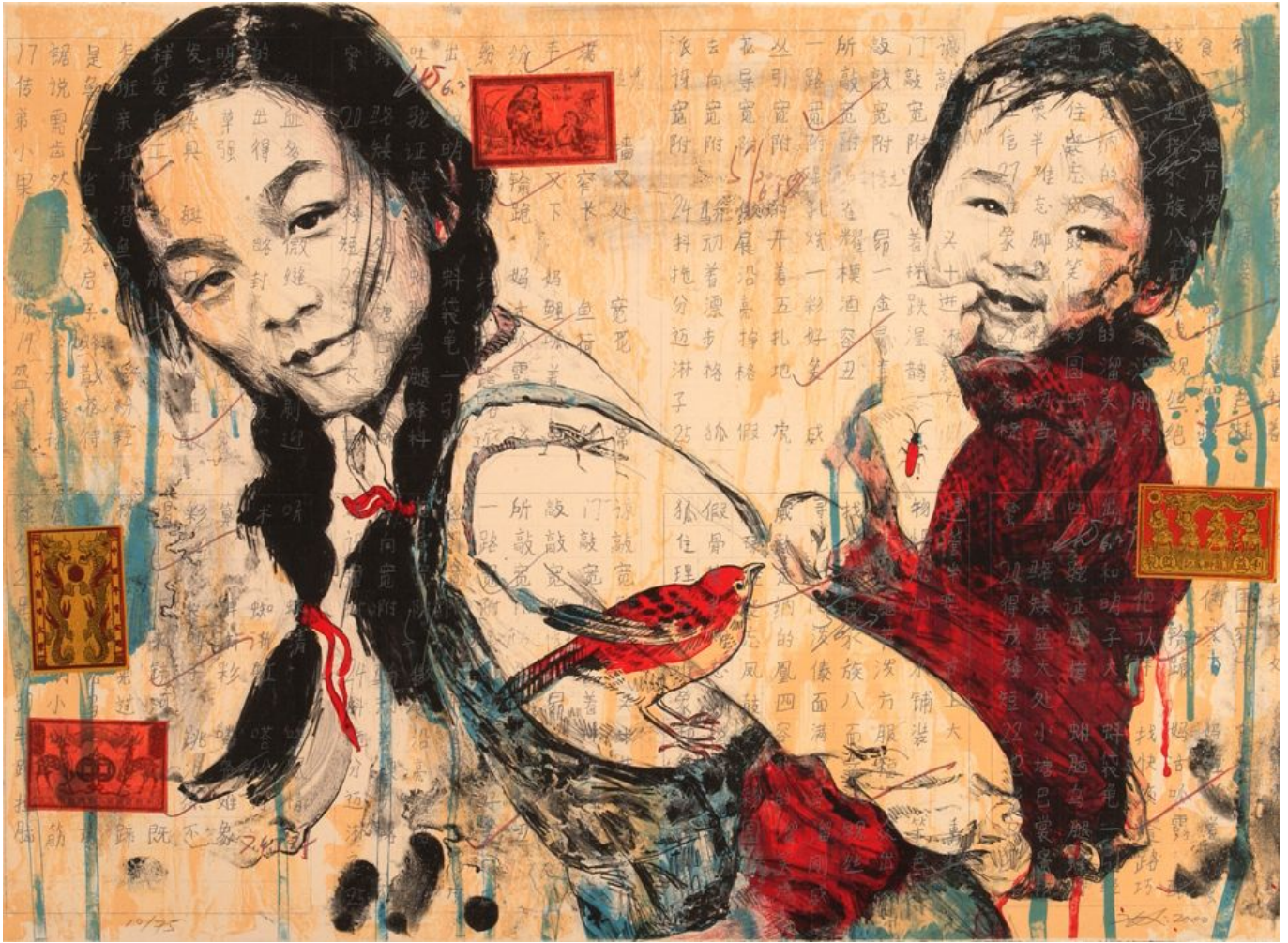
हंग लियो (चीन), सिस्टर्स, 2000

साल 2022 तक डी-डॉलराइजेशन बहुत धीमी रफ्तार से हो रहा था, लेकिन फिर ग्लोबल नॉर्थ के राष्ट्रों ने डॉलर-वॉल स्ट्रीट के वित्तीय तंत्र में जमा रूस की परिसंपत्तियों को ज़ब्त करना शुरू कर दिया और इससे दुनिया के कई देश उत्तरी अमेरिका और यूरोपीय बैंकों में पड़ी अपनी परिसंपत्तियों की सुरक्षा को लेकर घबरने लगे। हालांकि ये ज़ब्ती कोई नई बात नहीं थी (उदाहरण के लिए संयुक्त राज्य अमेरिका ने ऐसा ही क्यूबा और अफ़गानिस्तान के साथ भी किया था), लेकिन इस बार जिस स्तर और सख्ती से यह सब किया गया वो नोगीरा के शब्दों में 'विश्वास टूटने' का एक कारण बन गया।