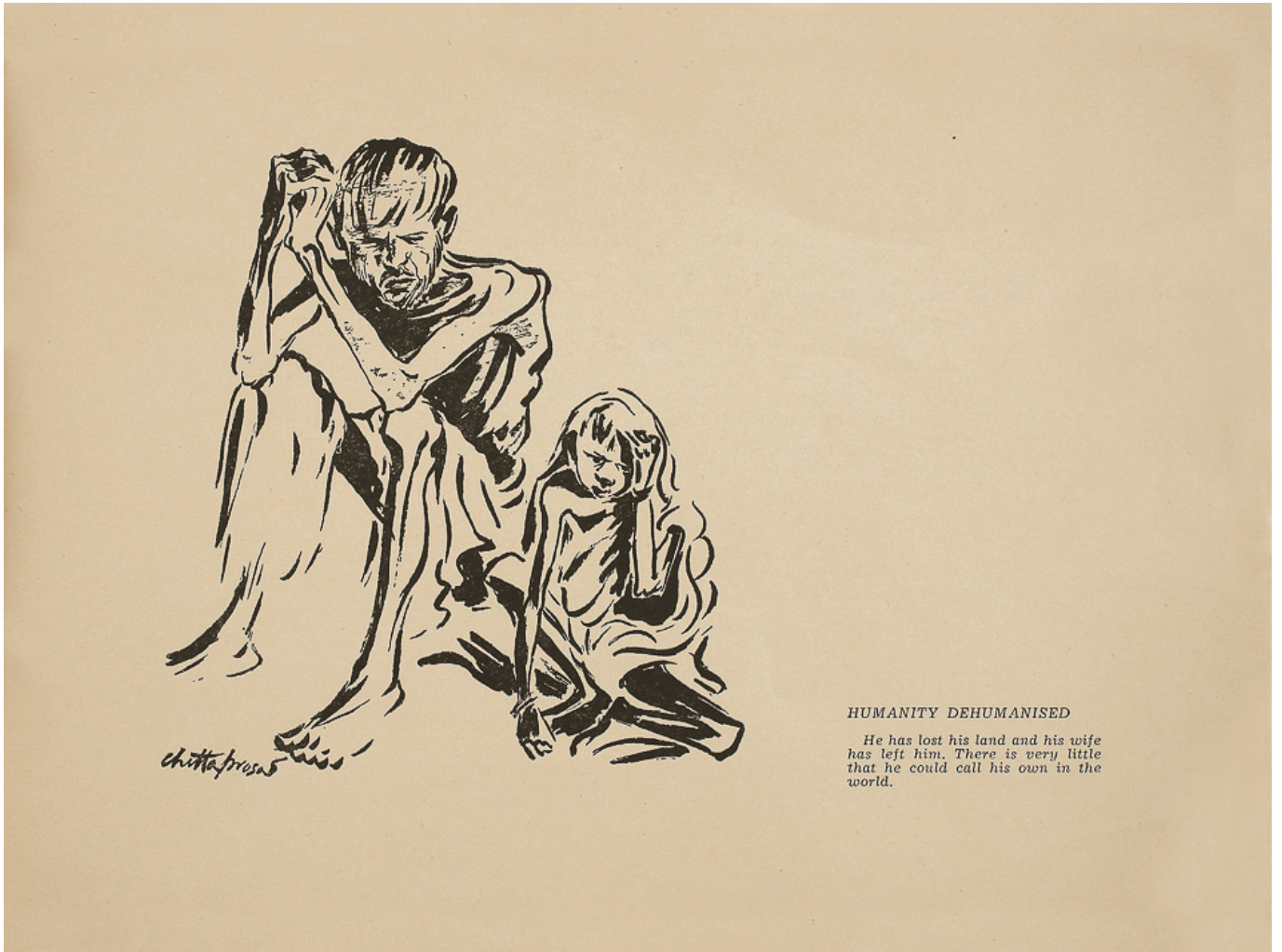
चित्तप्रसाद, भूखा बंगाल, 1945।

कल्याणकारी रवैया दुख को एक बार के लिए हल्का तो कर सकता है, पर इससे अधिक कुछ नहीं कर सकता। भारत के नये कम्युनिस्टों को ये बात समझ में आ गई थी कि अंग्रेजों की हुकूमत हटाकर भारतीय पूँजीपतियों को देश पर शासन करने की अनुमति देना पर्याप्त नहीं होगा ; क्योंकि उनके द्वारा किया गया दान पीढ़ी-दर-पीढ़ी बनी रहने वाली गरीबी को नहीं रोक पाएगा। निजी संपत्ति की व्यवस्था को उखाड़ फेंकने के लिए और समाजवादी सिद्धांतों पर आधारित उत्पादन प्रणाली विकसित करने के लिए उत्पादक वर्गों को संगठित करने की आवश्यकता थी। यही वो ज़रूरत है जिससे भारतीय कम्युनिस्ट -जिनकी कहानियाँ हमारे डोज़ियर में शामिल हैं- और दुनिया भर के वामपंथी प्रेरित होते रहे हैं।