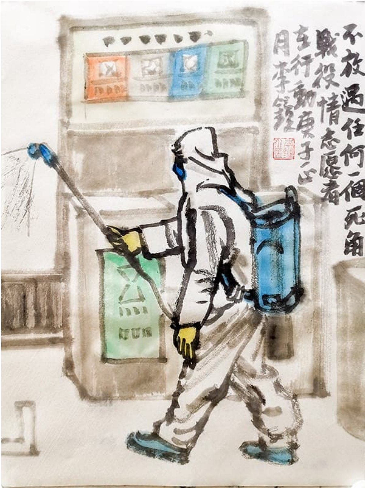
ली झोंग (चीन), वुहान के लिए चित्र, 2020.