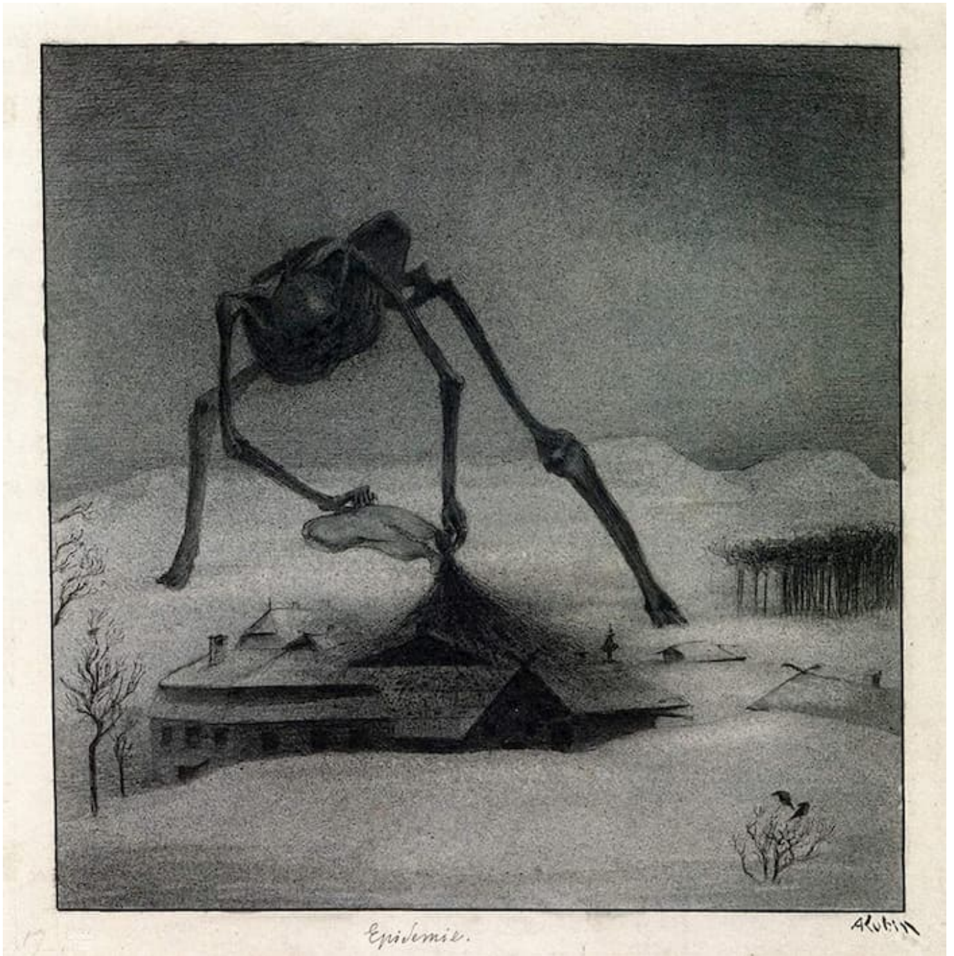
अल्फ्रेड कुबिन (ऑस्ट्रिया), महामारी, 1900-1901