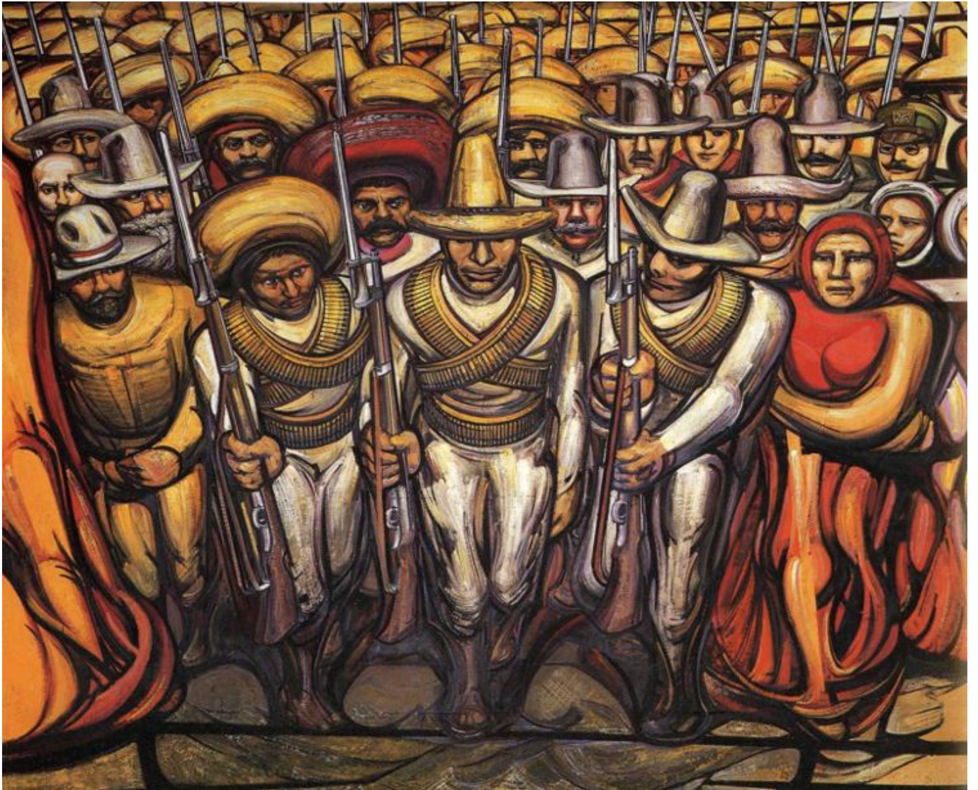
डेविड अल्फारो सिकीरोस, पोर्फिरिओ-शासन से क्रांति तक (1957-1966)

21 फरवरी को, दुनिया भर में हजारों लोग सार्वजनिक जगहों पर रेड बुक्स डे मनाने के लिए इकट्ठा होंगे। इस दिन को मनाने के तीन कारक हैं: