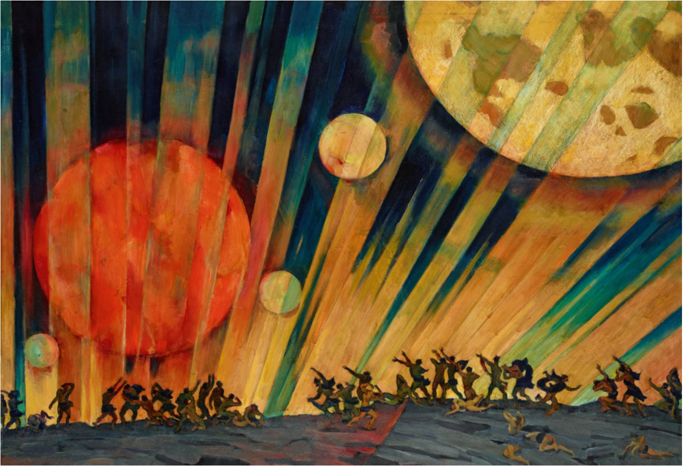
कोंस्टेंटिन यूओन, नया ग्रह, 1921