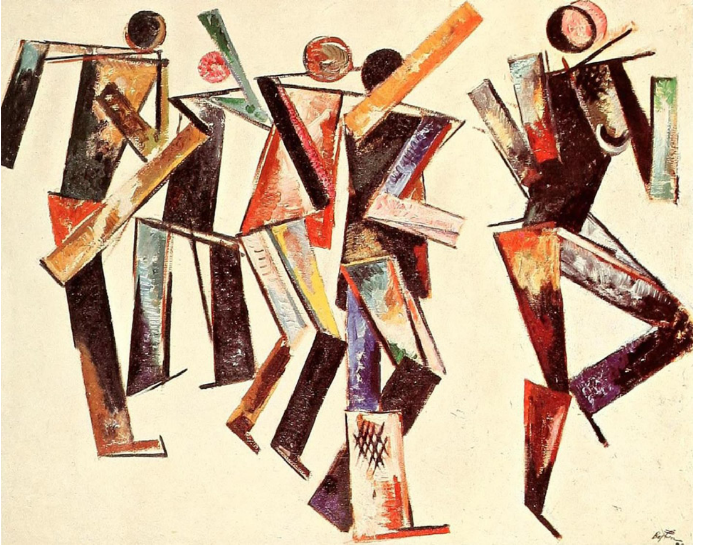
वरवरा स्टेपनोवा, सफेद पृष्ठभूमि पर पांच आकृतियाँ, 1920

28 जनवरी और 2 फरवरी 2020 के बीच, ट्राइकांटीनेंटल : अन्तर्राष्ट्रीय शोध संस्थान और इंटरनेशनल पीपुल्स असेंबली ने मिलकर जन-आन्दोलनों में कला और संस्कृति की भूमिका पर कुएर्नावाका, मेक्सिको में एक बैठक आयोजित की। इस बैठक में पंद्रह देशों से बत्तीस लोग शामिल हुए ; जिनमें ज्यादातर क्रांतिकारी कलाकार थे, जिन्होंने कला और राजनीति के व्यापक सवाल से लेकर भारत में नुक्कड़ नाटक और क्यूबा की क्रांति-पश्चात ग्राफिक कला जैसे कई मुद्दों पर चर्चा की।