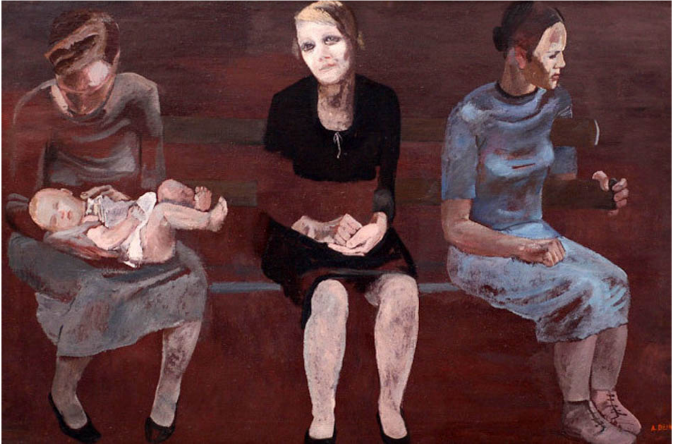
एलेक्जेंड्र डेनेका (यूएसएसआर), बर्लिन में बेरोज़गार, 1932

ऊपर जो कुछ भी लिखा गया है वह अतिशयोक्ति नहीं है। यह सभी आँकड़े विश्व स्वास्थ्य संगठन और विश्व बैंक जैसे मुख्यधारा के संगठनों के शोधकर्ताओं और विश्लेषकों ने दिए हैं। ये संगठन पूँजीवादी नीति के दुष्प्रभावों को बढ़ाकर नहीं पेश करते; निजीकरण और कॉर्पोरेट-आधारित नीतियों के खतरों को कम करके दिखाने और सार्वजनिक सुविधाओं में अधिक कटौती करने का आग्रह करने की इनकी प्रवृत्ति ज़रूर रही है। डब्ल्यूएचओ (1998-2003) के संचालन में ग्रो हार्लेम ब्रुन्डलैंड के कार्यकाल के दौरान, इस संगठन ने निजी-सार्वजनिक भागीदारी (पीपीपी) और उत्पाद विकास साझेदारी (पीडीपी) के निर्माण को बढ़ावा दिया। डब्ल्यूएचओ की ओर से निजी क्षेत्र को बढ़ावा देने पर ज़ोर -और सार्वजनिक खर्च में कटौती करने के लिए अंतर्राष्ट्रीय मुद्रा कोष के दबाव- ने कई ग़रीब देशों की सार्वजनिक स्वास्थ्य प्रणालियों को बर्बाद कर दिया।