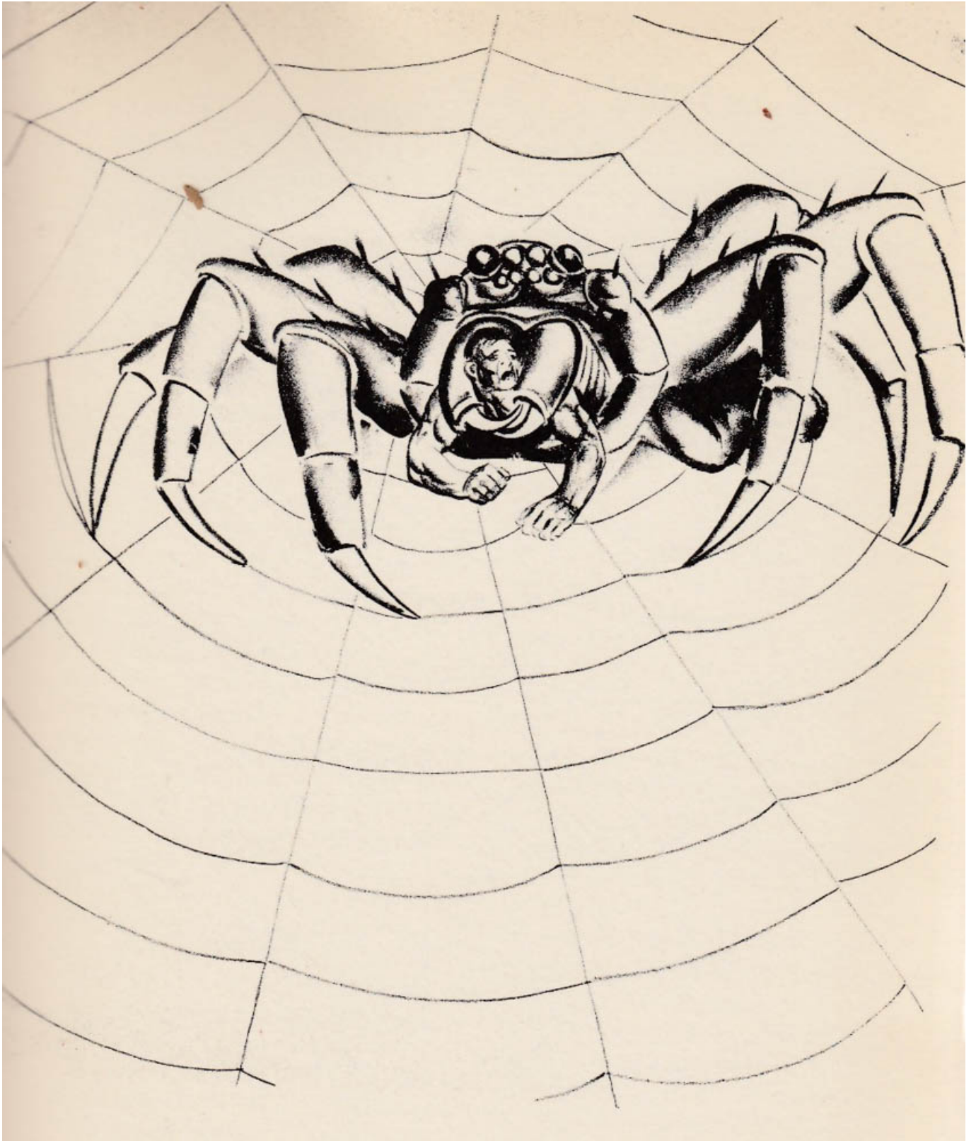
ह्यूगो गेलर्ट (यूएसए), कॉमेडि गुलिवर, 1935