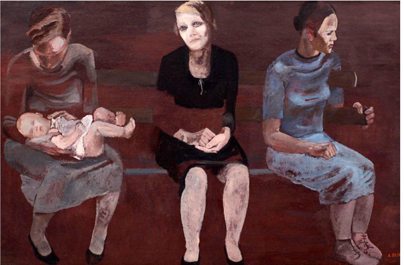
एलेक्जेंड्र डेनेका (यूएसएसआर), बर्लिन में बेरोज़गार, 1932।

ऊपर जो कुछ भी लिखा गया है वह अतिशयोक्ति नहीं है। यह सभी आँकड़े विश्व स्वास्थ्य संगठन और विश्व बैंक जैसे मुख्यधारा के संगठनों के शोधकर्ताओं और विश्लेषकों ने दिए हैं। ये संगठन पूँजीवादी नीति के दुष्प्रभावों को बढ़ाकर नहीं पेश करते; निजीकरण और कॉर्पोरेट-आधारित नीतियों के खतरों को कम करके दिखाने और सार्वजनिक सुविधाओं में अधिक कटौती करने का आग्रह करने की इनकी प्रवृत्ति ज़रूर रही है। डब्ल्यूएचओ (1998-2003) के संचालन में ग्रो हार्लेम ब्रुन्डलैंड के कार्यकाल के दौरान, इस संगठन ने निजी-सार्वजनिक भागीदारी (पीपीपी) और उत्पाद विकास साझेदारी (पीडीपी) के निर्माण को बढ़ावा दिया। डब्ल्यूएचओ की ओर से निजी क्षेत्र को बढ़ावा देने पर ज़ोर –और सार्वजनिक खर्च में कटौती करने के लिए अंतर्राष्ट्रीय मुद्रा कोष के दबाव– ने कई ग़रीब देशों की सार्वजनिक स्वास्थ्य प्रणालियों को बर्बाद कर दिया।