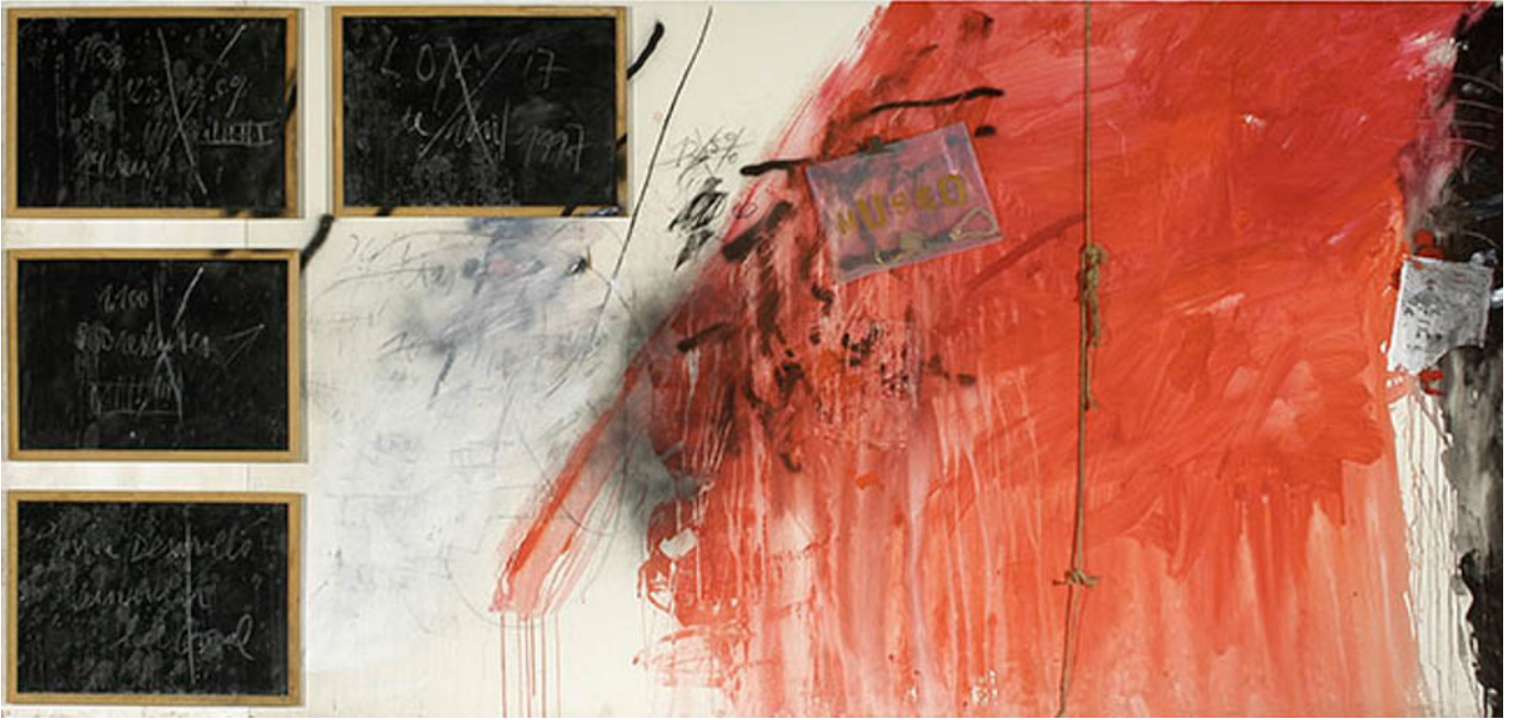
जोस बालम्स (चिली), लोटा एल सिलेंशियो, 2007।