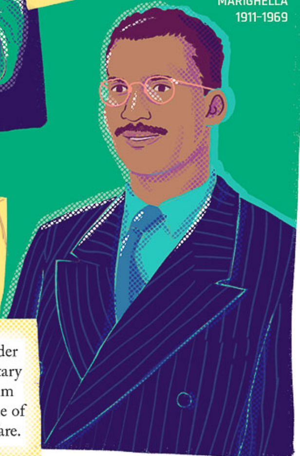
CARLOS MARIGHELLA 1911-1969

Logo of the Popular Revolutionary Vanguard.