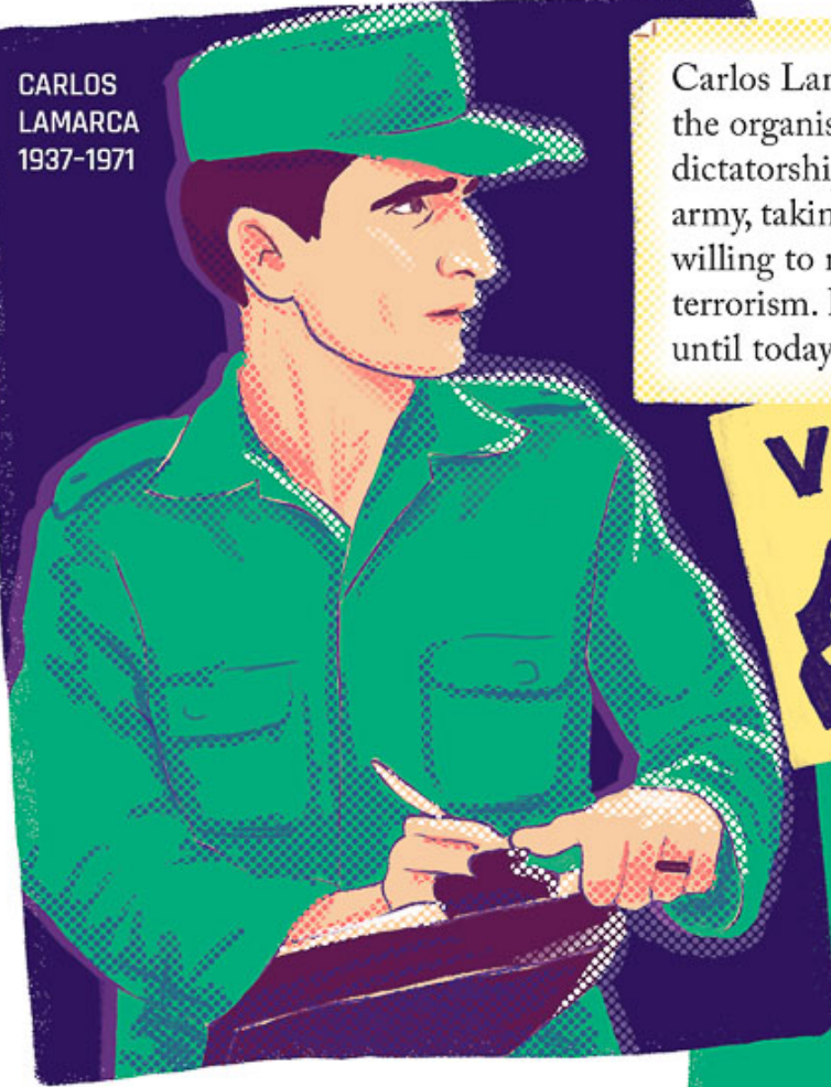
CARLOS LAMARCA 1937-1971

Carlos Lamarca became a major icon within the organised resistance to the military dictatorship of 1964. He deserted from the army, taking with him weapons and supporters willing to militarily resist the regime's terrorism. For this reason, he is remembered until today by the military as a so-called traitor.