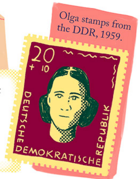
Olga stamps from the DDR, 1959.

Olga Benário Prestes was a German communist militant of Jewish origin who arrived in Brazil in 1934. Together with Luiz Carlos Prestes, she participated in the insurrection of 1935, which sought to take down the Vargas dictatorship and has since been used to bolster deep anticommunism within the Armed Forces.