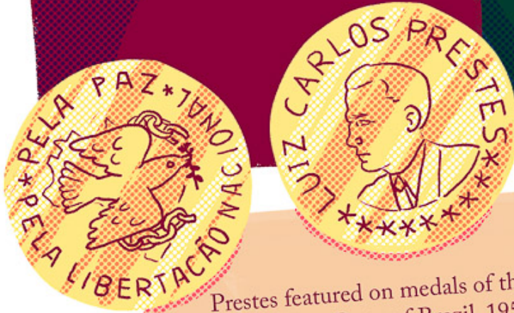
Prestes featured on medals of the Communist Party of Brazil, 1954.

Olga Benário Prestes was a German communist militant of Jewish origin who arrived in Brazil in 1934. Together with Luiz Carlos Prestes, she participated in the insurrection of 1935, which sought to take down the Vargas dictatorship and has since been used to bolster deep anticommunism within the Armed Forces.