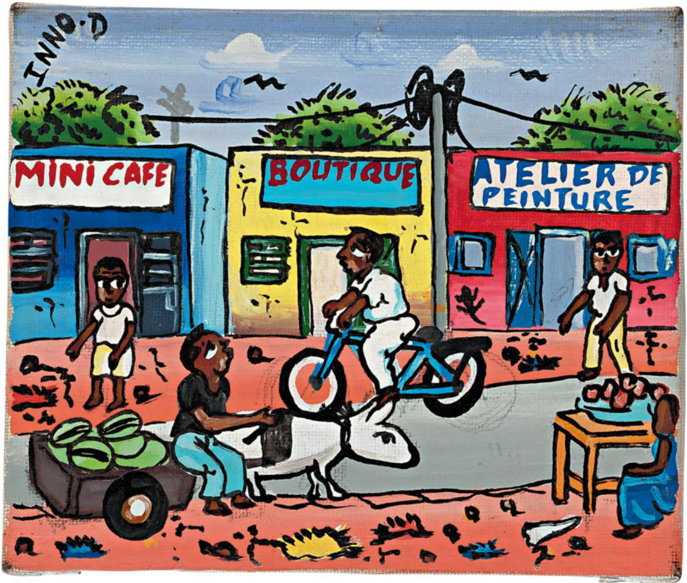
इनौसा सिम्पोर (बुर्किना फासो), औगा रोड, 2014.

इस्लामिक मघरेब में अल-कायदा तथा अल-मौराबिटौन, अंसार डाइन और कातिबत मैकिना जैसे समूह – जिनसे मिलकर 2017 में जमात नुसरत अल-इस्लाम वाल-मुस्लिमिन (‘इस्लाम और मुसलमानों के समर्थन के लिए समूह’) बना था – दक्षिणी अल्जीरिया से कोटे डी‘आइवर तक, पश्चिमी माली से पूर्वी नाइजर तक मज़बूत हैं। ये जिहादी, जिनमें से कई अफगानिस्तान युद्ध में सिपाही रहे थे, स्थानीय डाकुओं और तस्करों के साथ आम कारण से जुड़े हुए हैं। यह ‘जिहाद का दस्युकरण’, जैसा कि इसे कहा जाता है। और यह इस बात का एक स्पष्टीकरण है कि कैसे ये ताकतें इस क्षेत्र में इतनी गहरी जड़ें जमा चुकी हैं। एक और स्पष्टीकरण यह है कि जिहादियों ने फुलानी (एक मुस्लिम जातीय समूह) और अन्य समुदायों, जो अब कोग्लवेगो (‘झाड़ी संरक्षक’) नामक सैनिक समूहों में जुड़ रहे हैं, के बीच के पुराने सामाजिक तनावों का इस्तेमाल किया है। जिहादी-सैन्य संघर्ष में विभिन्न अंतर्विरोधों को भड़का कर बुर्किना फासो, माली और नाइजर के बड़े हिस्से में राजनीतिक जीवन का प्रभावी ढंग से सैन्यीकरण किया गया है। ऑपरेशन बरखाने के माध्यम से फ्रांस का माली के अंदर सैन्य हस्तक्षेप 2014 से जारी है। इस हस्तक्षेप और उसके द्वारा बनाए गए सैन्य ठिकानों से विद्रोह और टकराव न तो रुक सके हैं और न ही कम हुए हैं। इन सब कारकों ने केवल टकरावों और विद्रोहों को बढ़ावा ही दिया है।