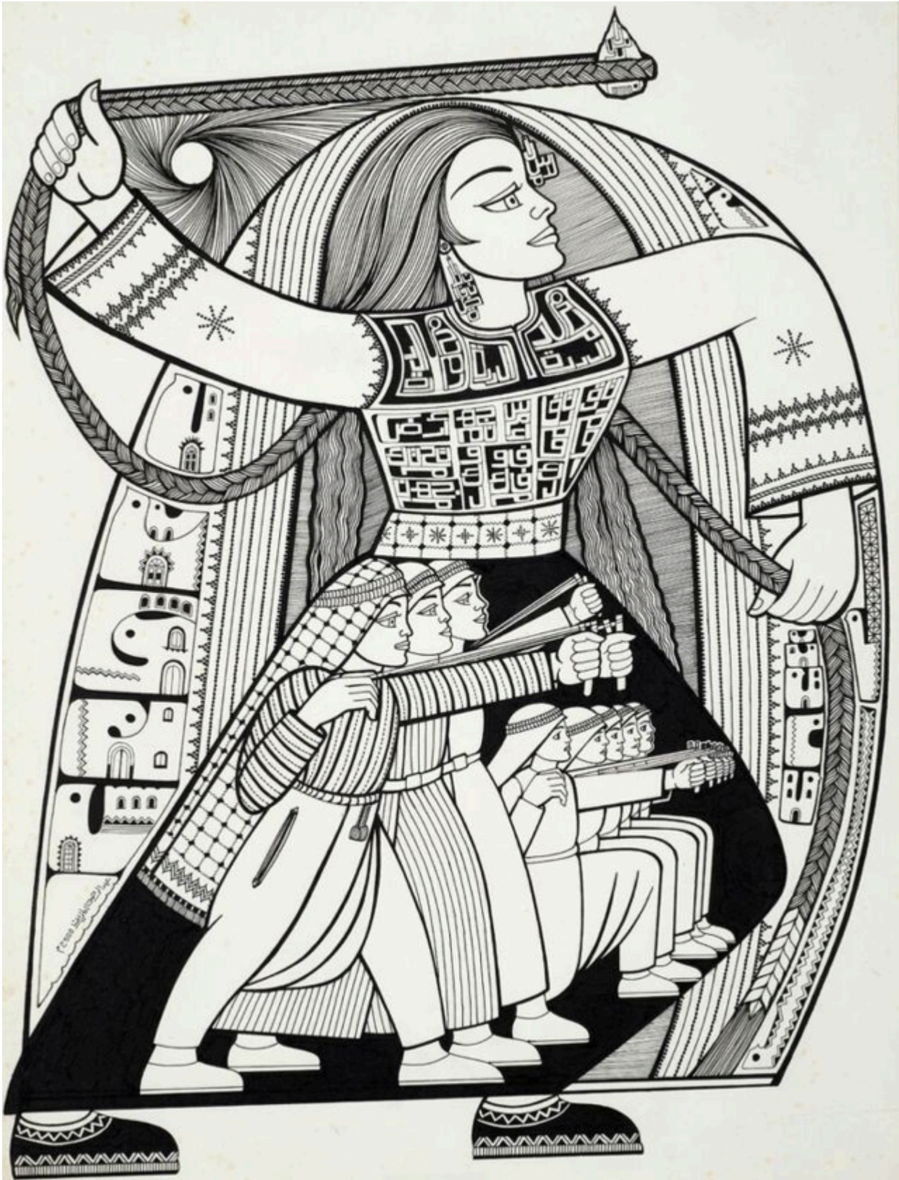
अब्देल रहमेन अल-मोज़ायन (फ़िलिस्तीन), जेनिन, 2002.