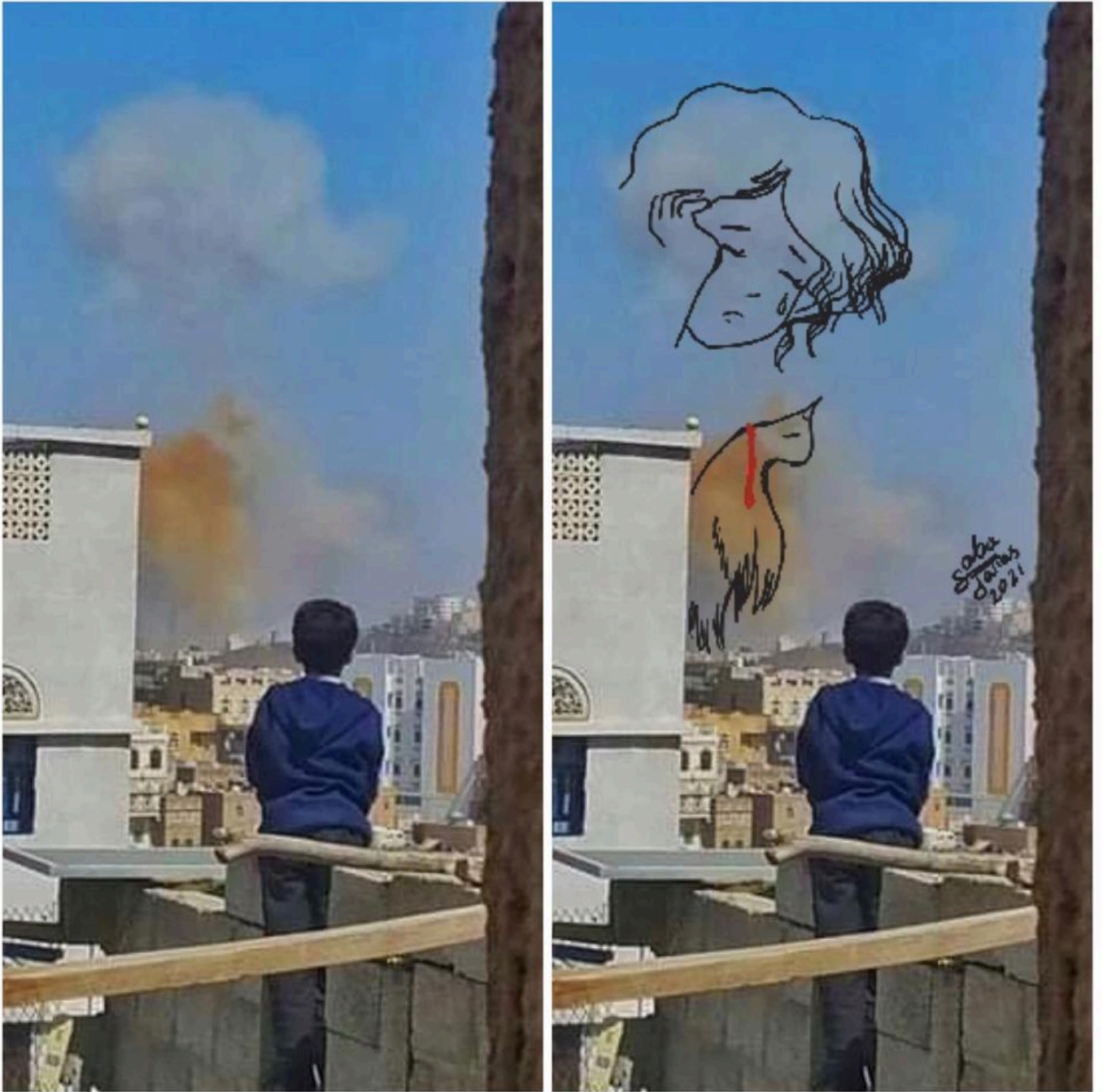
सबा जल्लास (चित्रण) / मोहम्मद अजीज़ (फोटो), सना पर आज की बमबारी 7/3/2021 ई., यमन, 2021 से साभार.

फ़रवरी 2021 से, अंसार अल्लाह के सैन्य बल मारिब पर क़ब्ज़ा करने की कोशिश कर रहे हैं; मारिब यमन की तेल शोधन परियोजना का प्रमुख केंद्र है, और देश के उन कुछ हिस्सों में से एक है जो अभी भी राष्ट्रपति हादी के नियंत्रण में हैं। अन्य प्रांत, जैसे कि दक्षिण अल-क्रायदा के हाथों में हैं, जबकि सेना से अलग होकर काम करने वाला गुट पश्चिमी समुद्र तट को नियंत्रित करते हैं। मारिब पर हो रहे हमलों ने मौत की विभीषिका और भी बढ़ा दी है, जिससे शरणार्थियों की बाढ़ आ गई है। यदि मारिब पर क़ब्ज़ा करने में अंसार अल्लाह कामयाब हो जाता है, जिसकी संभावना भी है, तो हादी को देश का राष्ट्रपति बनाए रखने का संयुक्त राष्ट्र का मिशन विफल हो जाएगा। इसके बाद अंसार अल्लाह अरब प्रायद्वीप में अल-