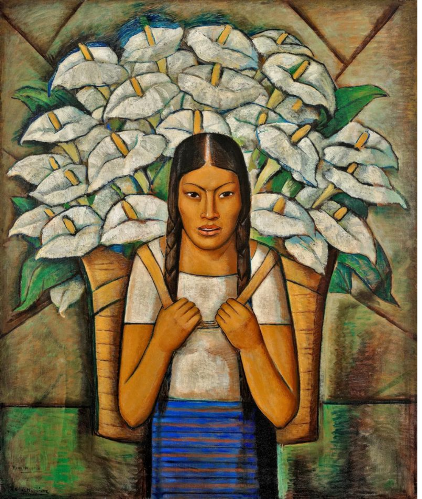
अल्फ्रेडो रामोस मारतीनेज़ (मेक्सिको), वेनदेडोरा डे एल्कट्राज़ ('काला लिली वेन्डोर, 1929')

पिछले कुछ हफ्तों में तीन बेहद अहम चुनाव हुए – भारत, मेक्सिको और दक्षिण अफ्रीका में। भारत और दक्षिण अफ्रीका ब्रिक्स समूह के बहुत ज़रूरी घटक हैं। यह गठबंधन एक ऐसी वैश्विक व्यवस्था बनाने की ओर बढ़ रहा है जिसमें