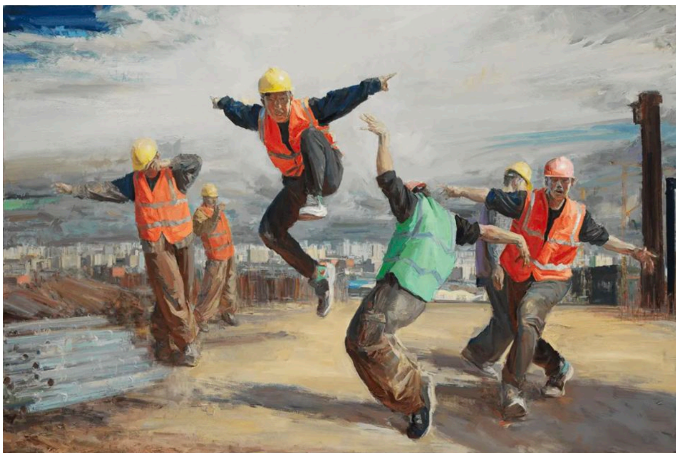
Liu Hongjie (China), Skyline [Horizonte] , 2021.