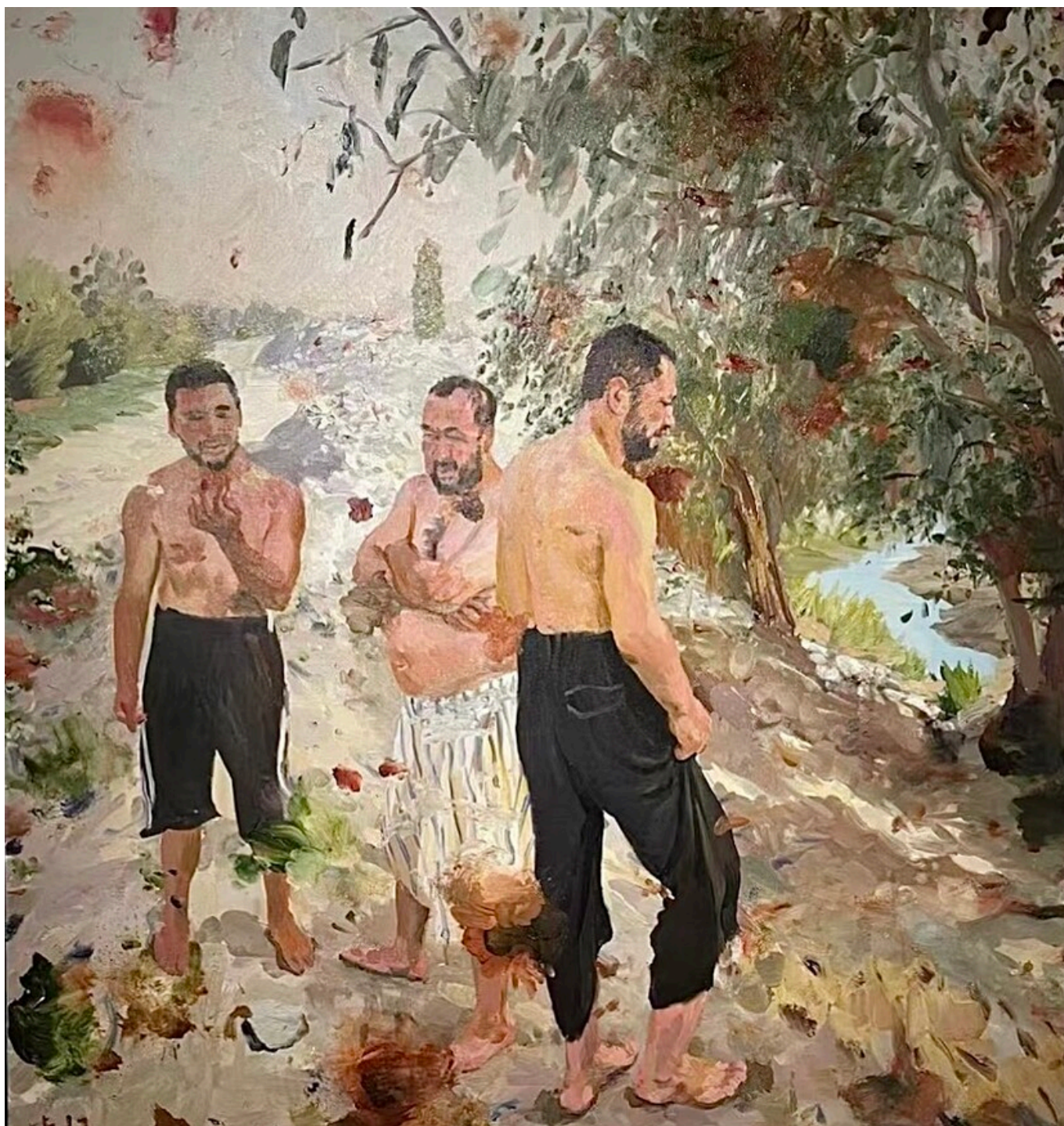
Liu Xiaodong (China), Belief [Crença] , 2012.

O primeiro é mais difícil de entender, e eu ainda não o compreendi de fato. Quando se trata da ideia de que a religião deve estar alinhada com os valores modernos, especialmente os valores socialistas, estou totalmente de acordo. Como isso deve acontecer? Será que se deve, por exemplo, proibir certas práticas (como os lenços que cobrem os cabelos na França), ou deve-se iniciar um processo de debate e discussão com os líderes das comunidades religiosas (que geralmente são os mais conservadores)? O que fazer quando se depara com uma insurgência que tem suas raízes fora do país, como no Afeganistão, no Uzbequistão e até mesmo na Síria, em vez de dentro do país, como as contradições em Xinjiang? Todos esses dilemas são urgentes, mas não se pode