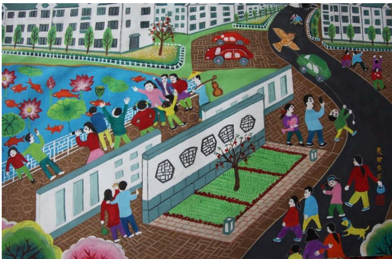
Sheyang Farmers Painting Institute (Jiangsu, China), parte do projeto “pintura de agricultores”, 2017.

No final da década de 1990, começaram os debates , inclusive nos jornais do Partido Comunista da China (PCCh), para combater as taxas crescentes de desigualdade e pobreza por meio de ações em massa. No quinto plenário do 16º congresso do PCCh, em outubro de 2005, o partido anunciou uma “grande missão histórica” para “construir um novo campo socialista”, usando a nova expressão “três rurais” para se referir à agricultura, aos agricultores e às áreas rurais. Essa missão buscava melhorar a infraestrutura rural por meio de investimentos estatais, oferecer educação gratuita e obrigatória e desenvolver serviços médicos cooperativos, enquanto fazia um recuo em relação às reformas de mercado no setor de saúde, a última das quais se tornou uma política nacional em toda a China a partir de 2009. Interessou-me o fato de a campanha ter sido conduzida com um caráter de massa e não burocrático, com milhares de funcionários do PCCh envolvidos na realização dessa missão. Esse foi o precursor da campanha de erradicação da pobreza que viria uma década depois.