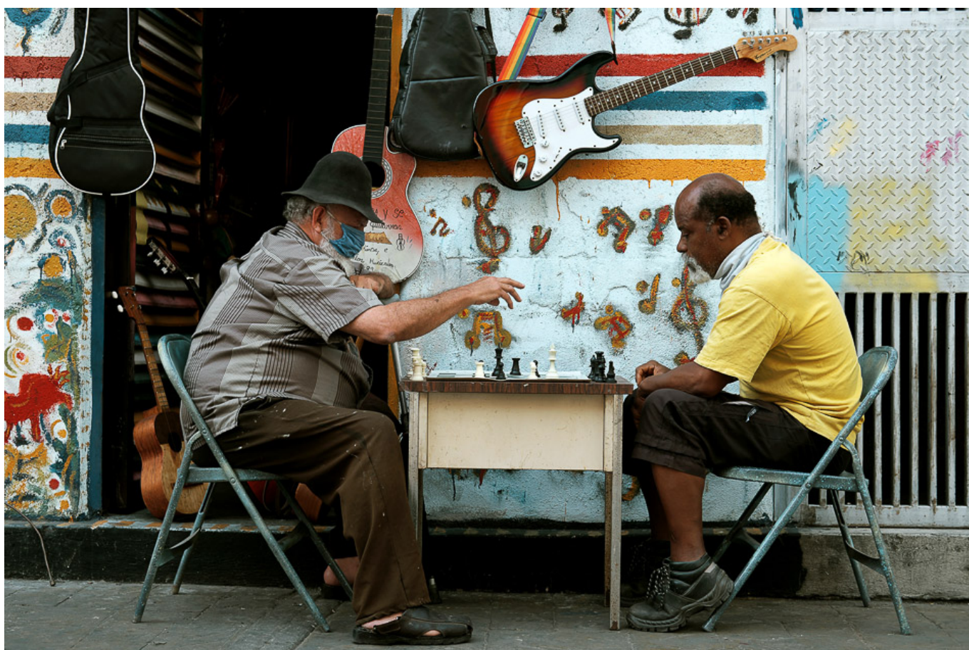
Dikó, Cagri Photos (Venezuela), Chess in the time of covid [Xadrez nos tempos de covid] , Caracas, 2020.

(OMC) previa um declínio de 32% no volume comercial global, mas agora parece ter caído apenas 3% (os vôos comerciais globais diminuíram 74% entre janeiro e meados de abril; desde então aumentaram 58% em meados de junho, enquanto o tráfego portuário de contêineres se recuperou em junho em relação a maio). “Poderia ter sido muito pior”, disse o diretor-geral da OMC, Roberto Azevêdo.