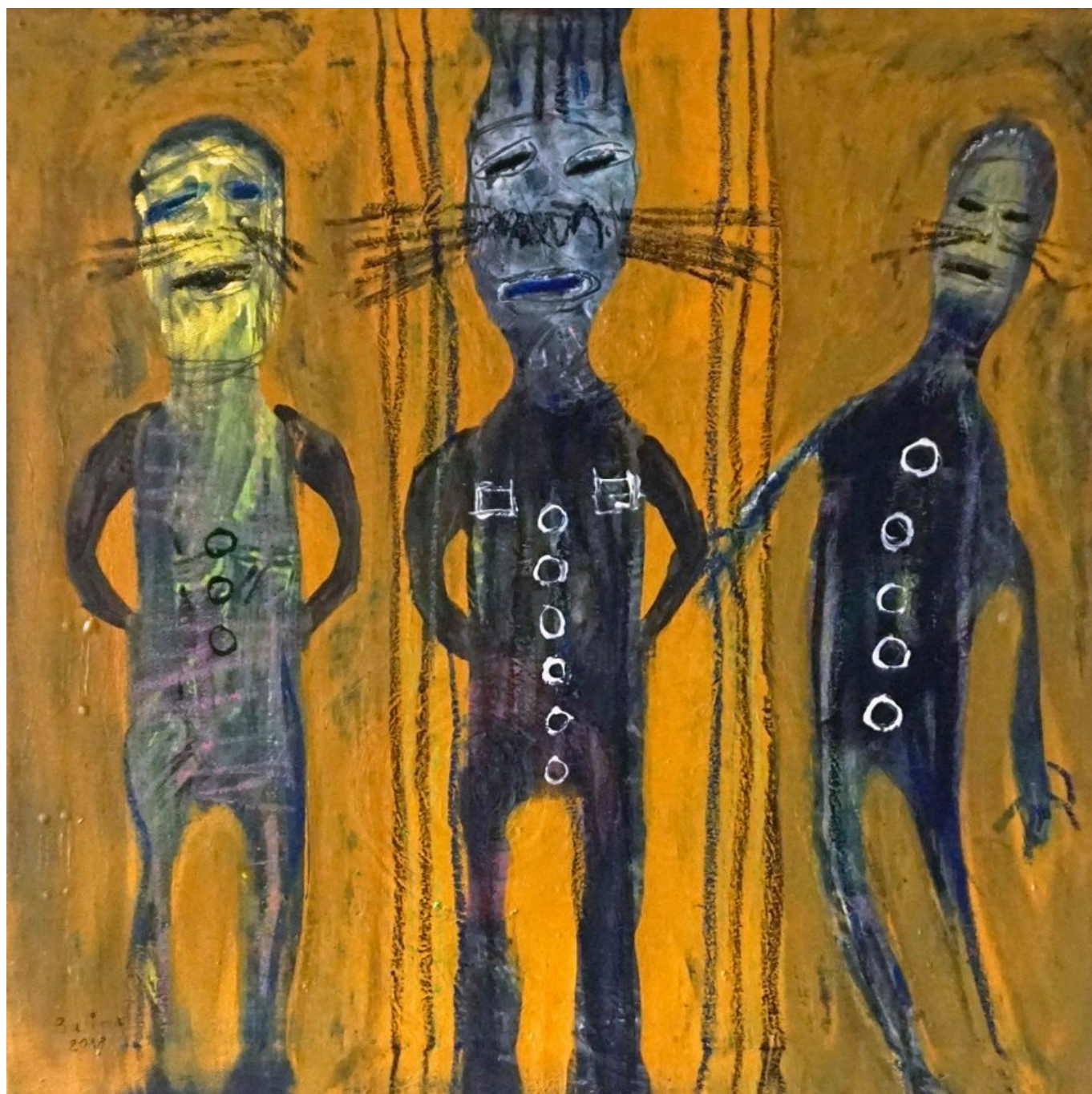
Wilfried Balima (Burkina Faso), Les Trois Camarades [Os Três Camaradas], 2018.