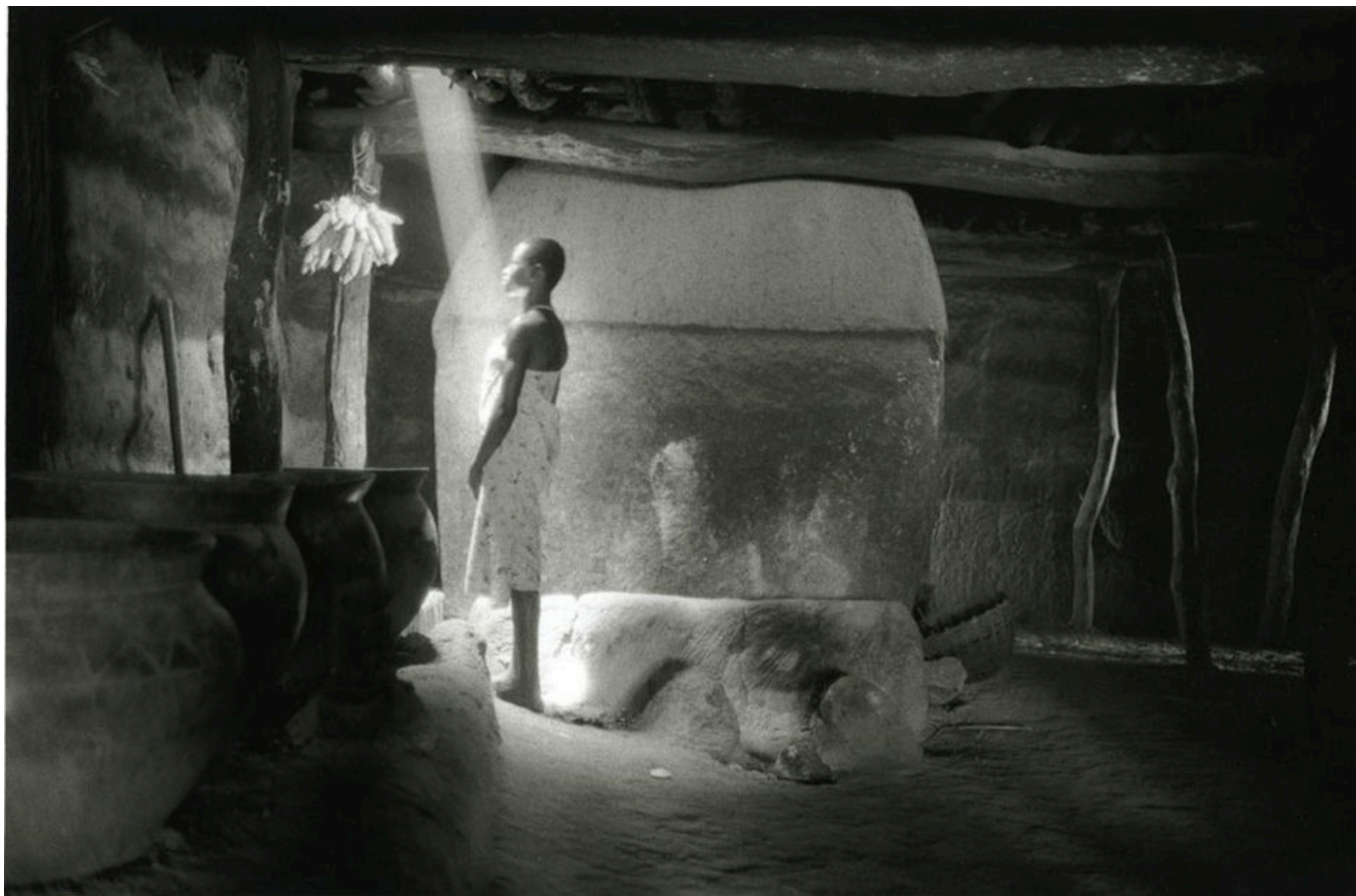
Françoise Huguier (França), Pays Lobi, Burkina Faso , 1996.

A Union d'Action Syndicale lançou um plano de dez pontos que inclui alívio imediato para as áreas que passam fome (como Djibo ), uma comissão independente para estudar a violência em áreas específicas (como Gaskindé ), a criação de um plano para lidar com a crise do custo de vida, e o fim da aliança com a França, que incluiria a “saída de bases e tropas estrangeiras, especialmente francesas, do território nacional”.