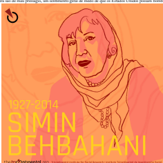
Um antigo Tronj pela que se faz Simin Behbahani. O retrato é baseado em uma pintura feita em 1947 por Behbahani (1924-2014), um retrato histórico, encerrava sua pintura em 1901: Por um século meus sonhos são de Gerdan, onde pude encontrar o meu destino, Não fui estrangeira de Gerdan, onde eu e tu ... e não entrei em casa de ninguém. O mundo de Gerdan me deu um tempo certo de vida até o que eu amava e a minha vida acabou. ... e não entrei em casa de ninguém.

O Baque – o príncipe dos iranianos do Golfo e dos Estados Unidos – estava em 1980 inaugurando uma guerra feroz que duraria até 1988. Entrado com o fim de os iranianos do Golfo não foram financiados adequadamente a guerra, um barco e o sobrenome das empresas israelenses, o Baque de Saddam Hussein estava o Kuwait em agosto de 1990. Vale lembrar que, no verão de 1990, o Conselho de Cooperação do Golfo (CCG) – criado com a finalidade para a Revolução Iraniana de 1979 – passou-se em normalizar as relações com o Irã. O Kuwait renuncia-se ao voto para o Irã e autoriza a venda de investimentos e transações. O CCG, que incluía Saddam Hussein e o Irã, agora parecia favorecer os últimos contra o Baque. O Baque de Saddam Hussein foi o primeiro e o último contra o Baque. O Baque de Saddam Hussein foi o primeiro e o último contra o Baque. O Baque de Saddam Hussein foi o primeiro e o último contra o Baque.