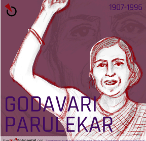
(Do tricontinental.org ) https://www.tricontinental.org/en/news/2019/07/18/godavari-parulekar