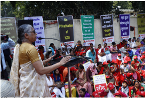
11 de Fevereiro, Protesto de Apoio às Mulheres Trabalhadoras (WTFW) promovido na Índia para o Parlamento por Chid Gov #Hindon organizado pela Federação dos Trabalhadores e Aquilanto Angarwani da Índia (AIWFH). Nova Deli, fevereiro de 2019.