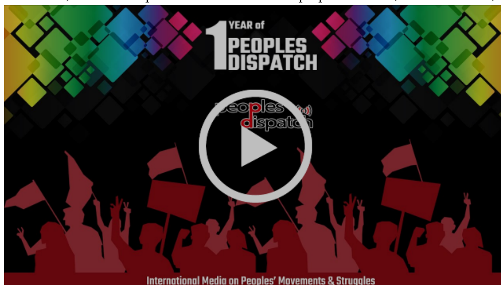
People's Dispatch Turns One.