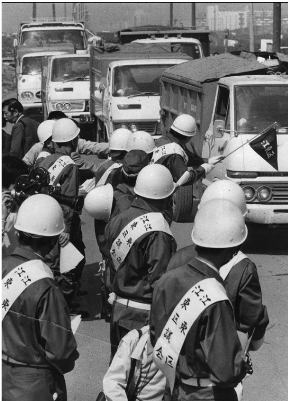
Membros da assembleia Kōtō olhando caminhões entrarem em seu bairro, 22 de maio de 1973. Crédito: Mainichi Shimbun.

Resíduos representam um problema sério. Um relatório do Banco Mundial estima que os seres humanos produzem 2,0 bilhões de toneladas métricas de lixo por ano. Em 2050, esse número aumentará em 70%, para 3,4 bilhões de toneladas métricas. Deste lixo, apenas 13,5% são reciclados, enquanto apenas 5,5% são compostados. Assim, 81% desse lixo é descartado em aterros sanitários ou incinerado. Se continuarmos no ritmo atual, precisaremos de novos planetas como aterros sanitários.