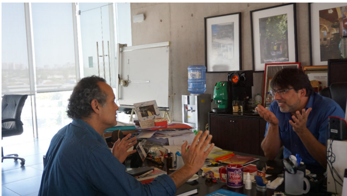
Daniel Jadue conversa com Vijay Prashad.