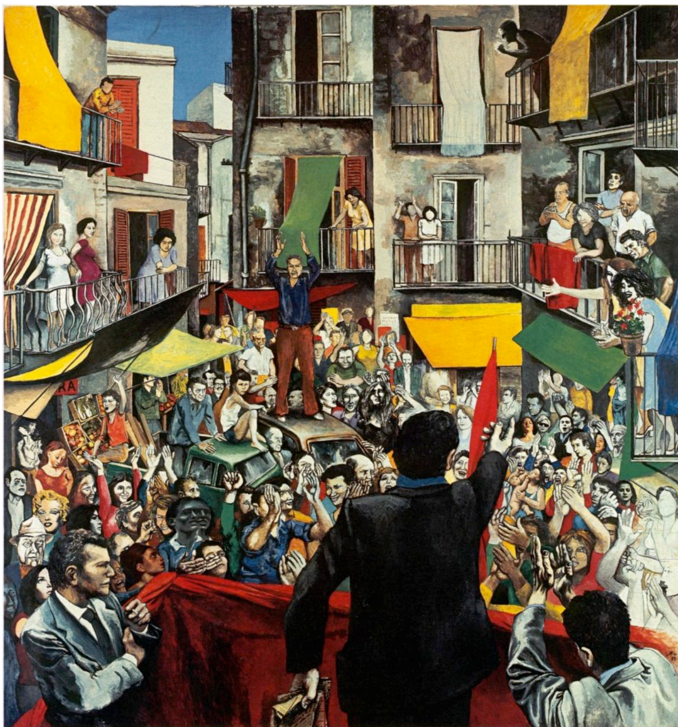
Renato Guttuso (Itália), Comizio di quartiere, 1975.

Com formação em arquitetura, Jadue tem um senso claro de planejamento a longo prazo. Em 2001, os comunistas na Recoleta desenvolveram um plano estratégico para ganhar a gestão da comuna até 2012, conta.