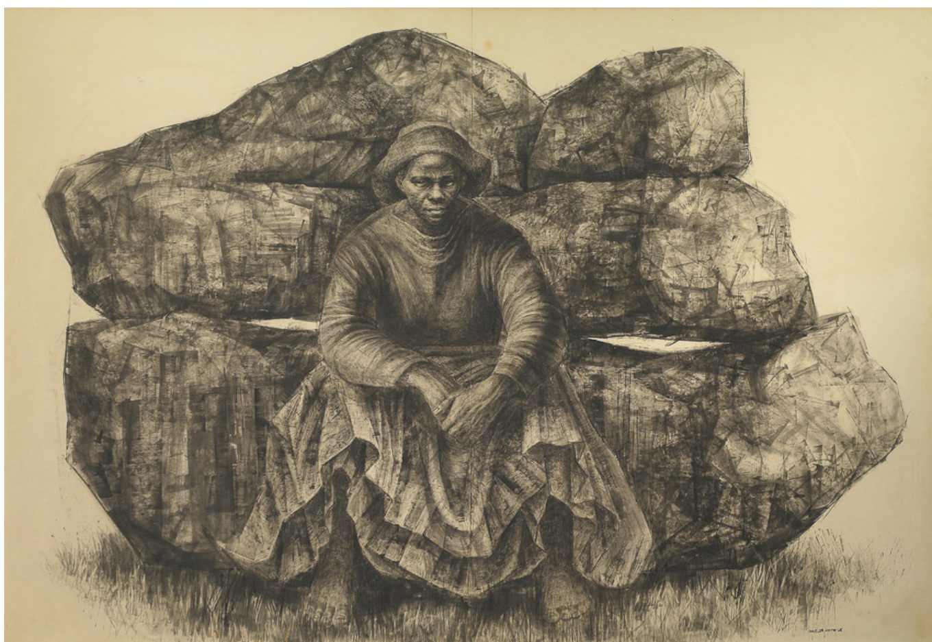
Charles White (USA), General Moses (Harriet Tubman) , 1965.

Se essa política racional não cuida apenas dos pobres e economiza dinheiro do município, pergunto a ele, por que outras comunas não seguem o modelo da Recoleta? “Porque não estão interessados no bem-estar das pessoas”, Jadue me diz. “O capitalismo cria os pobres”, diz, e estes então vêm pedir bens e serviços do Estado devido à sua relativa impotência. “Os pobres são mais honestos que os ricos. Se conseguem comprar bens e serviços a um preço justo, eles não pedem dinheiro”.