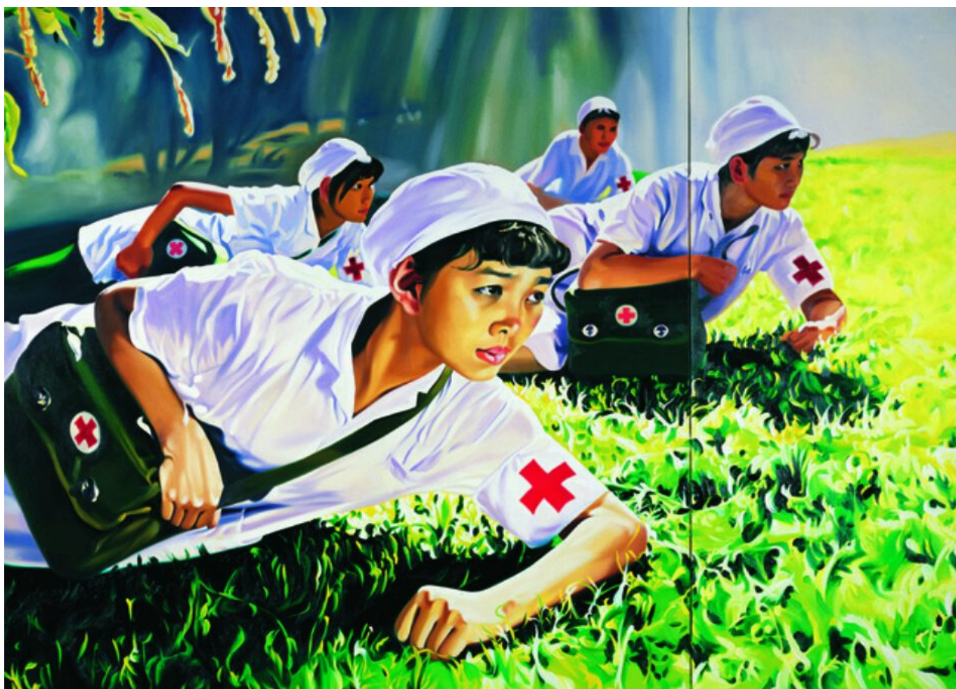
Jing Kewen (China), Sonho 2008, n. 1 (enfermeiras) , 2008.

O ataque à China e à OMS parece calculado para desviar a atenção da incompetência de governos de países como EUA e Brasil em lidar com a crise. No Brasil, o presidente Jair Bolsonaro agora suspendeu a publicação de dados públicos sobre as taxas de infecção e mortalidade causada pelo vírus; também ameaça suspender a ordem constitucional e realizar um autogolpe e tomar o poder por completo.