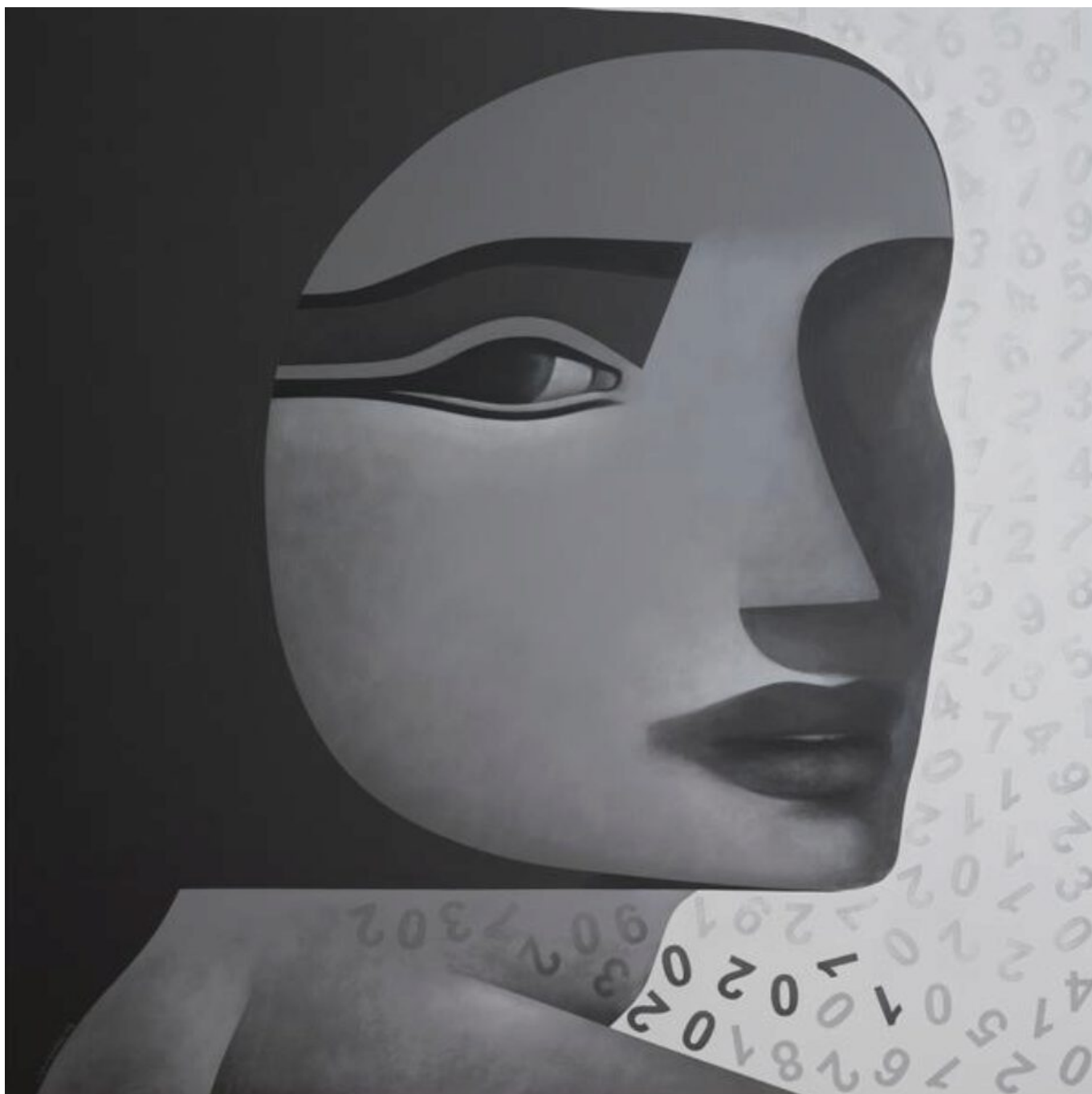
Safwan Dahoul (Syria), Dream 172 , 2018.

Pessoas como Trump e Bolsonaro não estão interessadas nas vozes desses trabalhadores ou de suas comunidades; estão focados em polir suas próprias reputações culpando os outros por sua própria incompetência. São esses trabalhadores, no entanto, cuja seriedade mantém nossa sociedade unida; é hora de permitirmos que eles definam o caminho a seguir.