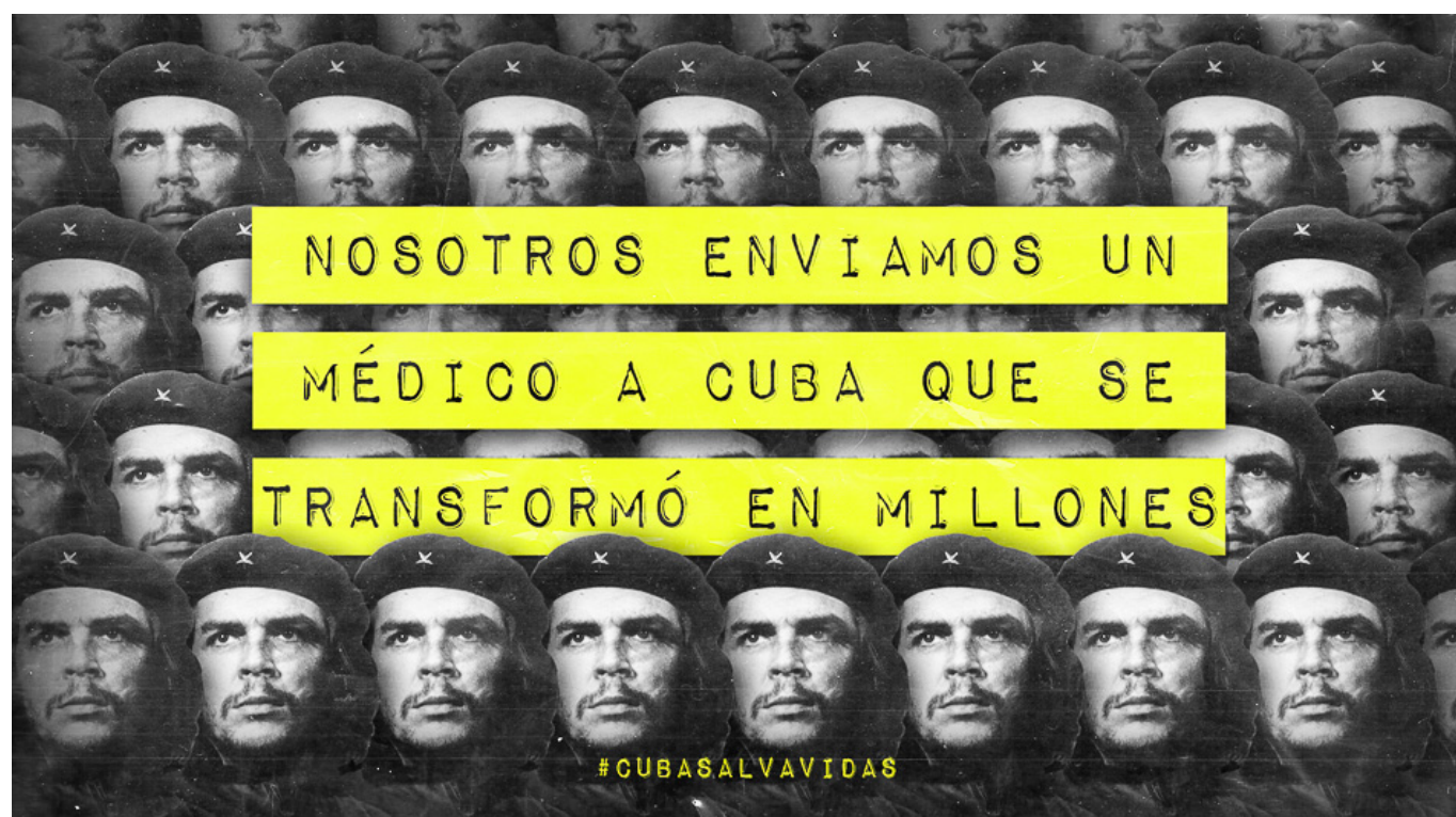
Campanha #CubaSalvaVidas, Enviamos um médico a Cuba e ele se transformou em milhões, 2020.

Enquanto isso, foi o Vietnã – um país pobre que, na memória viva, foi bombardeado com armas de destruição em massa pelos Estados Unidos – que enviou equipamentos de proteção a Washington. E foram os médicos chineses e cubanos que viajaram pelo mundo para oferecer sua assistência na luta contra a Covid-19. Nenhuma equipe médica dos Estados Unidos, Reino Unido, Brasil ou Índia podia ser vista em lugar algum. Mergulhados no racismo, os líderes perigosamente incompetentes desses Estados tentaram hipnotizar as pessoas para que ficassem despreocupadas. O preço pago é muito alto. Essa é a razão pela qual o escritor Arundhati Roy pediu um tribunal para investigar os governos de Trump, Modi e Bolsonaro por “crime contra a humanidade”.