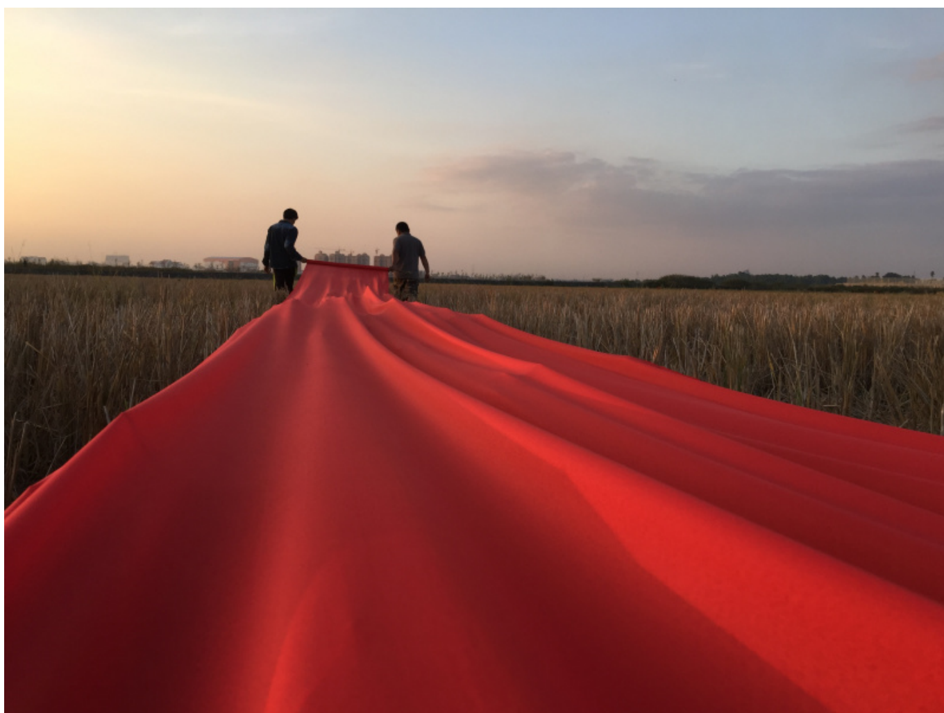
Bounpaul Phothyzan (Laos), Red Carpet [Tapete vermelho] , 2015.