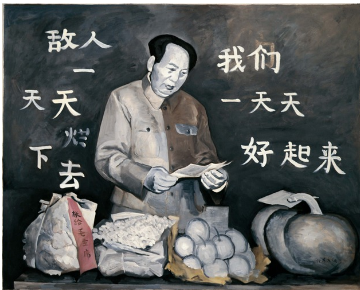
Yu Youhan, We Will Be Better [Ficaremos melhores], 1995.