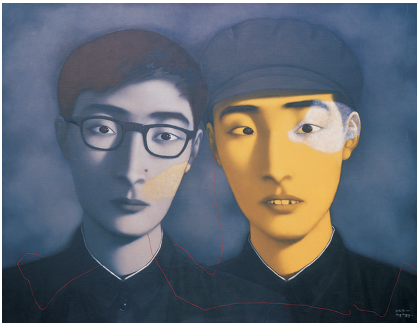
Zhang Xiaogang, Bloodline - Big Family no. 4, 1995.

Os Estados Unidos – que têm o hábito da dominação – tentaram ao máximo impedir e lidar com o crescente papel global da China. Lidar com a China significa intimidá-la para que permaneça subordinada aos interesses econômicos dos EUA. Washington acusou Pequim de manipulação de moeda e tentou fazer com que a China revisasse sua moeda em benefício dos Estados Unidos; isso não ocorreu e esse fracasso é um sinal de que a China não se curvará à autoridade dos EUA. As acusações sobre a moeda foram seguidas rapidamente por alegações de que a China havia forçado transferências de tecnologia ou roubado propriedade intelectual, de que impedia o acesso a serviços financeiros e de que não cortaria seus subsídios industriais. Cada presidente dos EUA ao longo da década passada – George W. Bush, Barack Obama e Donald Trump – acelerou as acusações contra a China e a retratou como tendo avançado inteiramente por meio da trapaça.