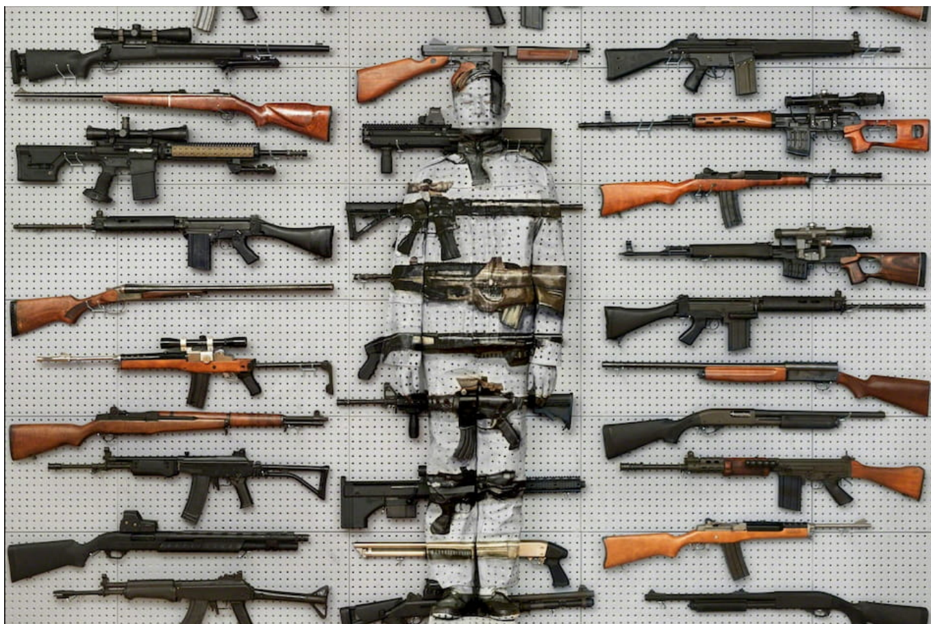
Liu Bolin, Hiding in New York [Escondendo-se em Nova York] n. 9 - Gun Rack, 2013.

3. Hong Kong e Xinjiang. O documento Indo-Pacífico do Departamento de Defesa dos EUA diz que os EUA – e a Índia – expressam “profunda preocupação” com o destino da população muçulmana na China; ao mesmo tempo, os EUA disseram apoiar os protestos em Hong Kong. A preocupação com os muçulmanos chineses, vindo dos EUA, não é crível, dada a própria postura de Trump diante dos muçulmanos; no caso da Índia, o primeiro-ministro Narendra Modi conduz uma política de cidadania e refugiados que é claramente antimuçulmana. Os Estados Unidos e seus aliados usam os casos de Hong Kong e Xinjiang para pressionar a China; as pessoas em Hong Kong e Xinjiang irão se iludir se acreditarem que os EUA realmente se preocupam com a democracia e os muçulmanos.