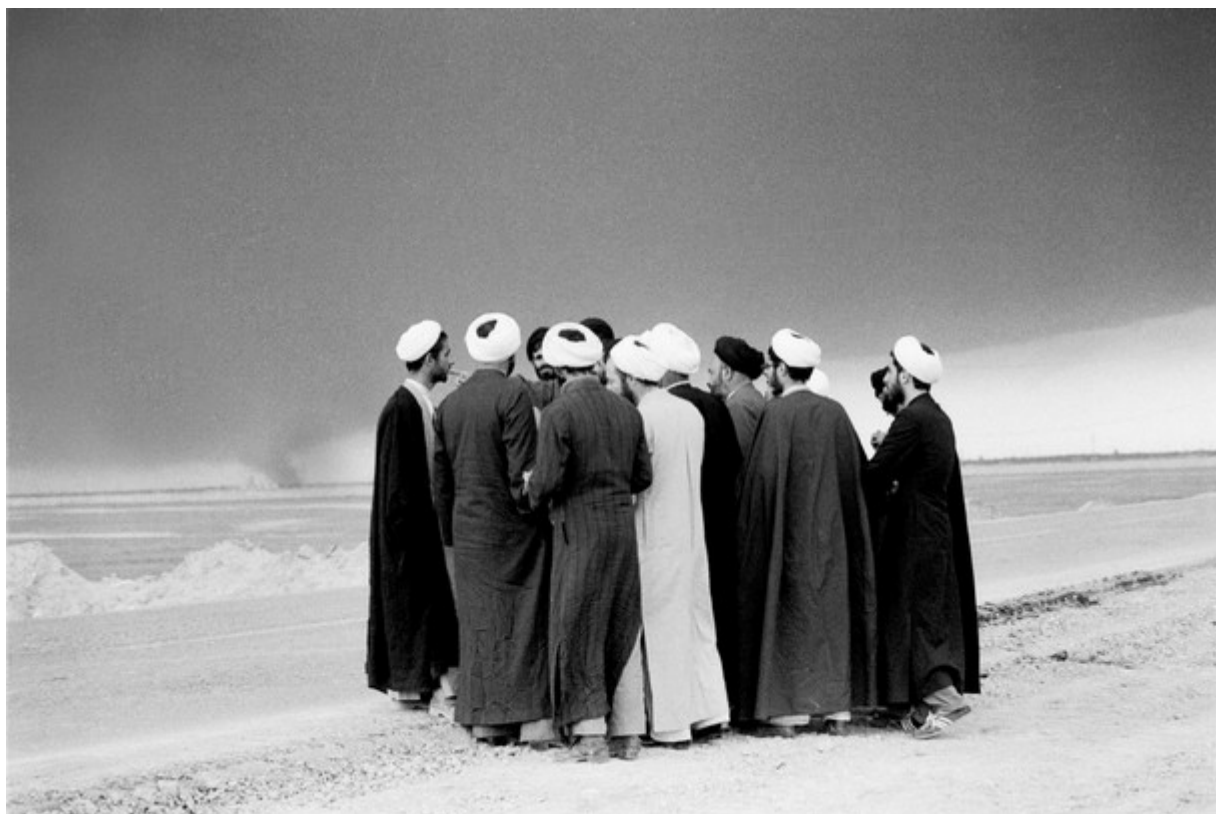
Kaveh Golestan, Mullahs at the front near Abadan, Iraq-Iran War, 1983

enfraquecer o vínculo entre Irã e Síria por meio da Lei de Responsabilidade da Síria, de 2005, e depois com a guerra na Síria a partir de 2011. Tentou também destruir a força política libanesa Hezbollah por meio do ataque israelense de 2006 ao Líbano. Não funcionou. Em 2006, os EUA fabricaram uma crise sobre o programa de energia nuclear do Irã; projetou sanções contra a economia iraniana junto à ONU e União Europeia. Isso também não funcionou e, em 2015, os EUA estabeleceram um acordo nuclear (rejeitado agora por Trump). Acabaria aí? Não, a guerra híbrida continuou.