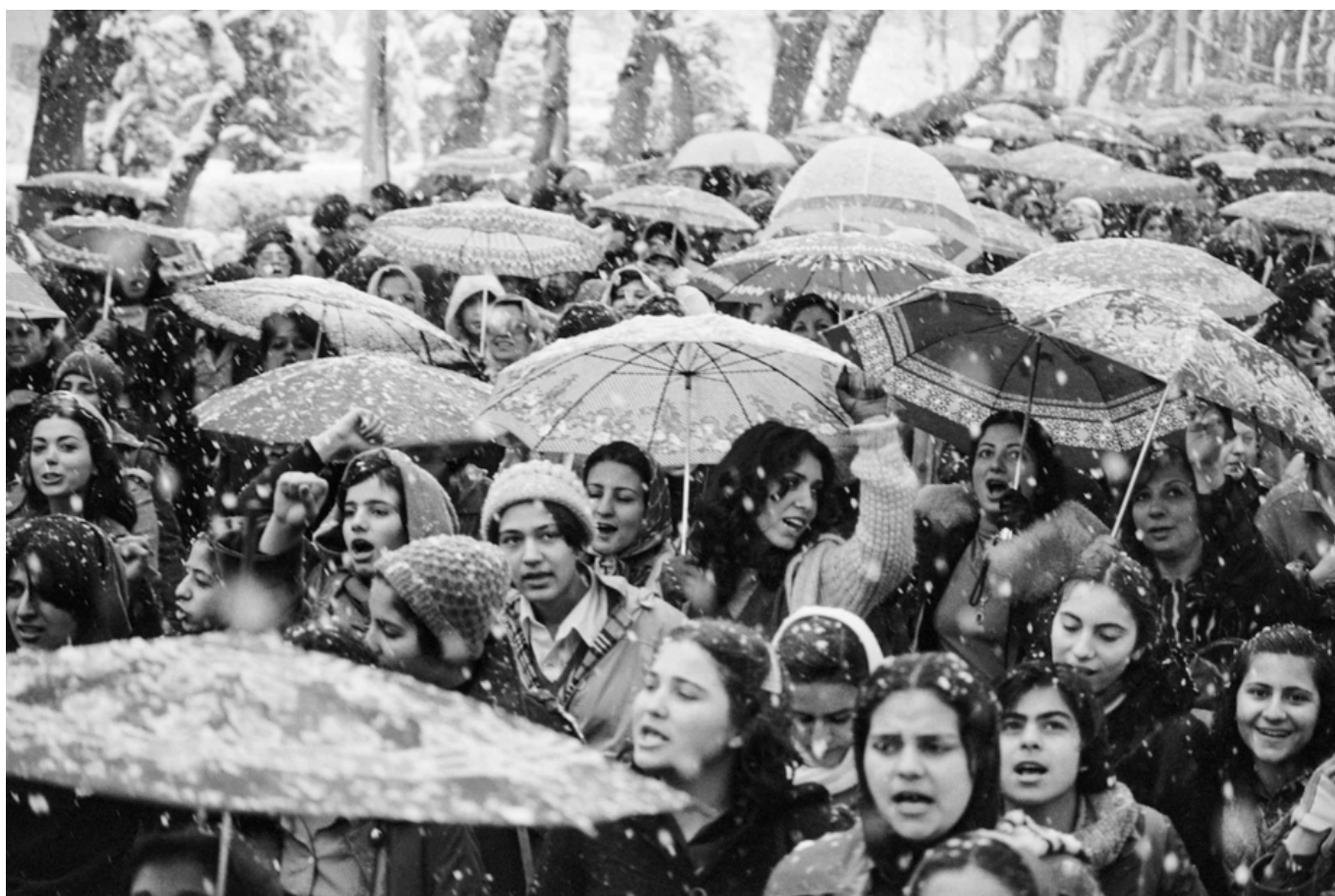
Hangameh Golestan, Witness 1979, 1979