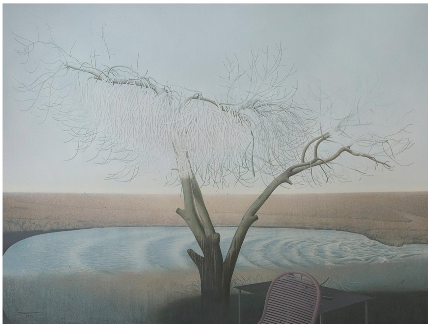
Meghdad Lorpour, Adeshir's Throne , 2018

nem potencial ou desejo de construí-lo; no entanto, os exemplos do Iraque e da Líbia, que abandonaram suas armas de destruição em massa, mostram o que pode ser feito para países que não têm poder nuclear. Nem o Iraque nem a Líbia ameaçaram o Ocidente, e ambos os países foram destruídos. Foi a Força Quds que desenvolveu um impedimento parcial contra um ataque ocidental ao Irã. A Força de Soleimani foi do Líbano ao Afeganistão para estabelecer relações com grupos pró-iranianos e os incentivou e apoiou na criação de grupos de milícias. A guerra na Síria foi um campo de testes para esses grupos, que estão preparados para atacar aliados dos EUA se o Irã for atacado de alguma forma. Após o assassinato de Soleimani, os iranianos disseram que caso fossem atacados de novo, destruiriam Dubai (Emirados Árabes Unidos) e Haifa (Israel). Mísseis iranianos de curto alcance podem atingir Dubai; mas é o Hezbollah que atacaria Haifa. Isso significa que os Estados Unidos e seus aliados enfrentarão uma guerra de guerrilhas regional em larga escala se houver algum bombardeio contra o Irã. Essas milícias são um trunfo para o Irã. Por isso Trump hesitou; mas pode não hesitar por muito tempo.