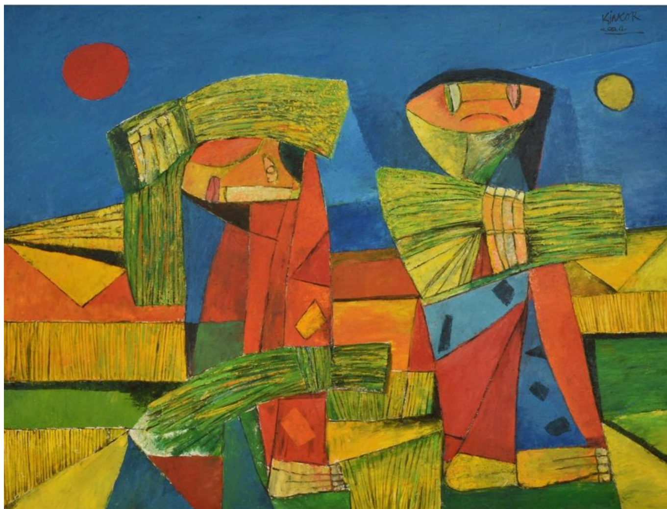
Ang Kiukok (Filipinas), Colheita , 2004.