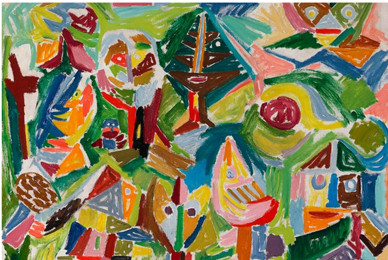
Asger Jorn (Dinamarca), Paisagem em Finkidong , 1945.

A ideia do “local” requer uma avaliação precisa das hierarquias de classe, etnia e gênero; não existe uma “comunidade local” ou “economia local” que não seja dilacerada pela exploração e violência dessas hierarquias. Da mesma forma, o conhecimento local deve ser visto ao lado dos avanços da ciência moderna, cujos avanços no campo da agricultura não devem ser desconsiderados. O que une a plataforma da soberania alimentar é a linha nítida que ela cria para se distinguir da forma capitalista de produção de alimentos.