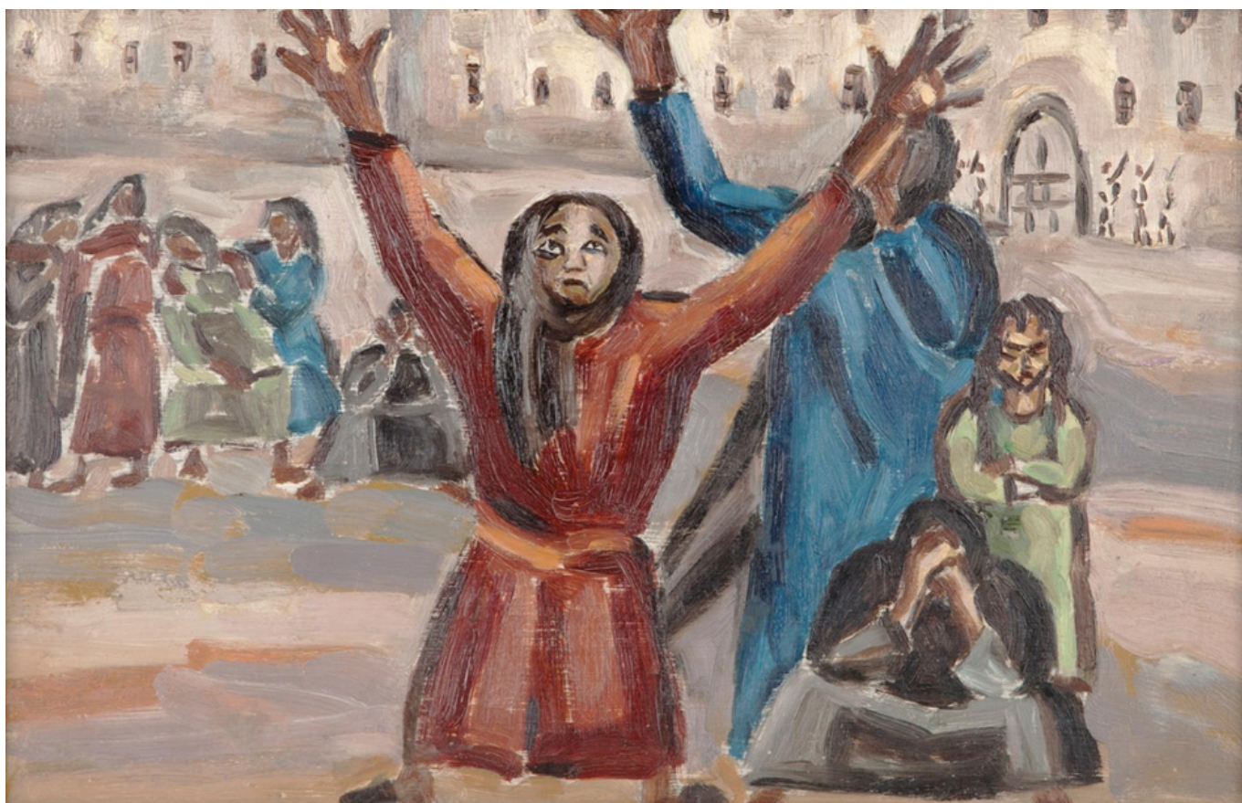
Inji Efflatoun, Prisioneiros, 1957.

Dadas essas disparidades, não admira que as conversas em Davos estejam áridas, quase de outro mundo. Dois economistas escrevem de Davos os sinais positivos dessa economia, abrigando-se atrás do fim das hostilidades comerciais entre Estados Unidos e China e enfatizando o aumento dos gastos dos consumidores. Nada aqui sobre desigualdade ou o fato de que esses gastos se baseiam em crédito barato e dívidas altas. Os economistas concluem seu texto com uma declaração peculiar: “Mais preocupações locais, como tumultos na América Latina e crescimento vacilante na Índia, também são preocupantes”.