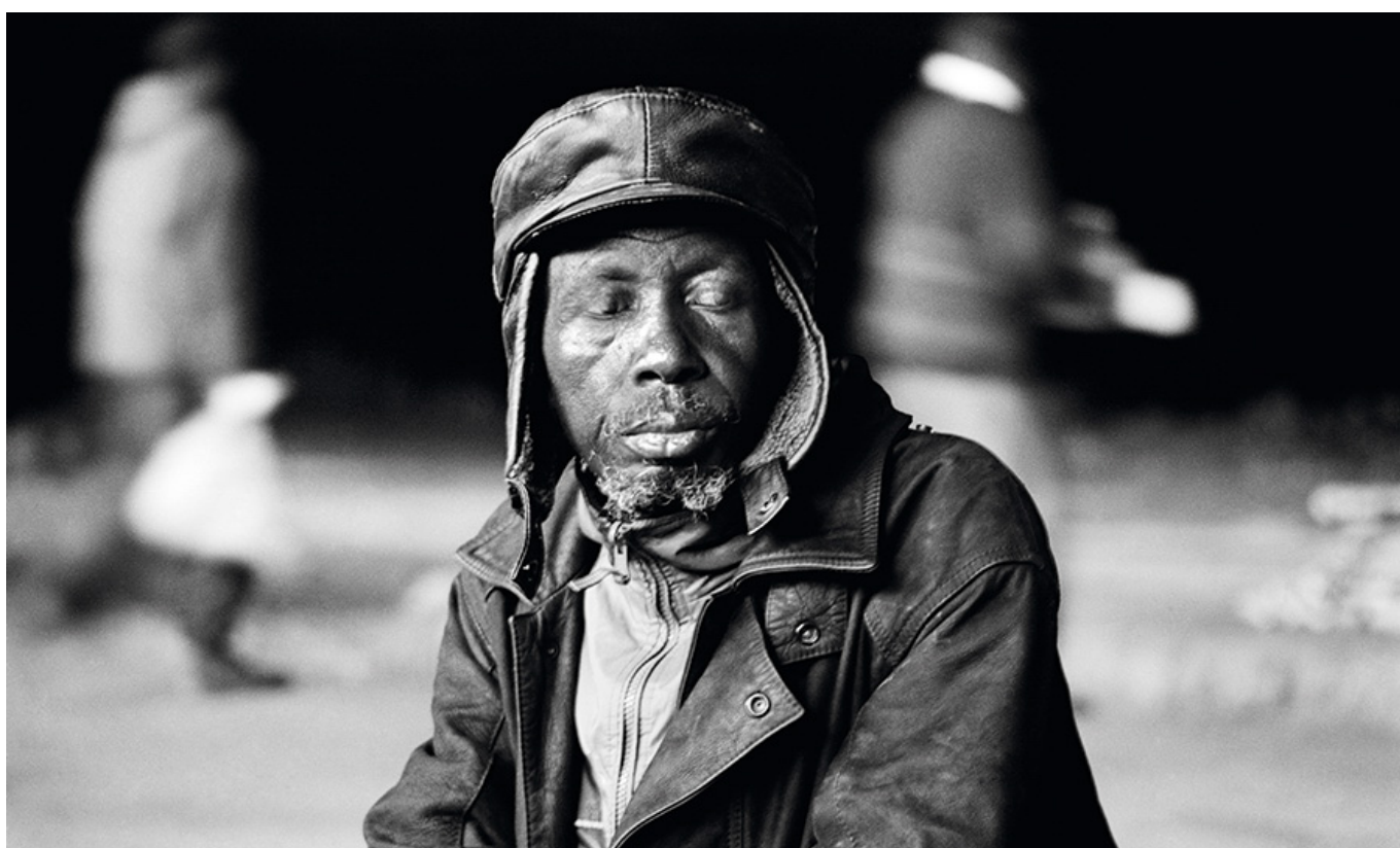
Santu Mofokeng, Eyes Wide Shut [Olhos bem fechados], Motouleng Cave, Clarens - Free State, 2004.