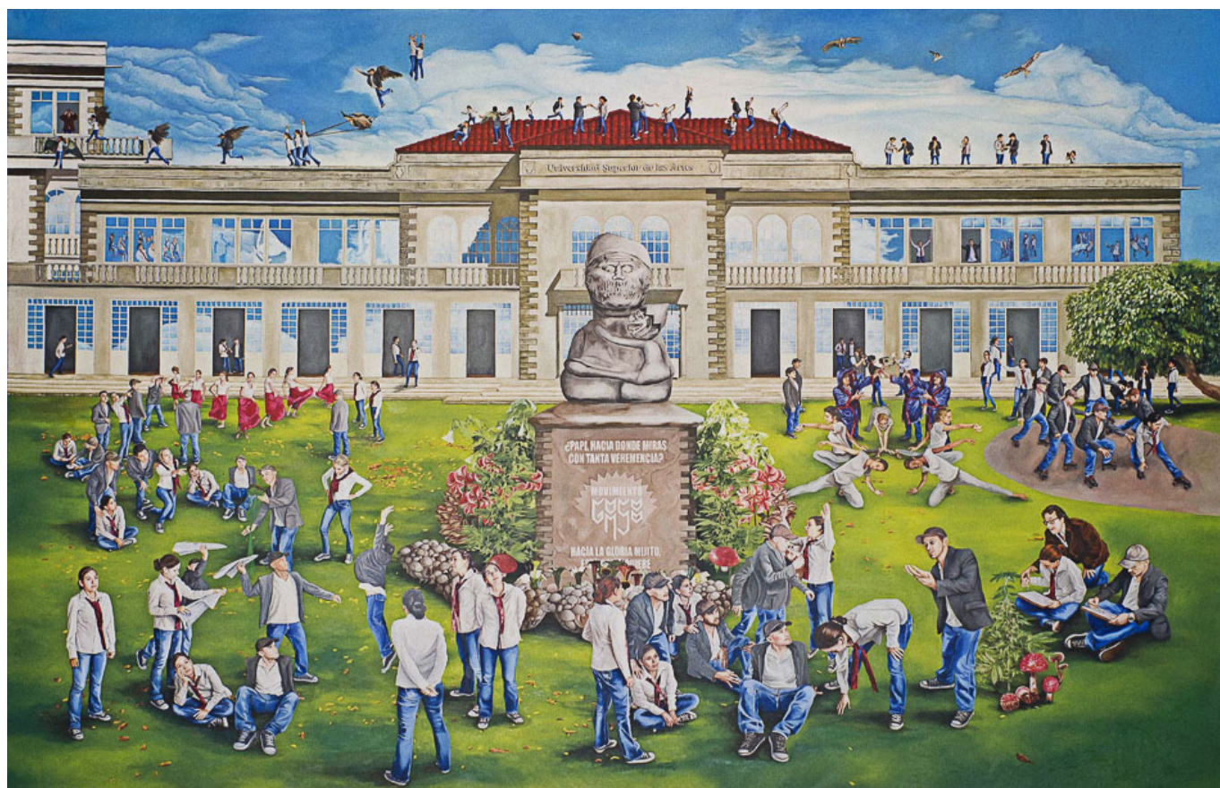
Oswaldo Terreros (Equador), Mural para la Universidad Superior de las Artes [Mural para a Universidade das Artes], 2012.