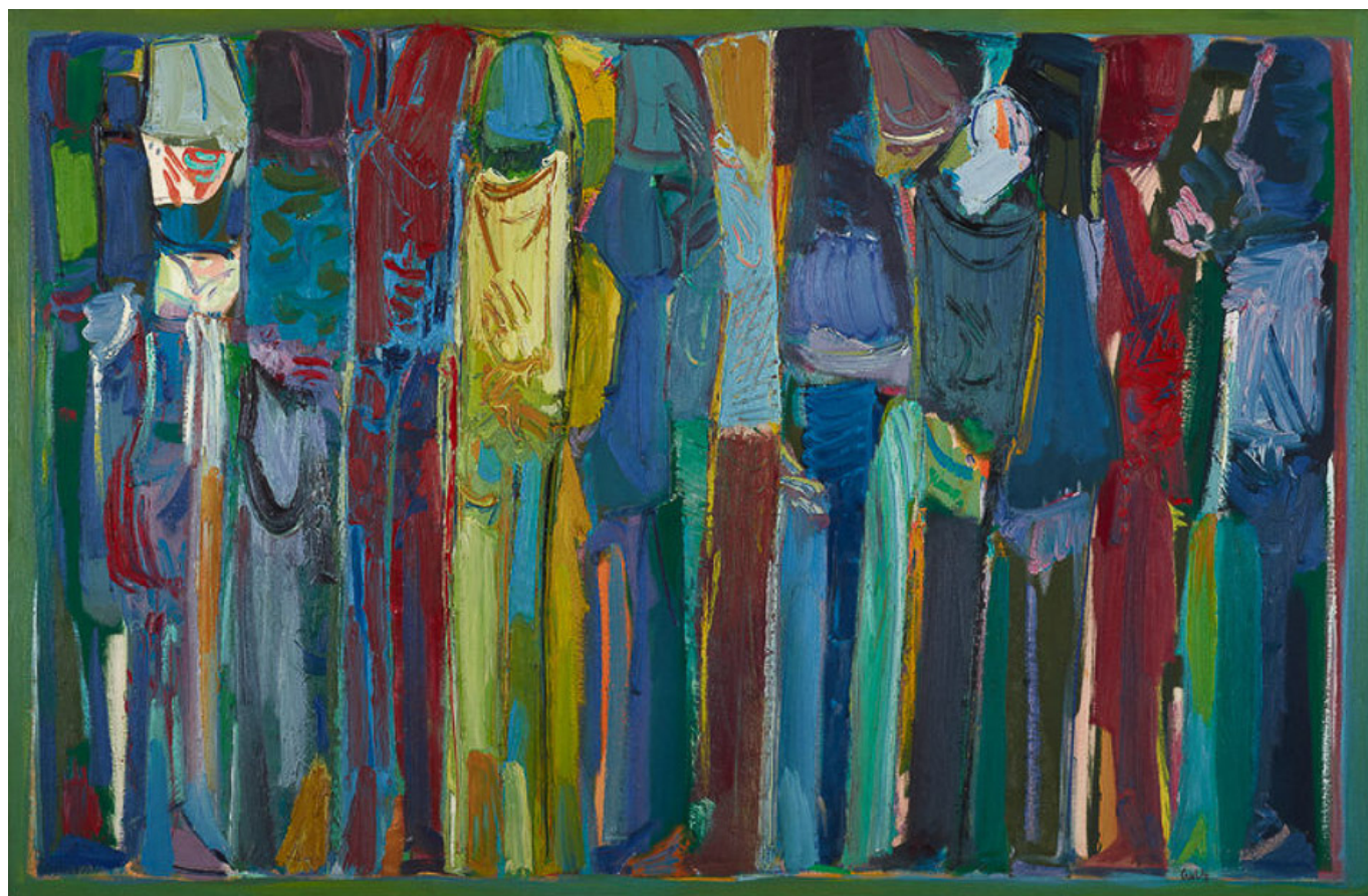
Paul Guiragossian (Líbano), La Lutte de l'Existence [A luta da existência] , 1988

O dinheiro inunda o sistema, devora a lealdade dos políticos, corrompe as instituições da sociedade civil e molda as narrativas da mídia. É essencial para as classes dominantes ter posse dos principais meios de comunicação e que esses meios modelem a maneira como as pessoas decifram o mundo ao seu redor. Embora a Declaração Universal dos Direitos Humanos das Nações Unidas afirme que “todos têm direito à liberdade de opinião e expressão” (Artigo 19), o fato é que a concentração da mídia nas mãos de algumas entidades corporativas circunscreve a liberdade para “transmitir informações e ideias através de qualquer mídia”. Por essa razão, a ONG Repórteres Sem Fronteiras tem um Monitor permanente sobre a propriedade dos meios de comunicação que rastreia a consolidação dos veículos do poder corporativo, responsável por liderar uma agenda política dentro dos sistemas governamentais existentes.