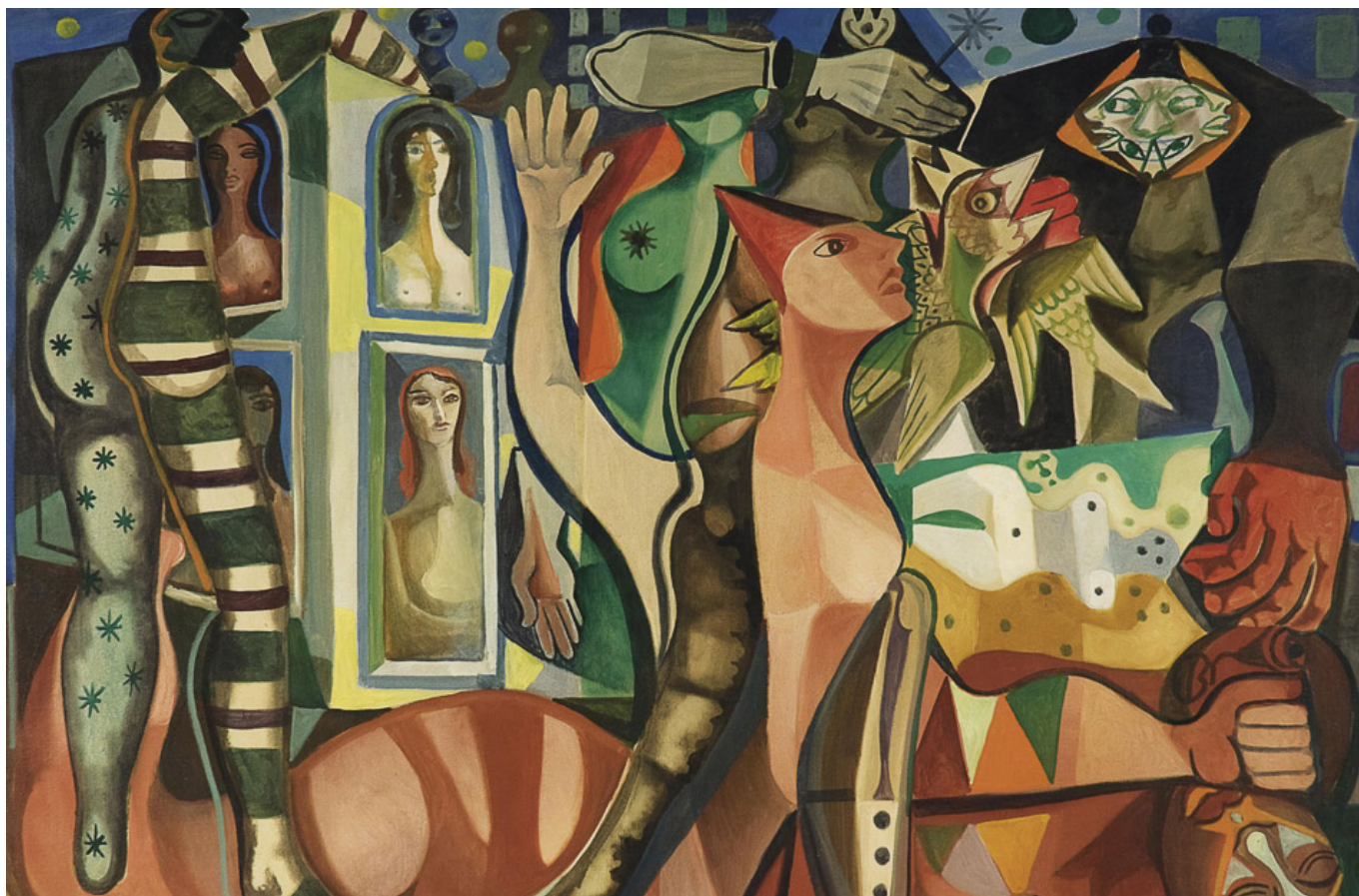
Emilianio di Cavalcanti (Brasil), Sonhos do carnaval , 1955.

Na América Latina, a extrema direita tem usado todas as armas para deslegitimar seus adversários, inclusive utilizando-se de leis de combate à corrupção de forma maliciosa contra as lideranças de esquerda. Essa é uma estratégia chamada “ lawfare ”, na qual a lei é usada – muitas vezes sem evidências – para destituir líderes de esquerda eleitos democraticamente ou para impedi-los de concorrer a cargos públicos. O lawfare foi usado para destituir o presidente hondurenho José Manuel Zelaya em 2009, o paraguaio Fernando Lugo em 2012 e a presidente brasileira Dilma Rousseff em 2016; esses líderes foram todos vítimas de golpes de Estado judiciais. O ex-presidente do Brasil, Luiz Inácio Lula da Silva, teve o direito negado de concorrer à presidência em 2018 por uma ação sem qualquer mérito em meio a pesquisas de opinião que o apontavam como favorito naquela corrida presidencial. A ex-presidente da Argentina, Cristina Fernández de Kirchner, enfrentou uma série de processos a partir de 2016, tudo isso a impediu de concorrer novamente em 2019 (hoje é vice-presidente, prova de sua popularidade no país).