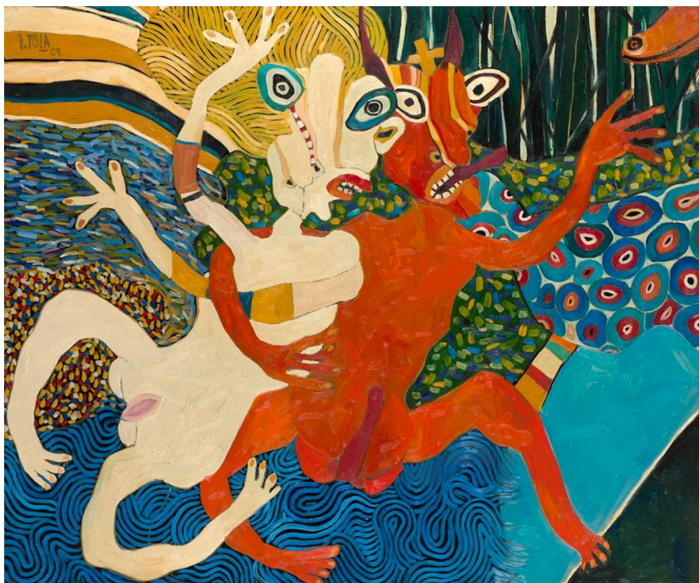
José Tola, El rapto de Europa [O rapto da Europa] , 2019

Sob a erupção vulcânica que colocou Áñez e Camacho no governo, está o crescimento, como uma lava, do movimento evangélico de direita. Nas eleições presidenciais de 2019, Áñez não era a porta-estandarte do evangelismo. Chi Hyun Chung (que ganhou quase 9% dos votos) e Victor Hugo Cárdenas (que ganhou 0,41% dos votos) tinham credenciais evangélicas mais fortes. Durante a preparação para a votação, Chi foi chamado de “Bolsonaro boliviano” . O sociólogo boliviano Julio Córdova Villazón descobriu que esses homens – Chi e Cárdenas – apagaram a separação entre Igreja e Estado e confiaram na vasta rede de igrejas evangélicas e programas de televisão para conduzir sua campanha. Após a eleição, Julio Córdova disse que foi Camacho, o homem que instalou Áñez na presidência, que legitimou seu autoritarismo por meio do “discurso religioso ao estilo de Bolsonaro”.