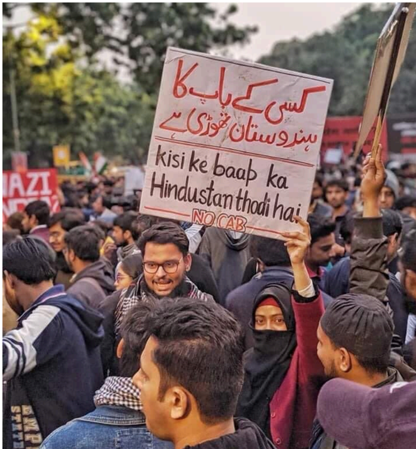
'This is Not Your Dad's India'. Protest in New Delhi, December 2019.

governo dos EUA – promoveram uma agenda de homofobia na África (Quênia, Nigéria e Uganda). Não é de admirar que essas correntes – incluindo a liderada por Áñez e Camacho – sejam acolhedoras com os militares e com o imperialismo. Mesmo que o impulso venha dos evangélicos dos EUA – ou do “islã made in USA” – ou da CIA, ele encontra seus aliados entre as elites dominantes e outros que conduzem uma agenda enraizada em formas religiosas mais antigas, mas armadas para chegar a seus objetivos.