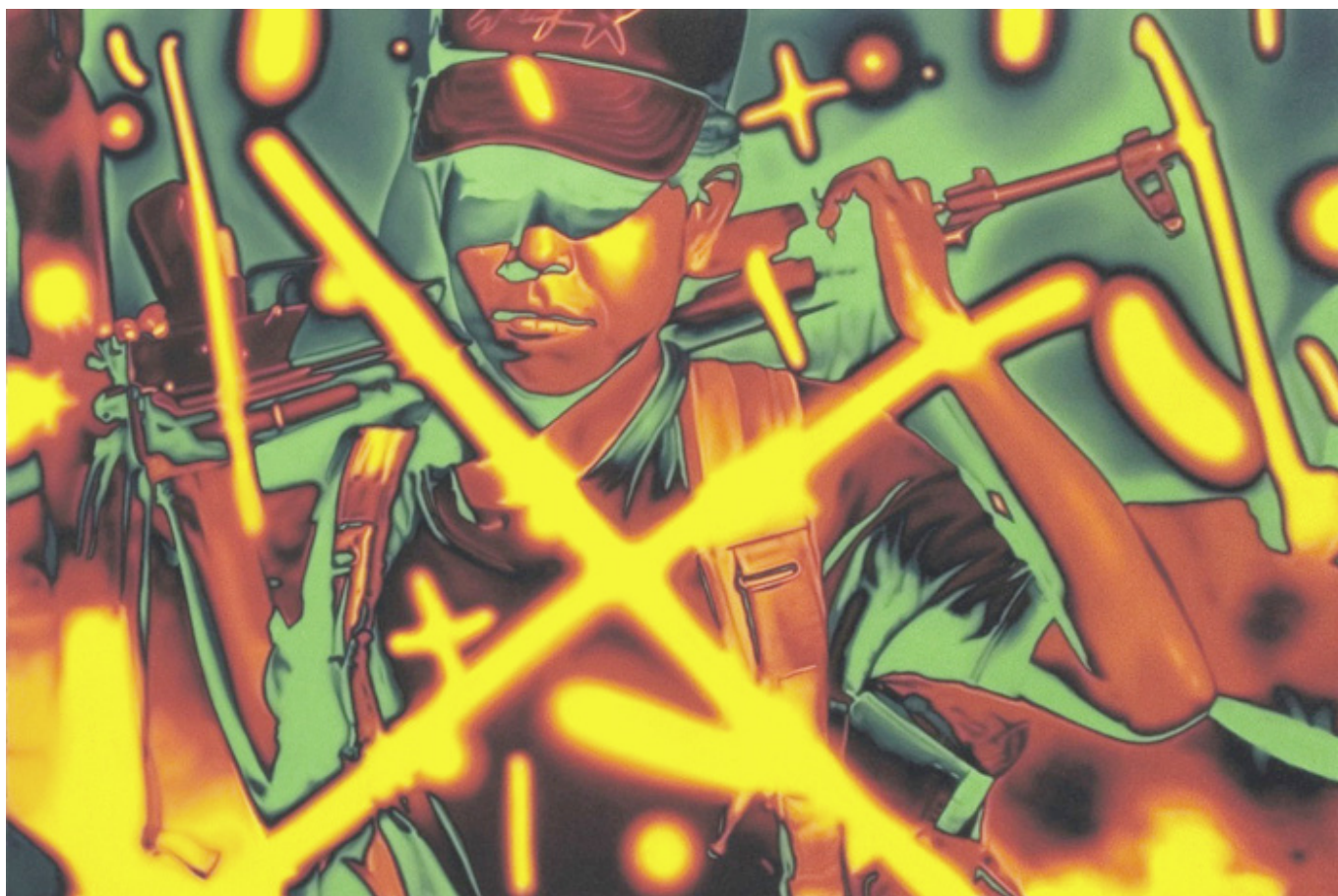
TV Santhosh, Blood and Spit , 2009.