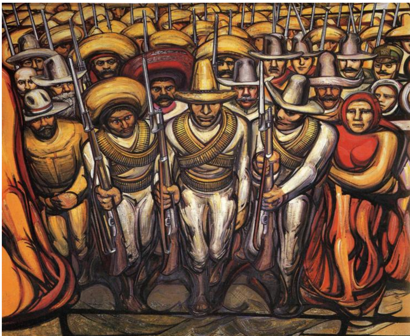
David Alfaro Siqueiros, 'Del Porfirismo a la Revolución' (1957-1966).

Em 21 de fevereiro, milhares de pessoas em todo o mundo se reunirão em locais públicos para o Dia dos Livros Vermelhos , que surgiu de três urgências: