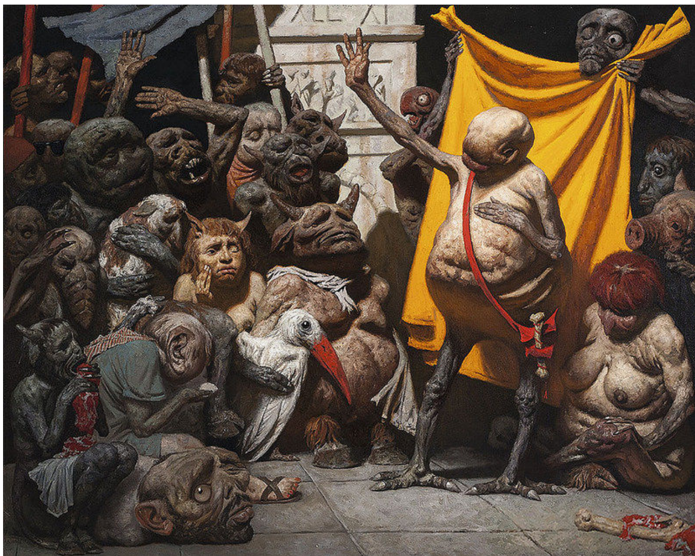
Geily Korzhev, Mutants , 1990-93.

O velho bolchevique, como o camarada Sankaraiah, apega-se a uma teoria de vida que coloca os humanos antes do lucro e a sensibilidade antes da ganância. A filosofia do capitalismo sugere que o paladar psicossocial pode ser reduzido à ganância ou, em linguagem mais científica, à maximização do lucro; o alcance emocional do empresário define os contornos do comportamento humano. Mas os seres humanos não são feitos só de ganância, pois amamos, pensamos, consideramos e – acima de tudo – nos importamos. Temos uma grande capacidade de empatia e simpatia.