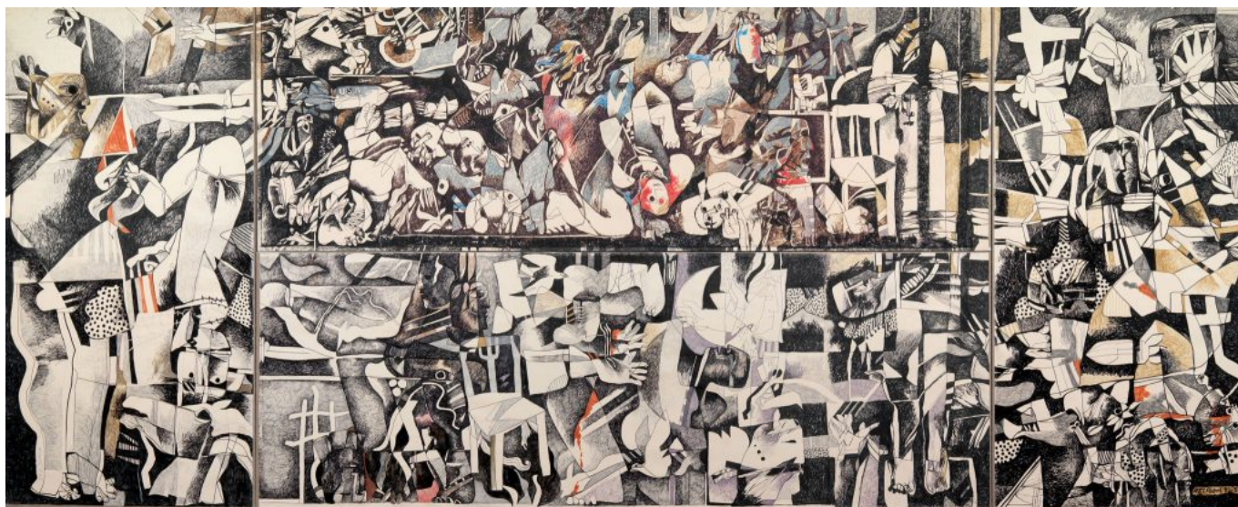
Dia al-Azzawi (Iraque), Massacre de Sabra e Shatila , 1982-83.

A jornada para uma nova Bandung já começou, mas levará tempo para germinar. Por fim, quando tivermos compreendido adequadamente o mundo pós-metropolitano, seremos capazes de desenvolver uma nova teoria de desenvolvimento e uma nova abordagem para as relações internacionais. A arma não será o primeiro instrumento utilizado para resolver disputas.