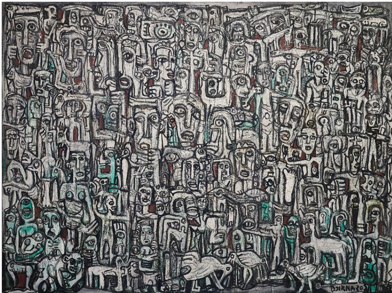
I Made Djirna (Indonesia), Totem Totem , 2021.

perigoso do que armas porque leva os seres humanos “a agirem de forma tola, irrefletida e perigosa”. No entanto, ele continuou, “não devemos ser guiados por esses medos, porque o medo é um ácido que grava as ações do homem em padrões curiosos. Seja guiado por esperanças e determinação, seja guiado por ideais e, sim, seja guiado por sonhos!”.