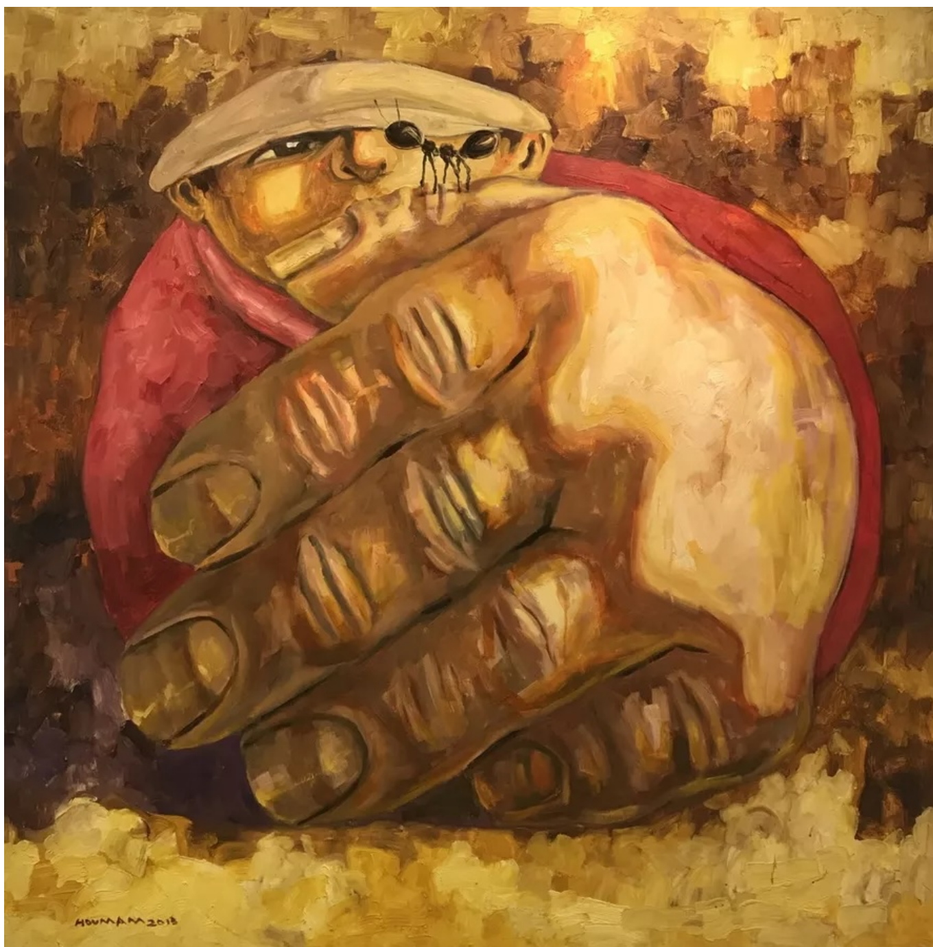
Houmam al-Sayed (Síria), Namle , 2012.