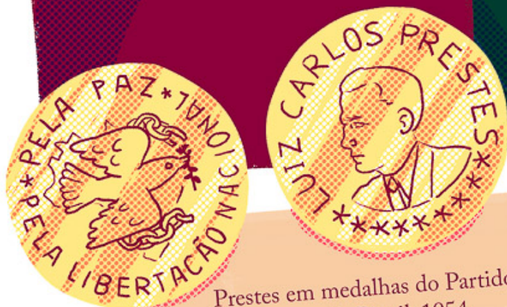
Prestes em medalhas do Partido Comunista do Brasil, 1954.