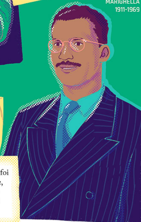
CARLOS MARIGHELLA 1911-1969

Logotipo da Vanguarda Popular Revolucionária.