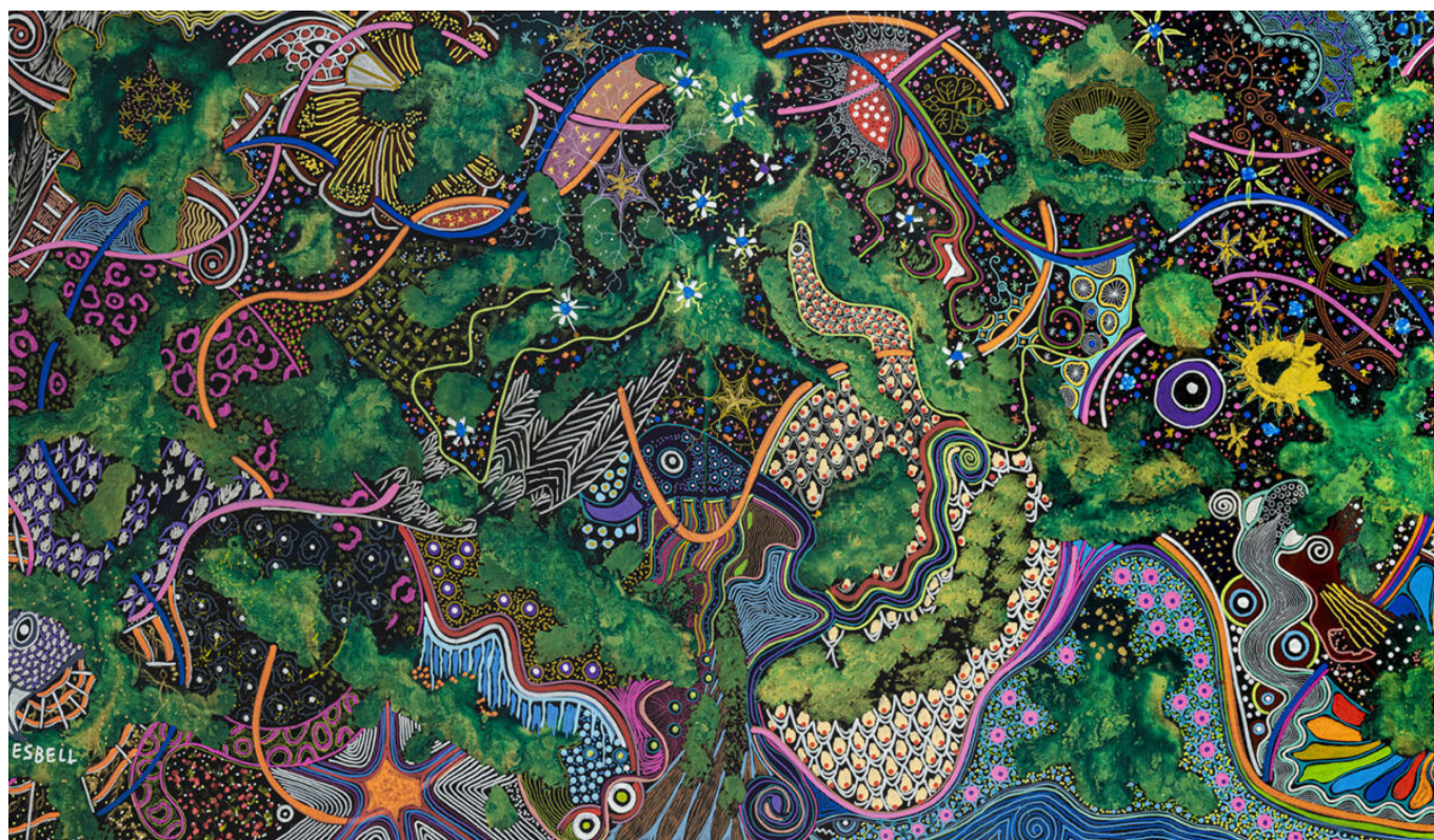
Jaider Esbell (Brasil), As entidades intergalácticas conversam para decidir o Futuro Universal da Humanidade , 2021