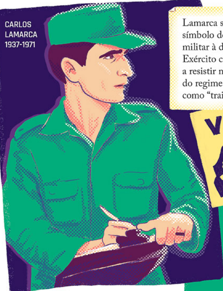
CARLOS LAMARCA 1937-1971

Lamarca se constitui como um grande símbolo dentro da organização de resistência militar à ditadura de 1964, desertando do Exército com armamentos e adeptos dispostos a resistir militarmente ao terrorismo de estado do regime e, por isso, é lembrado até hoje como “traidor” da corporação.