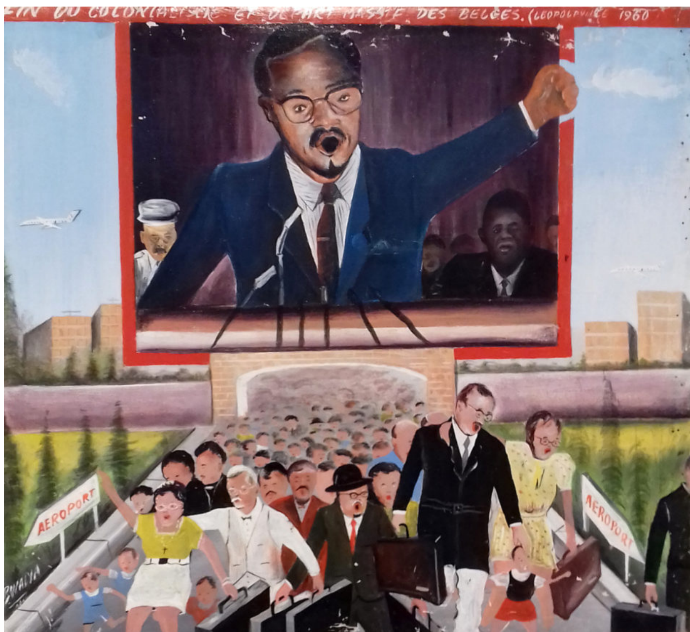
Dominique Bwalya Mwando (República Democrática do Congo), Discurso de Lumumba , 2005.

Nas décadas de 1970 e 1980, esses esforços se uniram no movimento de construção da Nova Ordem Mundial da Informação e Comunicação para enfrentar os desequilíbrios globais nessa esfera entre países desenvolvidos e em desenvolvimento. Essa ideia influenciou a Comissão Internacional para o Estudo dos Problemas de Comunicação da Unesco, ou Comissão MacBride, criada em 1977 e presidida pelo político irlandês e Prêmio Nobel Seán MacBride, que produziu um relatório importante, mas pouco lido, sobre o tema ( Many Voices, One World , 1980). Em 1984, os Estados Unidos se retiraram da Unesco em resposta a essas iniciativas. A privatização da mídia na década de 1980 acabou com qualquer tentativa do Terceiro Mundo de criar redes de mídia soberanas – mesmo quando essas redes eram anticomunistas (como a Asia-Pacific News Network, estabelecida em Kuala Lumpur, Malásia, em 1981).