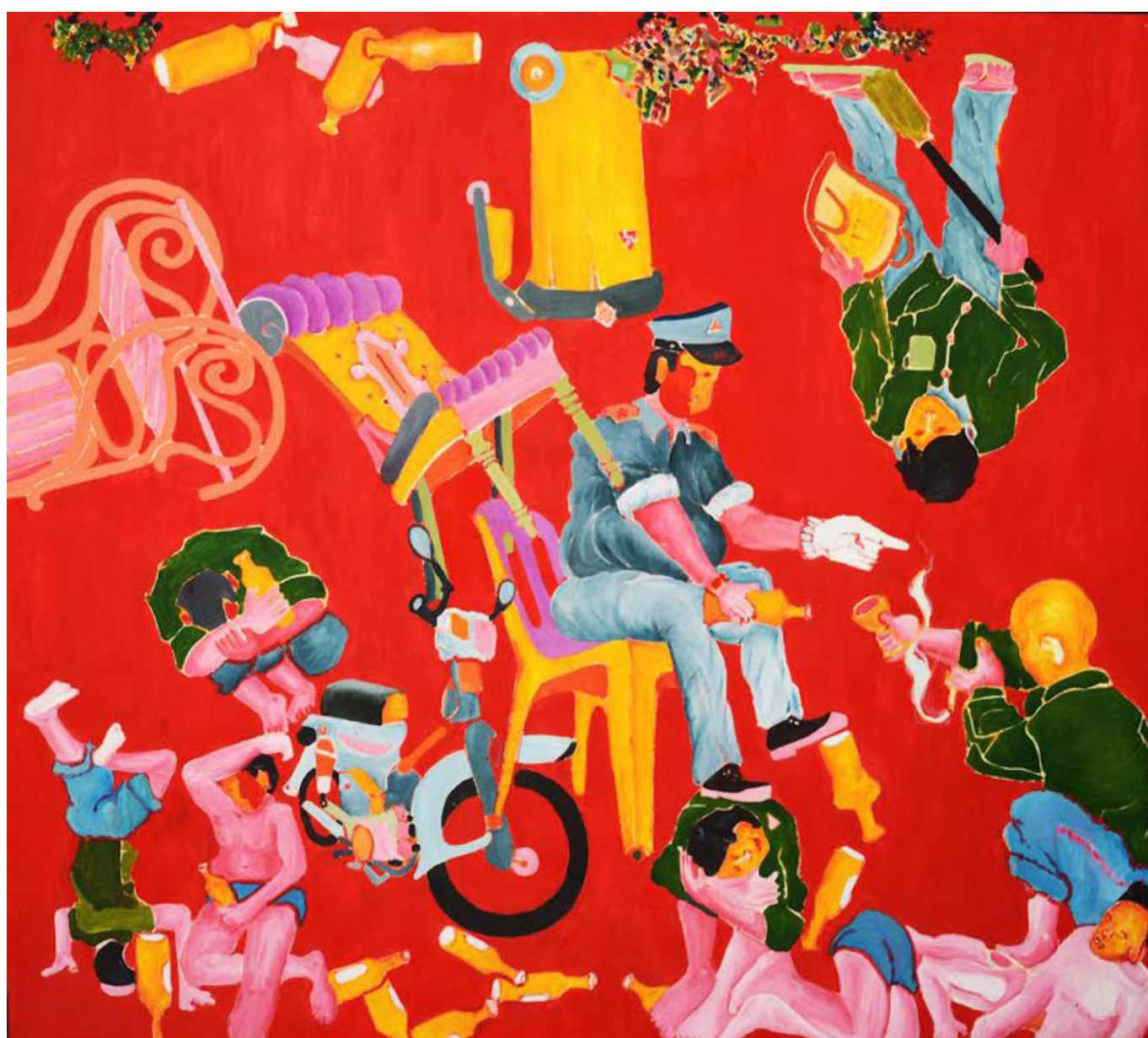
Meas Sokhorn (Camboja), Inverted Sewer [Esgoto Invertido] , 2014.