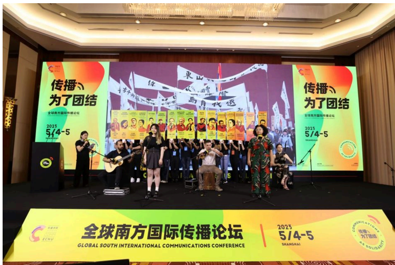
Apresentação cultural de abertura do Global South International Communication Forum, 4 de maio de 2023.

No entanto, nos últimos anos, esse sonho do livre fluxo de informações foi revivido por movimentos do Sul Global, frustrados pela quase total ausência de seus pontos de vista nos debates internacionais e pela imposição de uma visão de mundo estreita e estrangeira sobre seus países e os dilemas que enfrentam (guerra e fome, por exemplo). Como parte desse renascimento, centenas de editores e jornalistas do Sul Global se reuniram em Xangai (China) no início de maio para o Fórum Internacional de Comunicação do Sul Global. Ao final de dois dias de intenso debate, os participantes redigiram e votaram um Consenso de Xangai, que pode ser lido na íntegra abaixo.