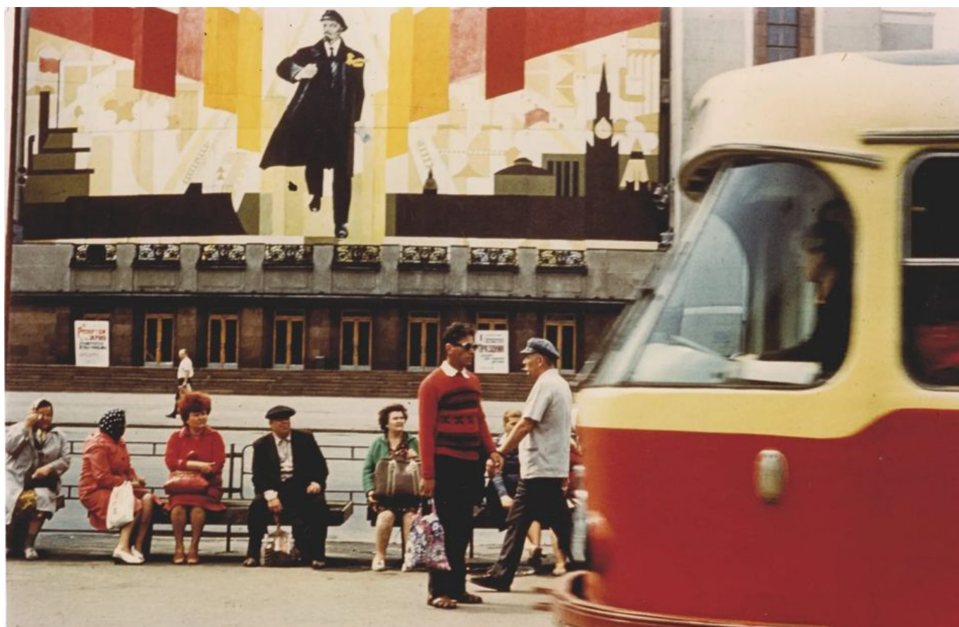
Boris Mikhailov (Ucrânia SSR), Vermelho , 1968-1975.

Oito contradições da ordem baseada nas regras imperialista | Carta semanal 10 (2023)