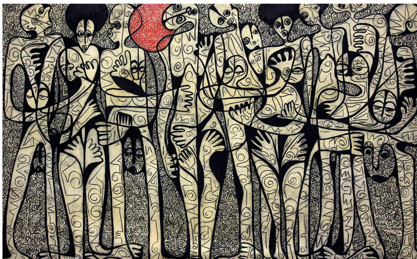
Victor Ehikhamenor (Nigéria), Lagos Hide and Seek , 2014.

O caminho inexorável desse sistema é destruir o planeta e a vida humana, ameaçar a aniquilação nuclear e trabalhar contra as necessidades da humanidade de recuperar coletivamente o ar, a água e a terra do planeta e impedir a loucura militar nuclear dos Estados Unidos. O capitalismo rejeita o planejamento e a paz. O Sul Global (incluindo a China) pode ajudar o mundo a construir e expandir uma “zona de paz” e comprometer-se a viver em harmonia com a natureza.