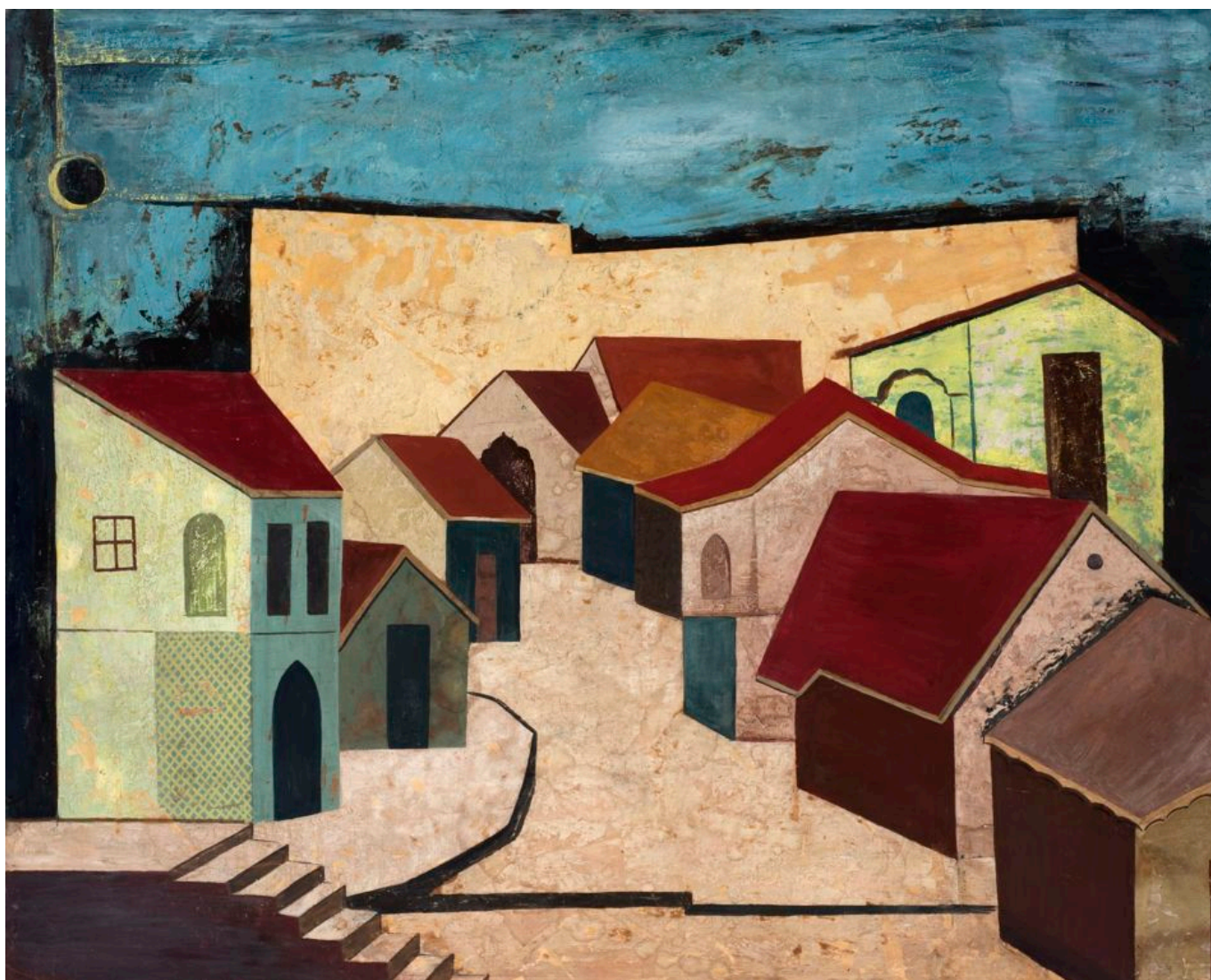
Ali Imam (Paquistão), Sem título (Deserted Town with a Black Sun) , 1956.