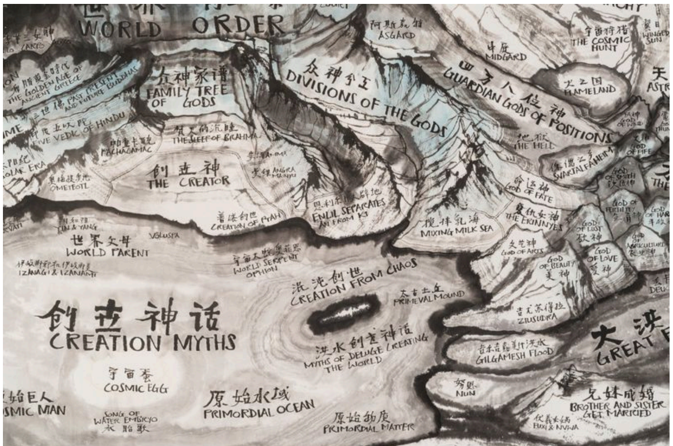
Qiu Zhi Jie (China), Map of Mythology [Mapa da mitologia] , 2019.

O Ministério das Relações Exteriores da China respondeu às notícias da expansão de Tindal e Pine Gap dizendo que “a decisão dos EUA e da Austrália aumenta as tensões regionais, mina gravemente a paz e a segurança regional e pode desencadear uma corrida armamentista na região”.