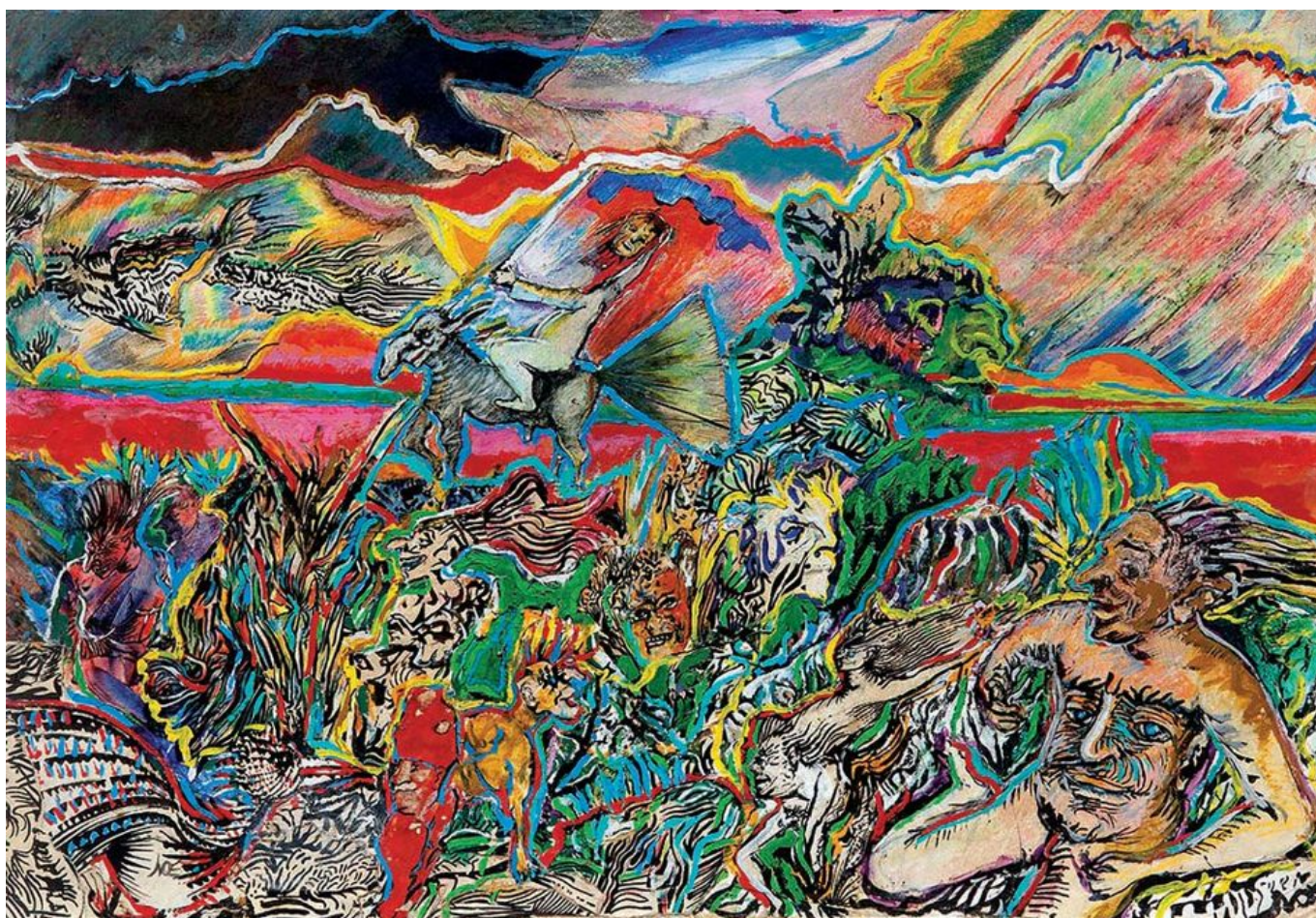
Luis Felipe Noé (Argentina), La naturaleza y los mitos II [A Natureza e mitos II] 1975.