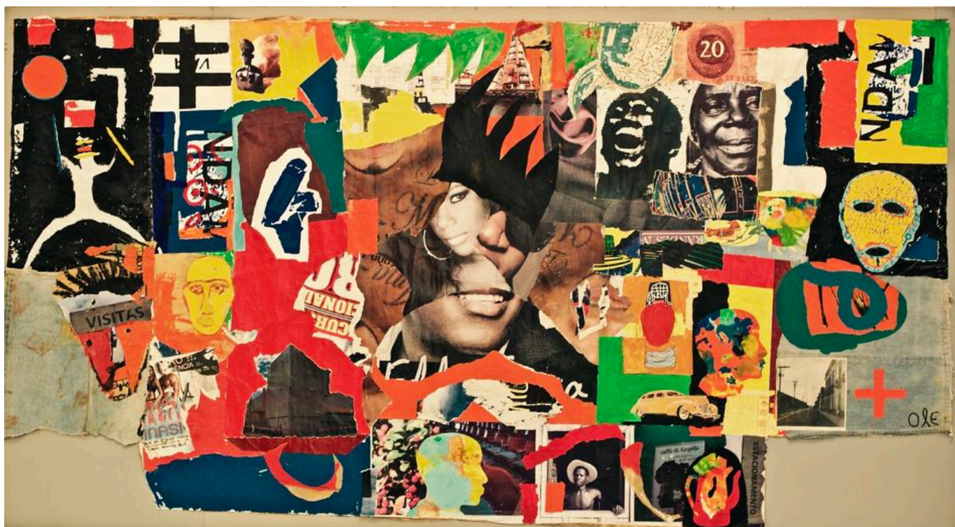
António Ole (Angola), The Maculusso Mural , 2014.